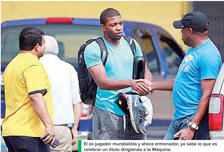
El ex jugador mundialista y ahora entrenador, ya sabe lo que es celebrar un título dirigiendo a la Máquina.