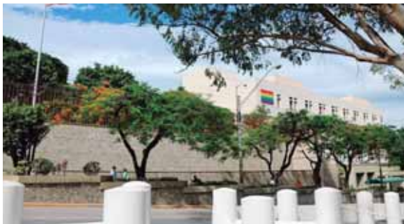
En el edificio de la Embajada no se ven las usuales filas, solo la bandera nacional y otra que conmemora el Mes del Orgullo LGTBI.

Insistió en que si se sientan, lo harán “con gente sin tacha y sin macha (...) pero de qué sirve que nos reunamos con los que siempre le han mentido al pueblo, de qué sirve que nos sentemos a dialogar con gente que tiene llamamientos judiciales”.