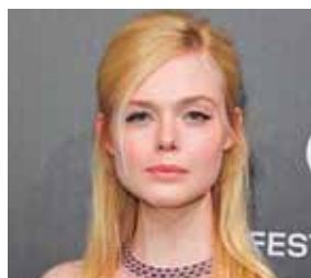
Con raya a un lado.