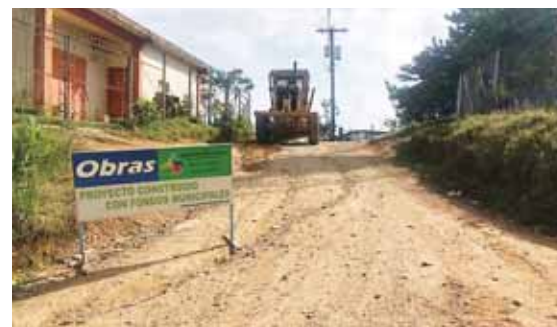
Las cuadrillas le están dando prioridad a las zonas que han sido afectadas por las lluvias.

También indicó que el bulevar Mackay es una de las rutas más transitadas de la ciudad, por el auge habitacional y el desarrollo económico que ha tenido la zona con la construcción de centros comerciales, centros educativos y la instalación de empresas.