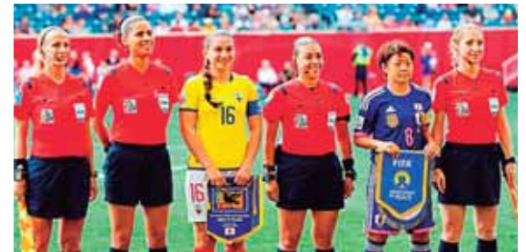
La árbitra catracha apareció en la inauguración del Mundial.