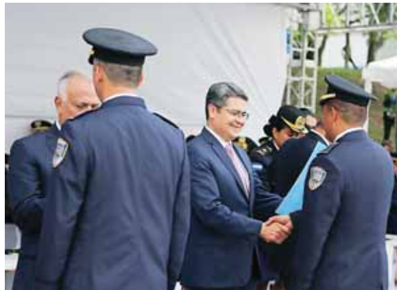
Durante los actos, el mandatario agradeció a los aliados y a todos los hondureños por el acompañamiento al proceso de reforma de la Policía.

El gobernante resaltó la cantidad de vidas que se han salvado, la labor de los policías de defender a la ciuda-