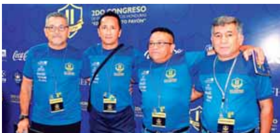
Los técnicos aprovecharon los breves descansos para tomarse fotos grupales frente al banner del Congreso.