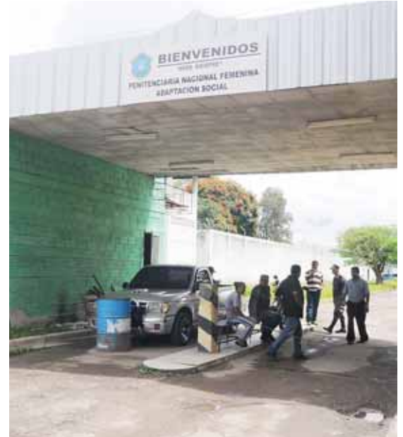
La detenida fue remitida a la Penitenciaría Nacional Femenina de Adaptación Social (PNFAS) de Támara.

Estaban en posesión de una camioneta color negro, placas PYY3659, dos pistolas, dos revólveres, cuatro celulares y una bolsa plástica con cinco onzas de marihuana y otras nueve pequeñas bolsas con hierba lista para vender.