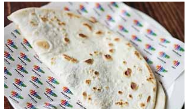
La baleada es un alimento tradicional de la zona norte, especialmente de La Ceiba y San Pedro Sula.

Oficinas de Atención al Cliente: Bo. Las Palmas 3ero Ave. 20 y 27 entre S.E. | Edificio Plaza Cristal Local #5A Colonia: Frente a Escuela Lila Luz de Maradiaga. | Mega Mall, Segundo nivel, Local LC-243.