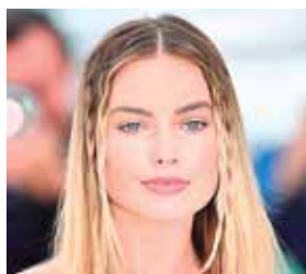
Las trencitas hippies.