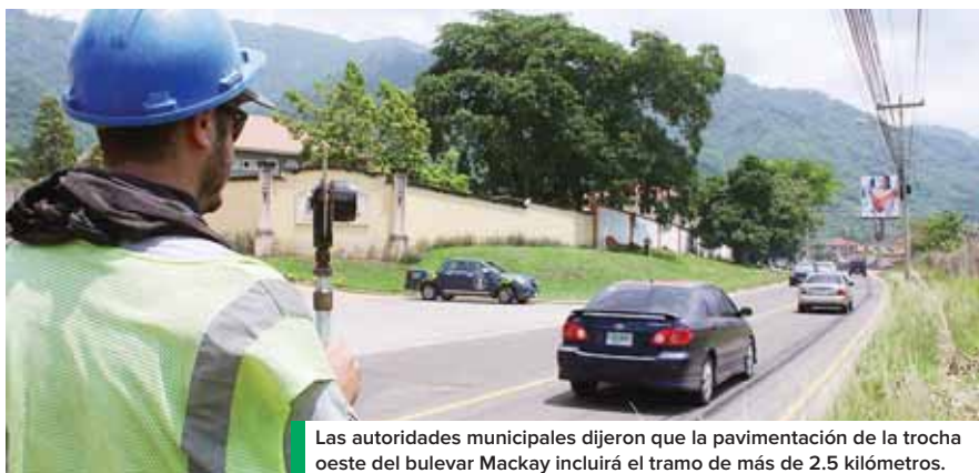
Las autoridades municipales dijeron que la pavimentación de la trocha oeste del bulevar Mackay incluirá el tramo de más de 2.5 kilómetros.