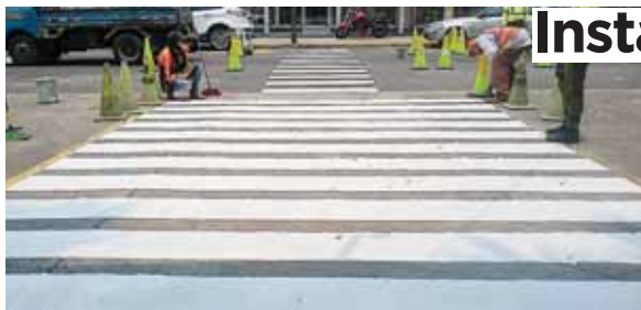
Con estos trabajos la alcaldía busca mejorar la vialidad en distintos barrios y colonias.

Alvarado manifestó que los equipos de trabajo atienden un promedio de 18 kilómetros de calle en cada zona donde se desplazan, con el propósito de mejorar la vialidad y la calidad de vida de los vecinos.