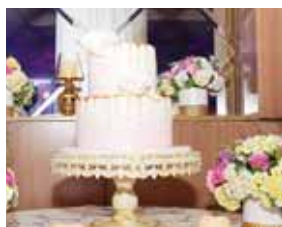
El rico pastel fue elaborado por Signature Cakes.