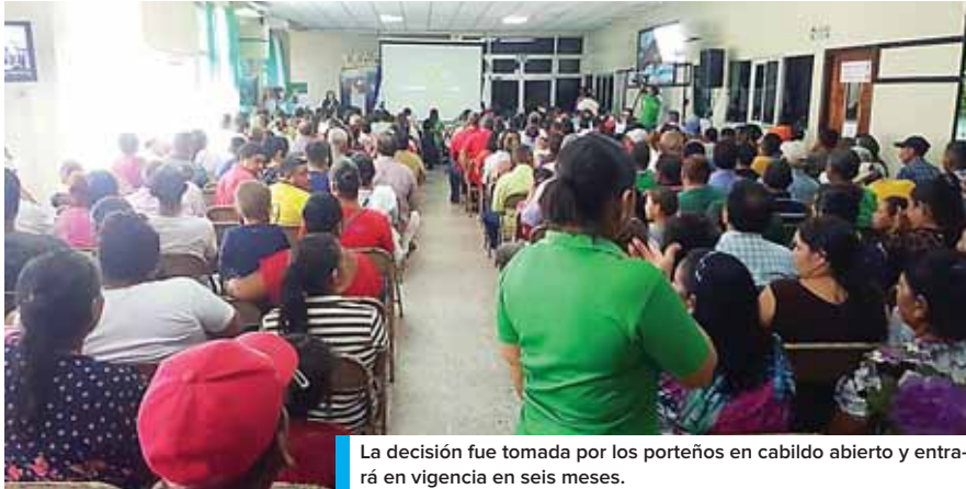
La decisión fue tomada por los porteños en cabildo abierto y entrará en vigencia en seis meses.