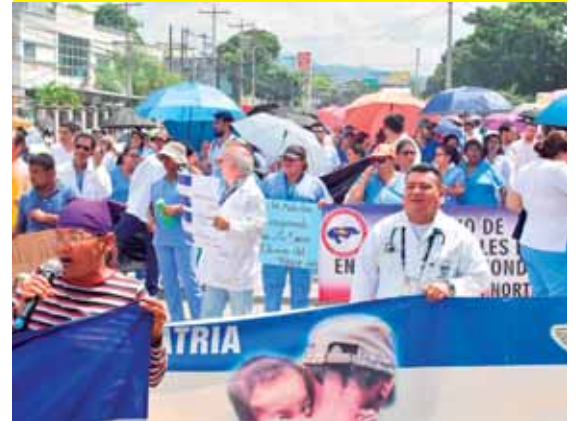
Los médicos asistieron irán hoy a una caravana con cacerolazos. Mañana se reunirán para adoptar nuevas acciones.

La deportación de hondureños, principalmente de México y Estados Unidos, aumentó un 45.9% entre enero y mayo de 2019, en relación al mismo periodo de 2018. En el 2019 fueron deportados 43,722 hondureños frente a los 29,968 del mismo periodo de 2018.