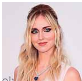
El semirrecogido con ondas.