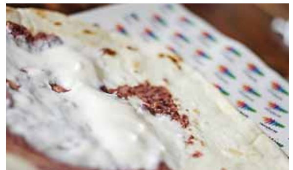
Al inicio solo se pedía con frijoles y mantequilla, pero los negocios la han diversificado, añadiendo embutido y huevo, por ejemplo.