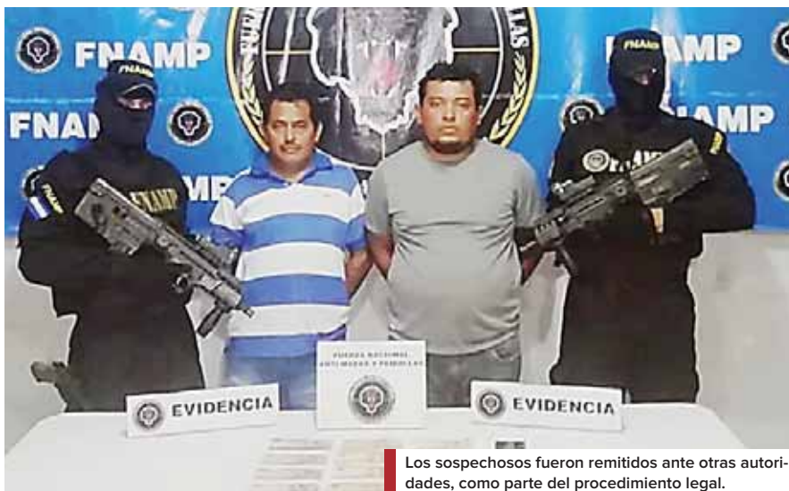
Los sospechosos fueron remitidos ante otras autoridades, como parte del procedimiento legal.