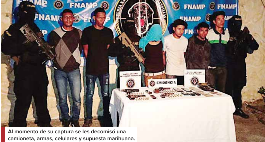
Al momento de su captura se les decomisó una camioneta, armas, celulares y supuesta marihuana.