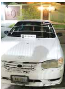
En este vehículo de transportaban cuando los apresaron.

Ambos fueron remitidos a los juzgados correspondientes, por suponerlos responsables de cometer el delito de extorsión continuada, en perjuicio de testigo protegido.