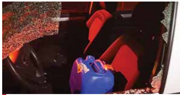
Un carro que habría sido usado por los maleantes fue encontrado incinerado y con un tambo con combustible, cerca del Río Blanco.