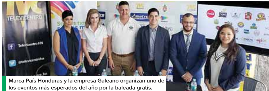
Marca País Honduras y la empresa Galeano organizan uno de los eventos más esperados del año por la baleada gratis.

"En el 2018, el evento fue todo un éxito; logró posicionarse entre la ciudadanía a nivel nacional a través de medios de comunicación escritos y televisados, así como en las plataformas digitales, tanto locales