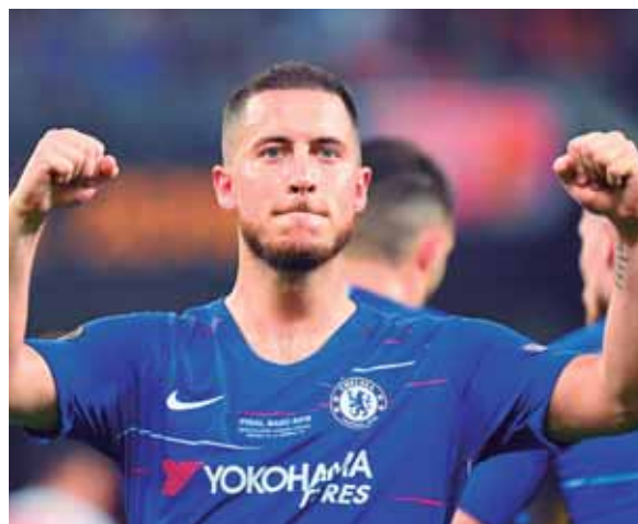
Hazard puede ser así el fichaje más caro de la historia del Real Madrid por delante de los 101 millones de euros que costó el galés Gareth Bale.