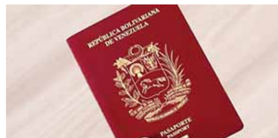
Los que poseen el documento, lo pueden seguir usando.