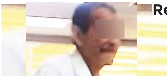
Según las investigaciones los hechos ocurrieron entre los años 2016 y 2017.

dijeron que el accidente sucedió alrededor de las 5:50 de la mañana de ayer, cuando el ahora occiso se trasladaba en su motocicleta hacia su trabajo, pero fue arrollado por el carro.