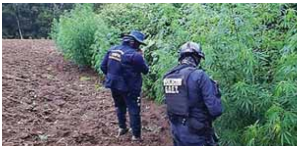
Tras el descubrimiento, los agentes procedieron a erradicar la plantación de la marihuana.