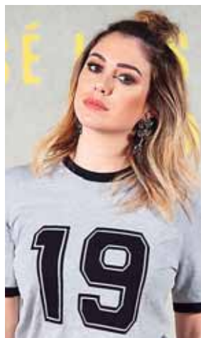
El moñito 'influencer'.

¡Magia! Con estos semirrecogidos parece que llevas el pelo suelto pero no te molesta en la cara y no dan calor.