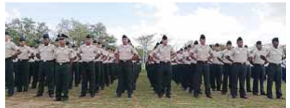
Las Fuerzas Armadas de Honduras por medio del CAME, tiene como prioridad formar y capacitar al personal de tropa.

pública, entre otros. En el 2018, las Fuerzas Armadas de Honduras a través del CAME, graduó a 5,769 nuevos soldados, los cuales se encuentran diseminados a nivel nacional, cumpliendo con diferentes misiones, “actuando de una manera profesional y enmarcadas en el irrestricto respeto a los Derechos Humanos”, señaló la institución castrense.