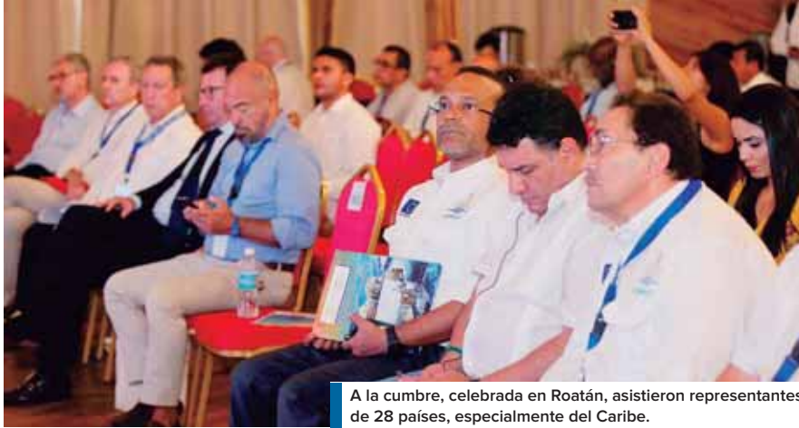
A la cumbre, celebrada en Roatán, asistieron representantes de 28 países, especialmente del Caribe.