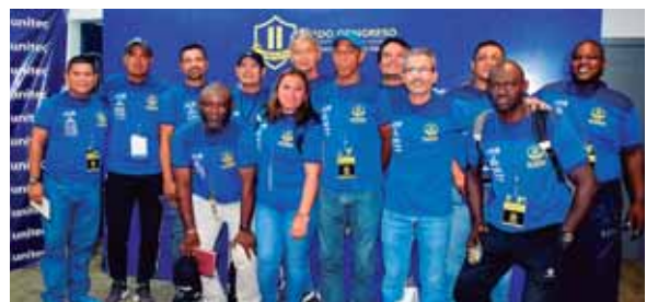
El evento ha servido también para estrechar lazos fraternales entre los entrenadores de todo el país.