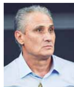
El seleccionador de Brasil llamó a Willian por Neymar.