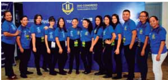
El staff del Congreso hizo una labor excepcional en estos tres días de trabajo.

El día de ayer, Etienne habló sobre los fundamentos para que los jóvenes puedan alcanzar las élites del fútbol y desnudó las falencias de los países que conforman la Concacaf cuando les toca enfrentarse a selecciones de otras áreas más desarrolladas.