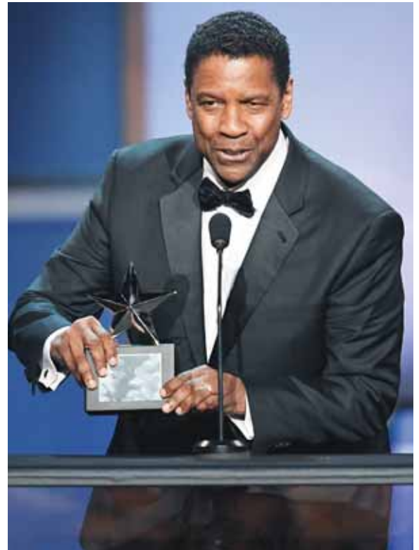
El actor recibió ese gran reconocimiento de parte de Hollywood.

del nuevo tema. Uno de los artistas más prolíficos de su generación, siempre a la vanguardia de nuevos sonidos, redefine lo que es el género del pop en tiempos actuales.