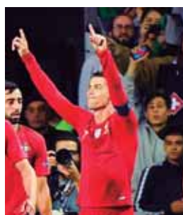
Portugal-Holanda juegan a las 12:45 del mediodía.