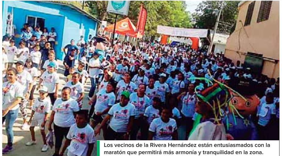
Los vecinos de la Rivera Hernández están entusiasmados con la maratón que permitirá más armonía y tranquilidad en la zona.

cipantes vinieran y que todos pasáramos por ahí sin ese temor porque la Rivera Hernández quiere buscar