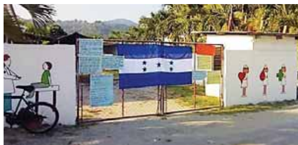
El jueves los pobladores hicieron un plantón y ayer en la mañana pusieron la Bandera Nacional e impidieron el acceso.

Las clases se imparten gratuitamente, a diario, gracias a la coordinación de la Oficina Municipal de la Juventud. La empresa Earoimpex presta sus instalaciones para la formación laboral. Los instructores indicaron que los jóvenes capacitados son de diferentes colonias de La Lima y se espera que al terminar el taller puedan laborar en cualquier fábrica de la zona o bien iniciar sus microempresas para generar sus productos que podrán ser distribuidos en los mercados de La Lima y San Pedro Sula.