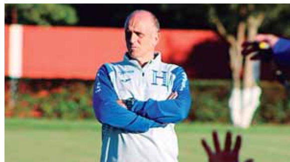
El profesor Fabián Coito seguramente hará cambios tácticos ante Brasil, ya que cuenta con jugadores mucho más peligrosos.