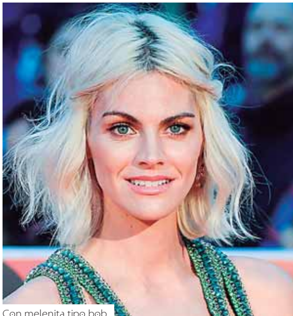
Con melenita tipo bob.

Si tu miedo a la hora de hacerte la melenita bob que tanto está de mo-