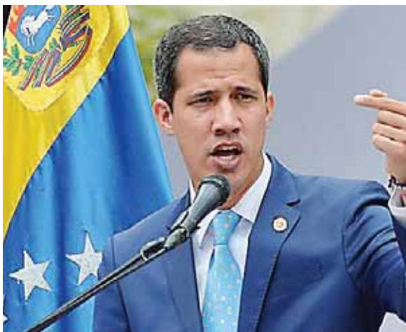
El líder opositor Juan Guaidó, autoproclamado presidente interino de Venezuela.

Delegados de Maduro y de Guaidó han mantenido dos rondas de diálogos exploratorios con la mediación del gobierno noruego desde mediados de mayo: ini-