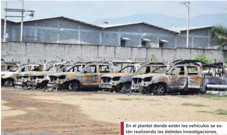
En el plantel donde están los vehículos se están realizando las debidas investigaciones.

Respecto a la hipótesis que muchas personas han realizado sobre la supuesta participación en el siniestro de empleados que habían sido despedidos, refirió que ellos (empresa) no son la autoridad compe-