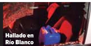
Hallado en Río Blanco

TAL Y COMO TESTIGOS INFORMARON A DIARIO EL PAÍS, EN ALGUNAS UNIDADES HABÍA TAMBOS AZULES CON COMBUSTIBLE. UNO DE LOS AUTOMOTORES INCINERADO CERCA DE RÍO BLANCO TENÍA UN RECIPIENTE /32