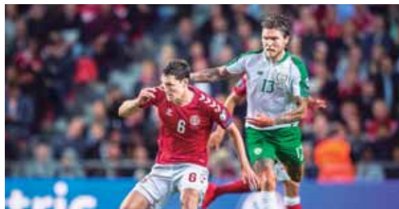
Dinamarca tropezó en casa y se queda con dos puntos, mientras que Irlanda es líder del Grupo D con siete unidades.

Quien se metió en problemas fue Dinamarca, que no pasó del empate en casa frente a Irlanda (1-1) y marcha en el cuarto puesto en su grupo D, a dos puntos de Suiza (2º). En el grupo G, Polonia consolidó su liderazgo con su victoria ante Macedonia del Norte (1-0) y en la llave B Ucrania pasó por encima de Serbia (5-0) para situarse como primera. AFP