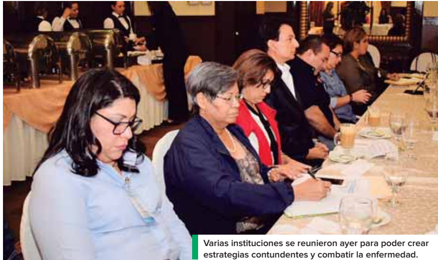
Varias instituciones se reunieron ayer para poder crear estrategias contundentes y combatir la enfermedad.

“Estamos reunidos con el propósito de unir esfuerzos y redoblar los esfuerzos que hemos realizado desde enero. Habíamos elaborado un plan de acción, habrá que retomar y replantear ese plan que hemos elaborado por la incidencia