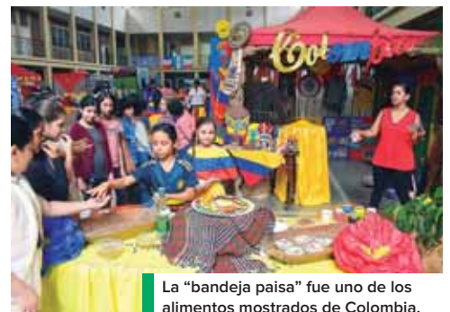
La “bandeja paisa” fue uno de los alimentos mostrados de Colombia.