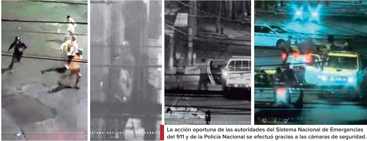
La acción oportuna de las autoridades del Sistema Nacional de Emergencias del 911 y de la Policía Nacional se efectuó gracias a las cámaras de seguridad.