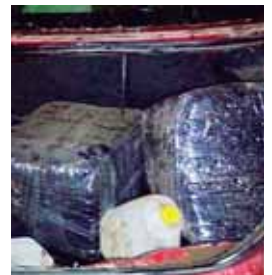
La supuesta droga fue hallada en el baúl de un vehículo.