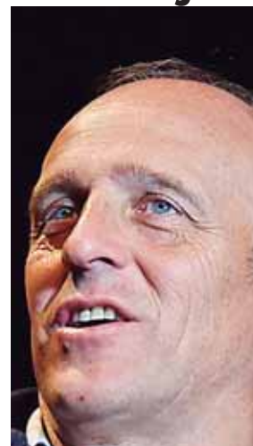
Le desanimó que los contratos siempre fueron a término.