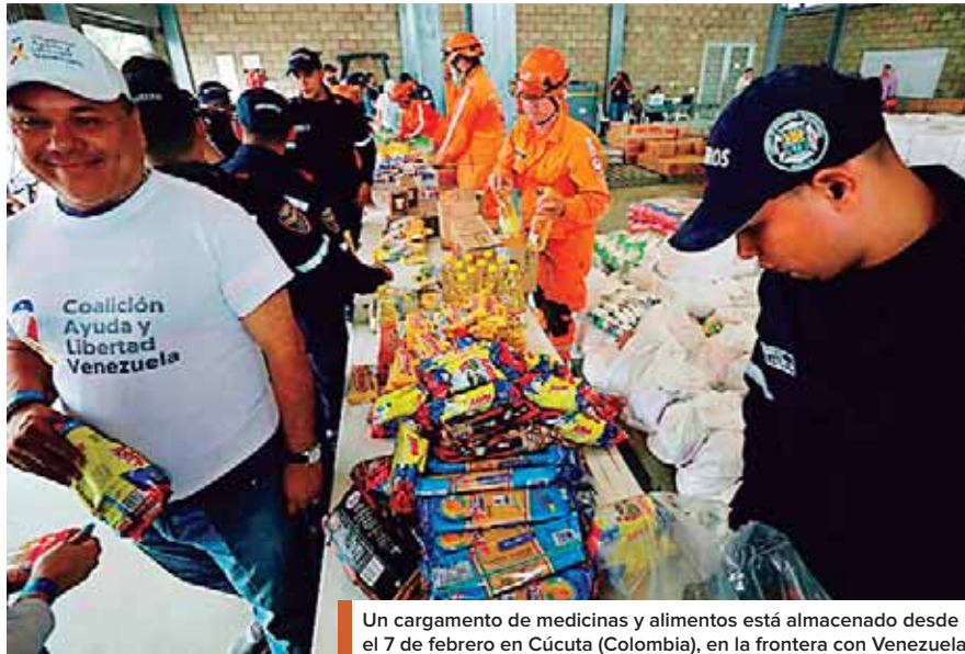
Un cargamento de medicinas y alimentos está almacenado desde el 7 de febrero en Cúcuta (Colombia), en la frontera con Venezuela.

Un cargamento de medicinas y alimentos está almacenado desde