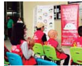
Ayer se realizaron actividades para hacer conciencia a los padres sobre los síntomas.

“Gracias a Dios ha reaccionado bien al tratamiento, cuando empezamos tenía el 4% de células malas. A la segunda semana ya no tenía células malas, pero igual tenemos que esperar los dos años y me-