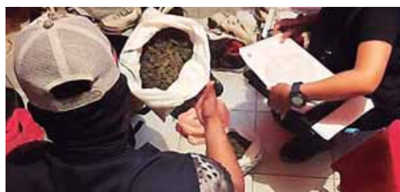
Los agentes de investigación decomisaron droga.

Asimismo, incineraron más de 50 mil plantas de marihuana