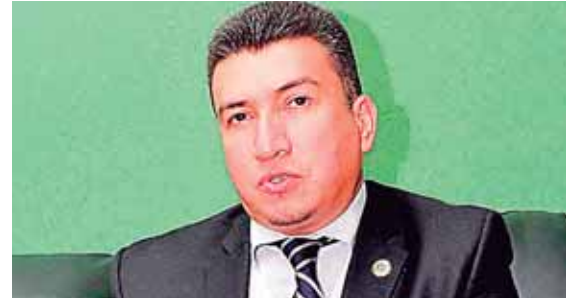
De acuerdo al presidente de la Corte Suprema de Justicia, Rolando Argueta, el objetivo es ser más eficientes.

El gobierno de Alemania donará 11 millones de euros (L.30.3 millones) para 11,350 familias afectadas por la sequía 11 municipios del Corredor Seco. Hetze Tosta, vocera del PMA, confirmó que los departamentos beneficiados son de la zona sur y occidente de Honduras.