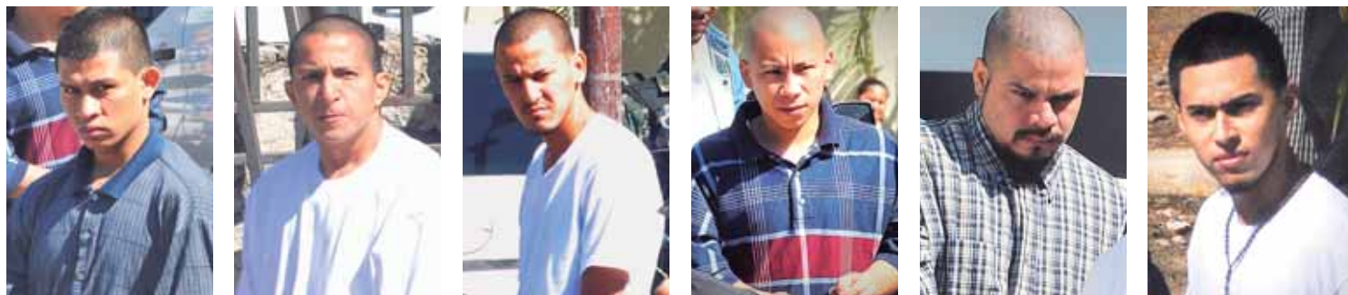
Parte de los acusados e implicados en el asesinato del comunicador ocurrido el 17 de enero de 2017, cuando acababa de salir de en una tienda en San Pedro Sula.

Por todos estos delitos, el Ministerio Público pedirá un fallo condenatorio para los implicados en dicho hecho.