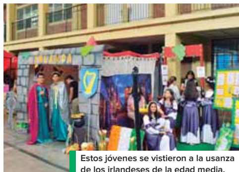
Estos jóvenes se vistieron a la usanza de los irlandeses de la edad media.