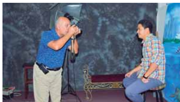
Los fotógrafos han tenido que cambiar sus cámaras de rollo por las digitales para estar a tono con la modernidad.