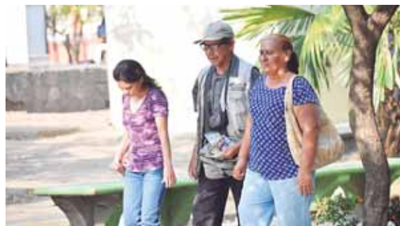
Los fotógrafos del parque sampedrano manifestaron que hasta se pelean a los clientes. Cobran L50 por cuatro fotos tamaño carné.