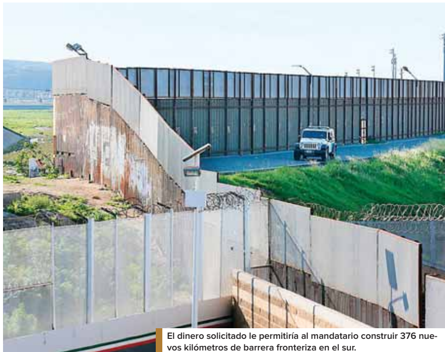
El dinero solicitado le permitiría al mandatario construir 376 nuevos kilómetros de barrera fronteriza en el sur.

Poco después, Trump promulgó la legislación derivada del acuerdo presupuestario del Congreso, que evita otra paralización del gobierno y autoriza el desembolso de un monto limitado de dinero para construir el muro. Trump firmó el documento en la Casa Blanca ayer, viernes, dijo la vocera Sarah Sanders.