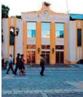
Las alcaldías de San Pedro Sula y Choluteca serán de las primeras.

Aclaró que todo obedece a una programación de acuerdo al artículo 222 constitucional y no a denuncias por algún tema particular.