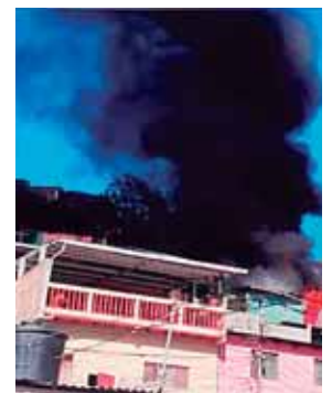
Los afectados solicitaron al presidente Juan Orlando Hernández, les ayude.

El fluido eléctrico fue suspendido por parte de las autoridades de la Empresa Energía Honduras para evitar que se