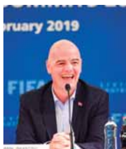
El presidente de la FIFA quiere en Catar más selecciones.