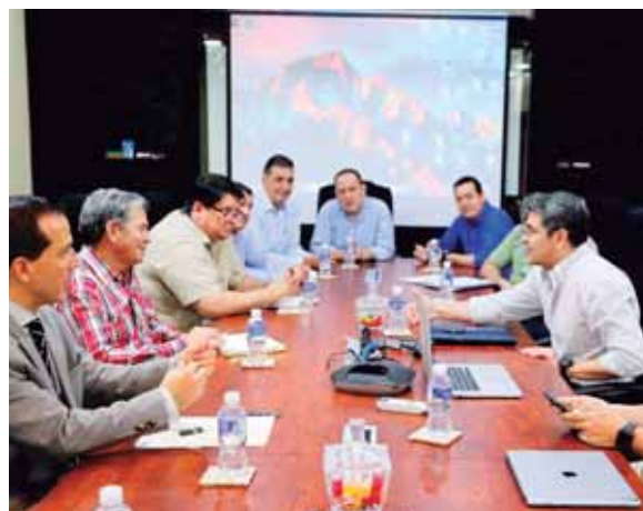
En la reunión estuvo el presidente Hernández; el presidente del BCH, Wilfredo Cerrato y el comisionado de Convivienda, Sergio Amaya, entre otros.

mento los operadores de justicia recibían bonos de 130 mil lempiras y ahora tendrán un bono de hasta 140 mil lempiras, mientras que los bonos para vivienda unifamiliar que recibían 115 mil ahora tendrán uno de 120 mil”.