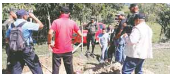
Como parte de las acciones, Medicina Forense realizó varias exhumaciones a fin de esclarecer muertes violentas.