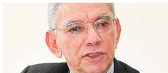
Para el exministro de Finanzas, Arturo Alvarado, la experiencia internacional con bancos de desarrollo es negativa.