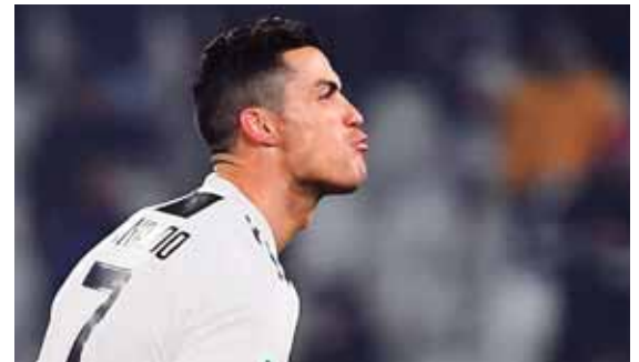
Cristiano Ronaldo jugó pese a que se había anunciado su ausencia pensando en la Champions.