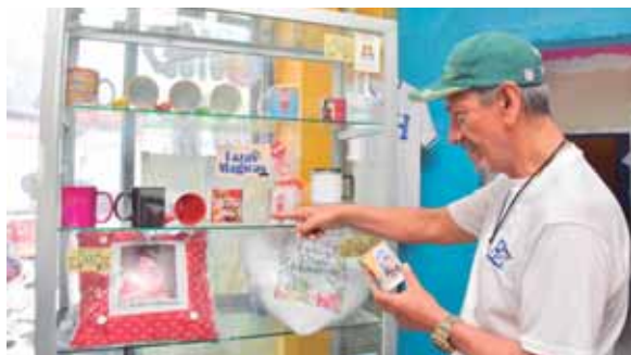
Los fotoestudios han sido creativos y ahora ofrecen tazas, llaveros, almohadas y camisas con las fotografías que el cliente desee.

Considera que la salida de celulares de alta gama les ha perjudicado. “La gente toma las fotos de sus eventos, pero no imprimen