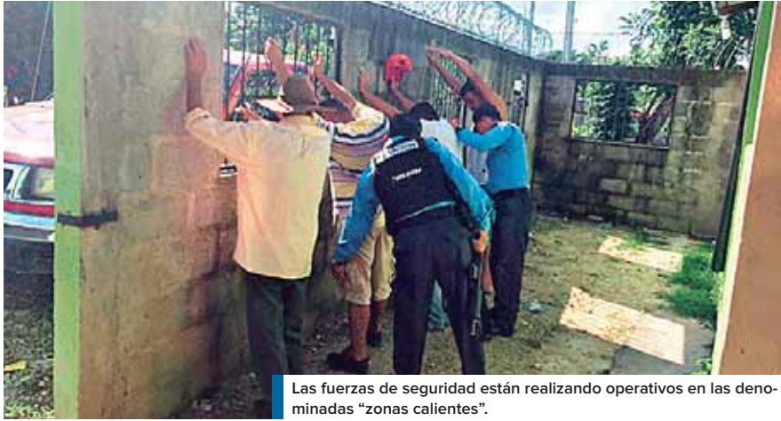
Las fuerzas de seguridad están realizando operativos en las denominadas "zonas calientes".