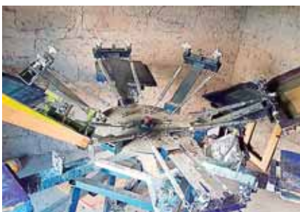
En el interior de la casa estaba la maquinaria usada para empacar los medicamentos.