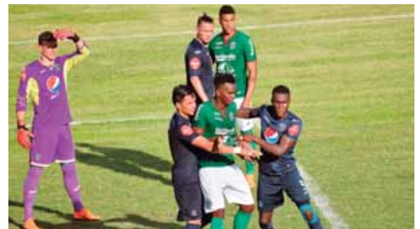
Será un encuentro de dientes apretados, donde un gol puede definir el partido.

Marathón lleva 26 partidos en su estadio invicto y la última vez que perdió en su guarida fue justamente ante Motagua. Habrá que decir que la serie entre los dos en la cueva es muy pareja, pues de los 14 partidos, apenas hay tres empates, 6 victorias de Marathón y 5 de Motagua. Se han marcado 34 goles, de los cuales la afición local gritó 20.