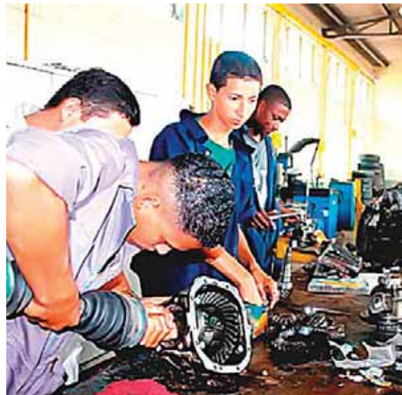
El Infop es una institución de formación profesional y debe velar para que las personas que forme, mejoren sus capacidades.

Esos términos son parte del diálogo y el trabajo que deben desarrollar entre empleadores y obreros, para llegar a tener una institución que su fin primordial sea la formación de la mano de obra hondureña calificada, concluyó Madero.