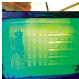
La Policía presume que en este molde hacían las pastillas.

En la acción policial no lograron capturar a ninguna persona que trabajaba en ese laboratorio clandestino.