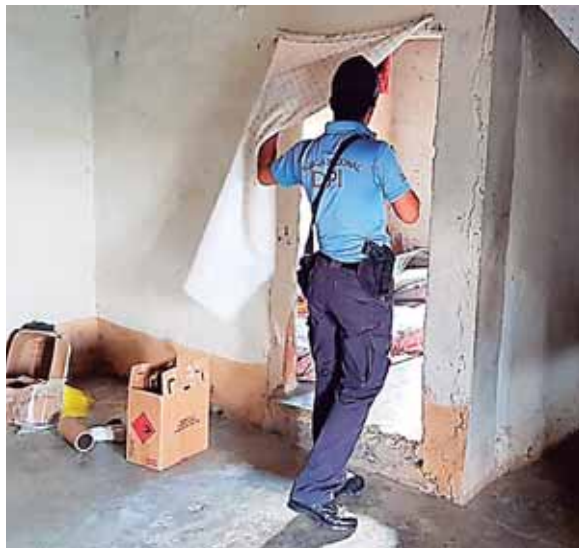
Los detectives se trasladaron hacia la aldea de Corralitos donde descubrieron la fábrica ilegal.

fuerza de seguridad halló maquinaria con la que se realizan las impresiones y moldes de las pastillas. Asimismo, encontraron cajas ya listas para su distribución, varios paquetes de pastillas las cuales estaban siendo empacadas, pintura y papel aluminio entre otras evidencias.