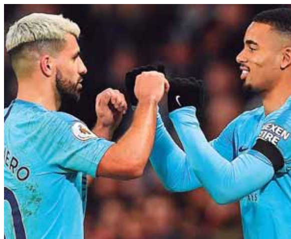
Manchester City se mide al Newport de la cuarta división, sin duda un rival bastante aceptable para los de Guardiola.