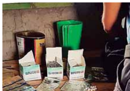
Dentro del laboratorio, los agentes de la DPI hallaron varias pastillas para el dolor de cuerpo.