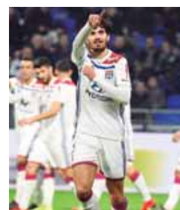
Ante el colista el Lyon no jugó el mejor partido del torneo.