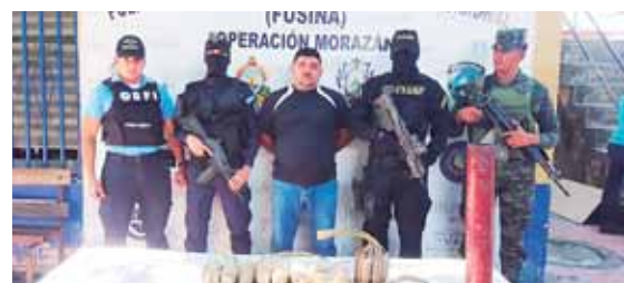
El imputado, de 38 años de edad, fue capturado en la colonia Suyapa y en su vivienda los policías le hallaron varias bombas.

La Policía Nacional, después de la balacera, efectuó varios operativos para dar con los responsables de este doble crimen que enluta a otra familia en el sur del país.