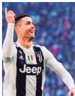
Cristiano Ronaldo vuelve a la acción tras las vacaciones.