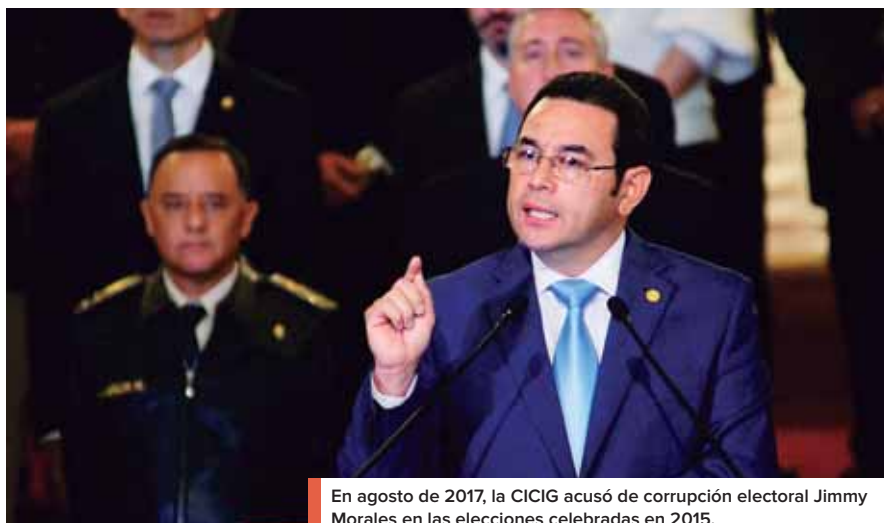
En agosto de 2017, la CICIG acusó de corrupción electoral Jimmy Morales en las elecciones celebradas en 2015.