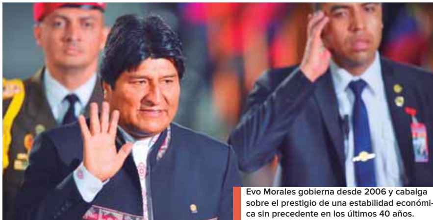
Evo Morales gobierna desde 2006 y cabalga sobre el prestigio de una estabilidad económica sin precedente en los últimos 40 años.