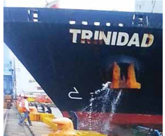
Según un comunicado de la ENP, el percance no afectó en absoluto la operatividad del puerto.