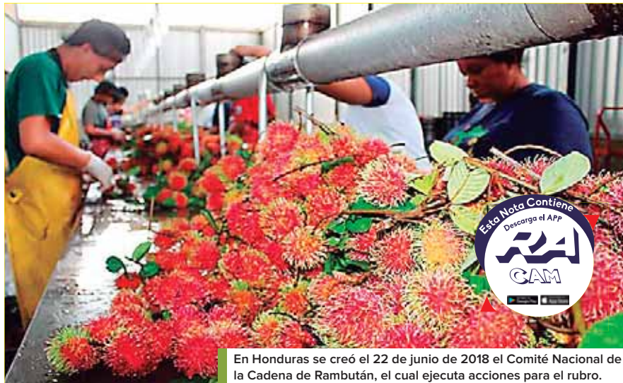
En Honduras se creó el 22 de junio de 2018 el Comité Nacional de la Cadena de Rambután, el cual ejecuta acciones para el rubro.