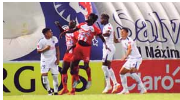
Vida y Olimpia jugarán en el estadio ceibeño. Será un encuentro muy interesante, ambos se reforzaron muy bien.