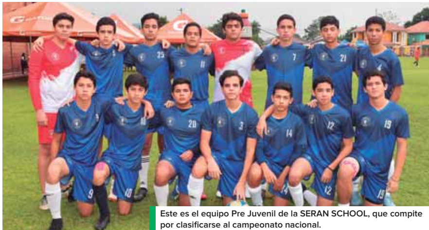
Este es el equipo Pre Juvenil de la SERAN SCHOOL, que compete por clasificarse al campeonato nacional.