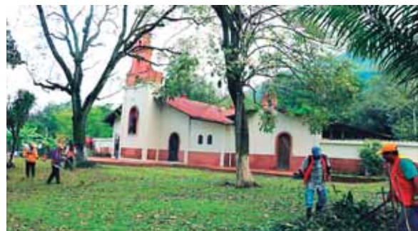
Cuadrillas municipales se han desplegado en tareas de limpieza en los predios del Santuario así como en las calles adyacentes.