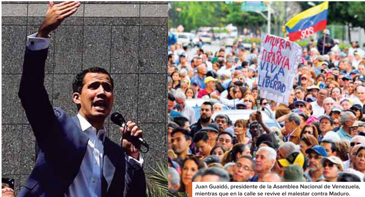
Juan Guaidó, presidente de la Asamblea Nacional de Venezuela, mientras que en la calle se revive el malestar contra Maduro.

Las fuerzas de seguridad brasileñas detuvieron a 309 personas desde el inicio de la ola de ataques que se extendió por el violento estado Ceará (nordeste). Los hechos arrancaron tras el anuncio de que el gobierno local aumentaría los controles en el sistema penitenciario.