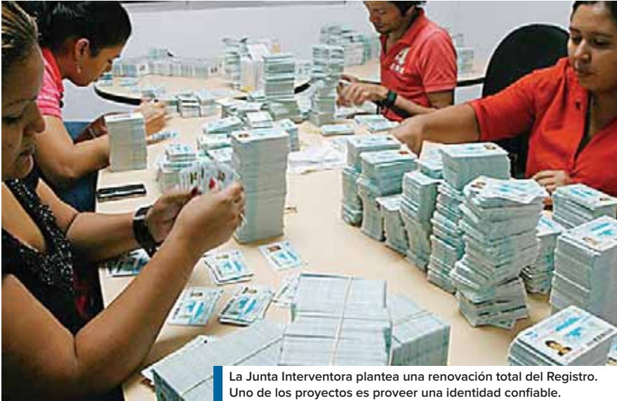
La Junta Interventora plantea una renovación total del Registro. Uno de los proyectos es proveer una identidad confiable.