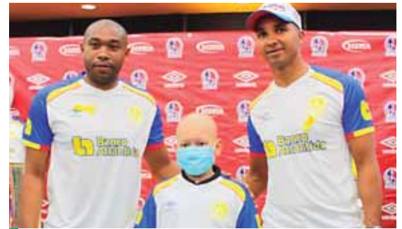
Está disponible en todas las tiendas Diunsa del país.