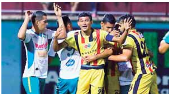
Real España le tiene tomada la medida al Juticalpa en el Juan Ramón Brevé. Los cancheros están obligados a ganar.

El Súper Platense es un candidato al título por lo hecho el torneo anterior.