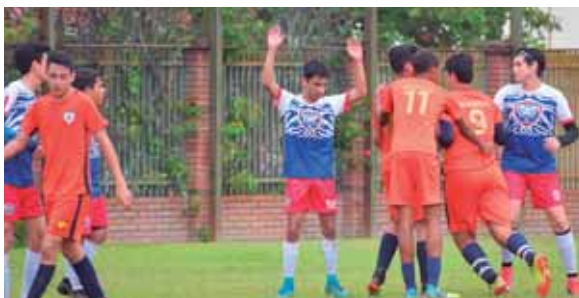
Participantes: SERAN, EIS, Freedom, Ágape, Episcopal Buen Pastor, Destiny, Santa María del Valle, Academia Americana y Valle de