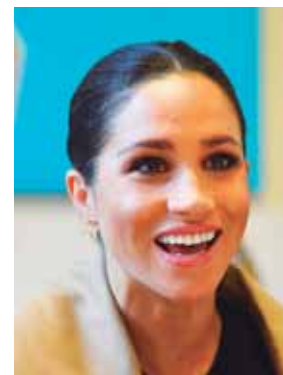
Meghan Markle luce embarazo fashion vuelta al trabajo.