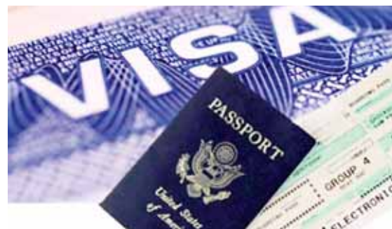
Las visas H1-B son otorgadas a profesionales auspiciados por empresas para un periodo de tres años.