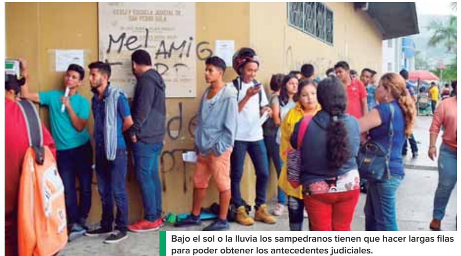
Bajo el sol o la lluvia los sampedranos tienen que hacer largas filas para poder obtener los antecedentes judiciales.

Dubón subrayó que en un 70 por ciento los antecedentes penales la gente los ocupa para trabajo, el resto es para permiso de armas, para carné de visita a los presidios, para estudio, para adopción y para matrimonio. “Los jóvenes de 18 a 24 años