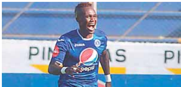
El Saprissa de Costa Rica presentó una oferta por Rubilio, pero el Motagua informó que no era atractiva.