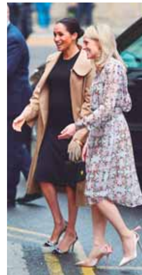
Meghan Markle con las fundadoras de Smart Works.

En cuanto a maquillaje, este fue natural, muy en la línea habitual de Meghan, y en cuanto al peinado, una vez más, la duquesa recogió el cabello con un moño a la altura de la nuca y sin mechones sueltos.