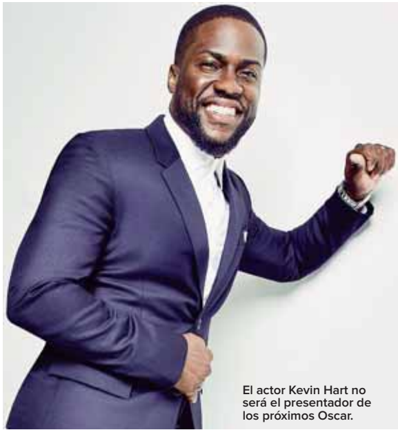
El actor Kevin Hart no será el presentador de los próximos Oscar.

La última vez que los premios más importantes de la industria cinematográfica no contaron con un maestro de ceremonias fue en 1989.