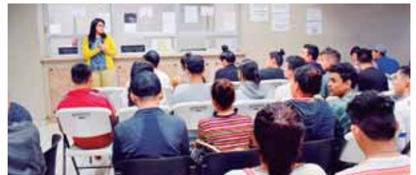
En esta oficina hay cuatro emisores de antecedentes judiciales que atienden de lunes a viernes de 7:30 a.m. a 4:30 p.m.

Para hacer el trámite la población tiene dos opciones: llegar a hacer la fila, después de hacer efectivo el pago en el banco, o solicitar la cita