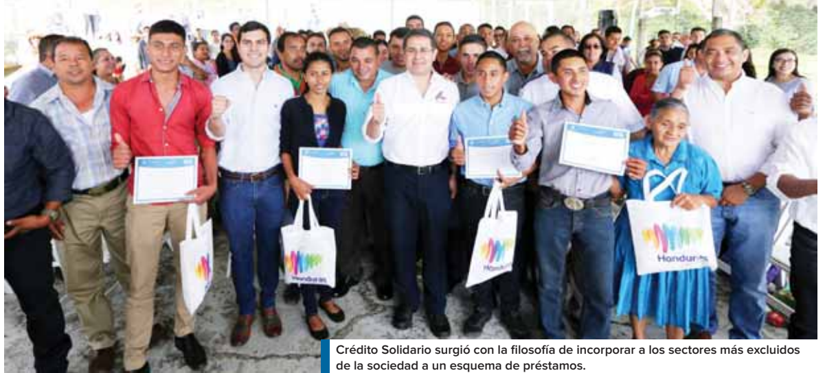
Crédito Solidario surgió con la filosofía de incorporar a los sectores más excluidos de la sociedad a un esquema de préstamos.