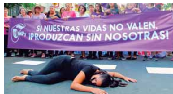
La ley de este país tipifica el feminicidio como un hecho punible de acción penal pública. Este es un drama durante protesta.

“Queremos alentar a la gente talentosa y altamente capacitada a que busquen opciones de una carrera en Estados Unidos”. AFP