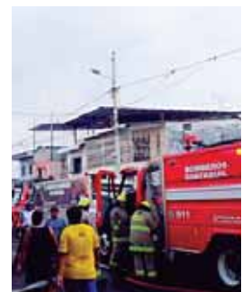
Las personas afectadas fueron llevadas al hospital.

En ese sector del suburbio de Guayaquil, más de 60 bomberos trabajaron para extinguir el fuego que consumió la infraestructura. MEDIOS