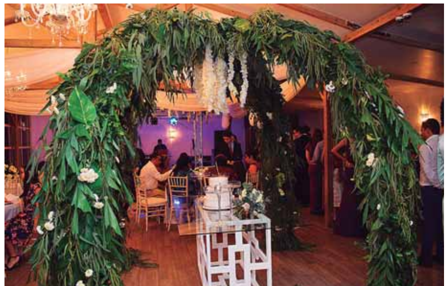
La estancia fue decorada con follaje verde y flores blancas.