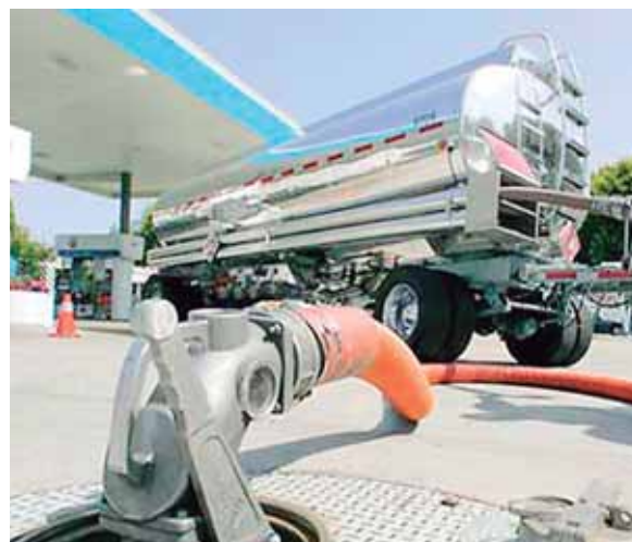
En el mercado internacional el crudo registró un aumento y se cotiza a 52.36 dólares el precio del barril.