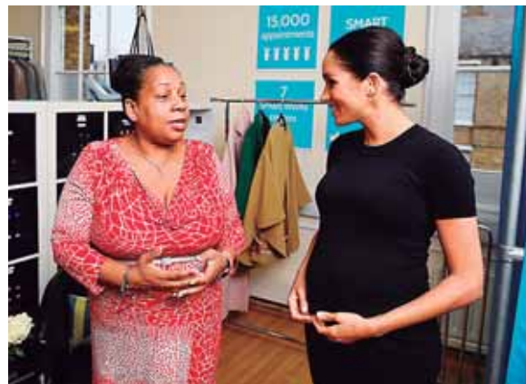
Durante su visita a la asociación Smart Works.