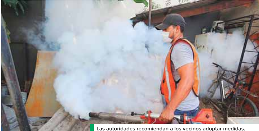
Las autoridades recomiendan a los vecinos adoptar medidas.