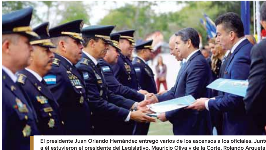
El presidente Juan Orlando Hernández entregó varios de los ascensos a los oficiales. Junto a él estuvieron el presidente del Legislativo, Mauricio Oliva y de la Corte, Rolando Argueta.

Luego de sufrir este incidente las ganas de seguir adelante en las filas de la institución policial no fueron cortadas. El compromiso de servir a la patria y el amor por su familia