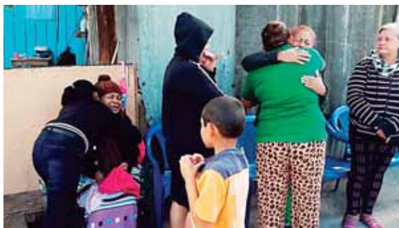
Parientes de los ahora occisos soltaron en llanto al recibir la solidaridad de sus vecinos.

“Solo miren que hasta en la calle estamos velando a mis muchachos, porque ni espacio tenemos para meter los cajones; somos una familia pobre que pasamos, porque Dios es grande y nos