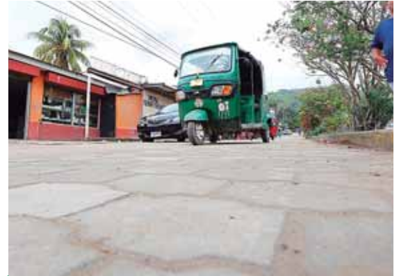
El proyecto beneficia a unos 5,000 pobladores de varias colonias de Cofradía.

Dijo que en la última semana de enero fumigarán los centros educativos, antes que comiencen las clases para evitar que los niños se enfermen.