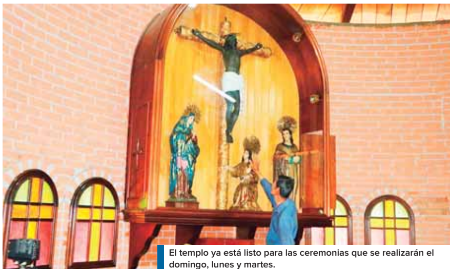
El templo ya está listo para las ceremonias que se realizarán el domingo, lunes y martes.

La ordenanza está dirigida a los comerciantes y ciudadanía en general, únicamente en Arena Blanca. “Esta medida es fundamental para lograr con éxito el desarrollo de las actividades previstas para esta celebración religiosa”, afirmó. Funcionarios del Departamento Municipal de Turismo informaron que la noche del martes, después de la última misa, habrá una fiesta amenizada por un conjunto musical, con el patrocinio del alcalde Alexander López como un regalo en el cierre de su Feria Patronal.