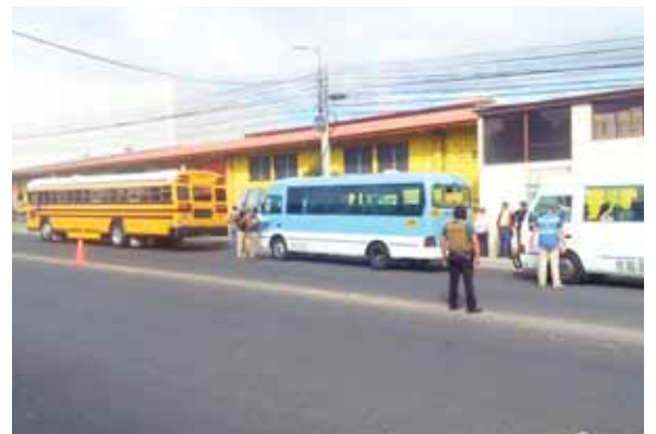
Los operativos se realizan a diario en Tegucigalpa, La Ceiba, San Pedro Sula y Choluteca.

“La muy grave llega hasta un valor de 22 mil lempiras con seis meses de decomiso de la unidad”, subrayó.