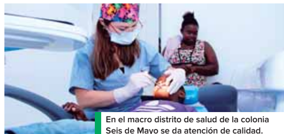
En el macro distrito de salud de la colonia Seis de Mayo se da atención de calidad.