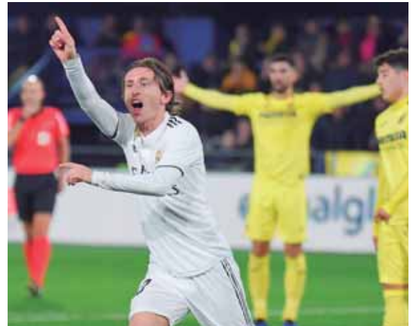
Real Madrid se ubica en la quinta posición con 30 puntos, el líder Barcelona tiene 40 unidades.