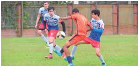
El nivel de este torneo crece año con año, lo que permite que las escuelas representen bien a nuestro país en los internacionales.

Este es un evento que anualmente realiza la Asociación de Escuela Bilingües de Honduras en su afán de unir lazos de amistad entre las academias que la integran y de desarrollar el talento deportivo de sus niños y jóvenes.