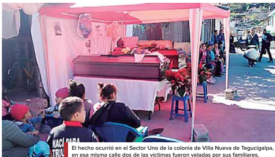
El hecho ocurrió en el Sector Uno de la colonia de Villa Nueva de Tegucigalpa, en esa misma calle dos de las víctimas fueron veladas por sus familiares.

dos los muchachos que se tiraron al suelo, para luego golpearlos y dispararles en reiteradas ocasiones con armas largas y cortas.