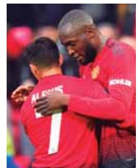
El Manchester United juega el domingo a las 10:30 a.m.