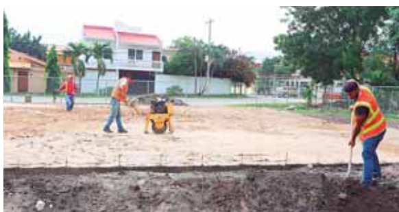
La obra que se está ejecutando en la colonia Covimal avanza en un 55 por ciento.