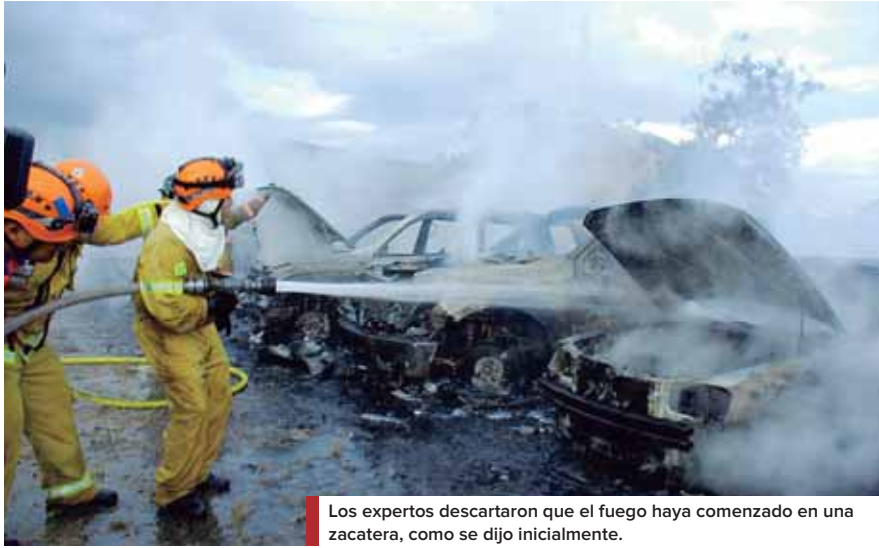
Los expertos descartaron que el fuego haya comenzado en una zacatera, como se dijo inicialmente.