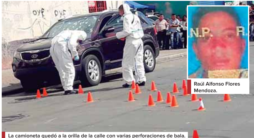
La camioneta quedó a la orilla de la calle con varias perforaciones de bala.