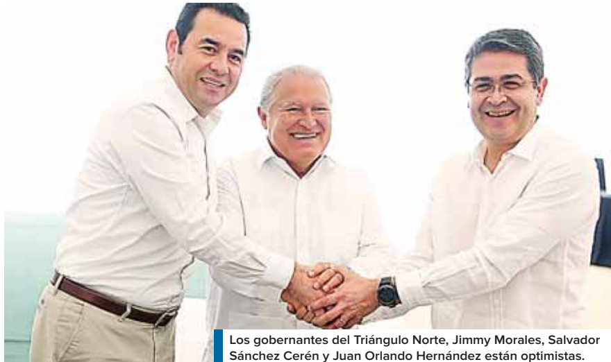
Los gobernantes del Triángulo Norte, Jimmy Morales, Salvador Sánchez Cerén y Juan Orlando Hernández están optimistas.

Recordó que, hace muchos años, habían querido unir a los