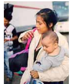
La caravana llegó a sumar unas 7,000 personas.

Por su parte, Olga Sánchez, secretaria de Gobernación (Interior), declaró que "se pretenden dar visas humanitarias, visas temporales, visas de trabajo, visas de otras opciones que nos dé la ley para poder regularizar la situación jurídica de los migrantes".