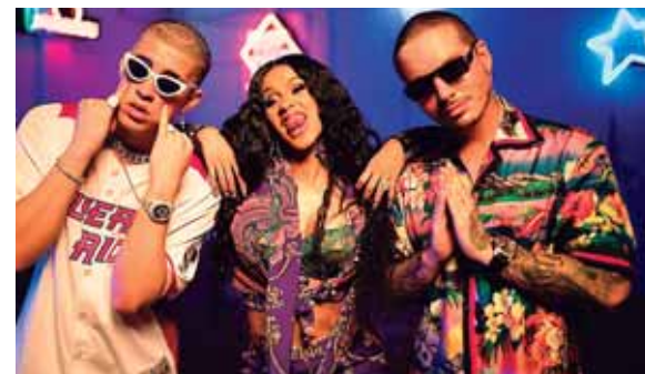
Los artistas latinos Bad Bunny, Cardi B y J Balvin fueron nominados al Grammy, en la categoría grabación del año por su tema I Like It.

En ediciones precedentes varias mujeres se alzaron con los principales premios, especialmente Adele y Taylor Swift, dos veces ganadoras del Grammy al mejor álbum del año. Más sorprendente que los grandes nombres de la música, la cantante estadounidense H.E.R., aparece también en las primeras posiciones en esta 61 edición, con cinco nominaciones para un estilo particular que combina R&B con soul.