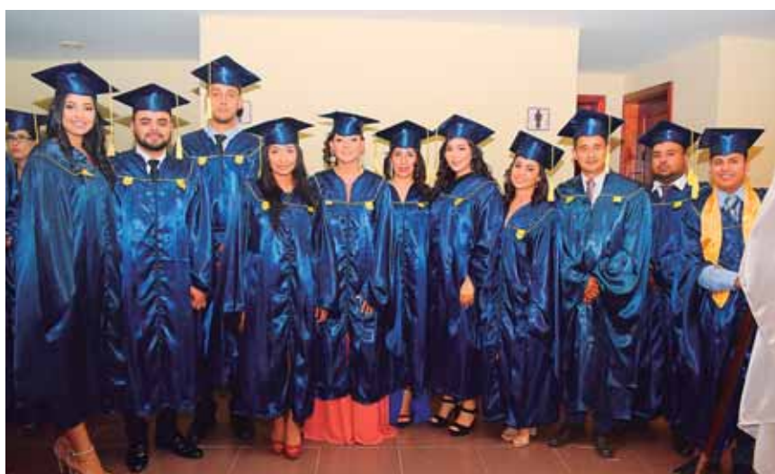
La generación de graduandos de la Universidad de San Pedro Sula.