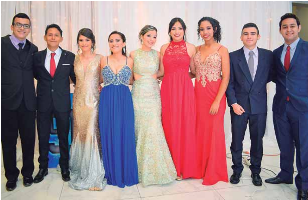
Con mucho sentimiento los egresados de La Salle San José, disfrutaron su gran noche.