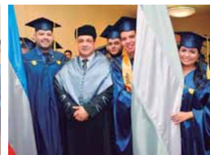
Egresados de Informática Administrativa y Tecnologías Computacionales junto a su director.