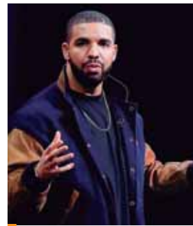
Drake con su disco "Scorpion" competirá por el gramófono dorado al álbum del año.

Su renuncia llega apenas dos días después de conocerse que conduciría la ceremonia del 24 de febrero en Los Ángeles. Tras ese anuncio, varios usuarios de Twitter llamaron la atención sobre unos tuits escritos por Hart entre 2009 y 2011 y que, según "The Hollywood Reporter", fueron borrados después.