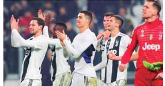
Cristiano Ronaldo y compañía se han vuelto imparables.