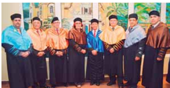
Las autoridades académicas junto al invitado especial, Benito Liao, Cónsul de China Taiwán.