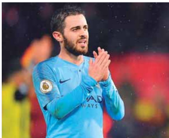
Manchester City tiene 41 puntos en la punta de la Premier League, mientras que el Chelsea llega con 31.

LONDRES. El líder Manchester City se enfrentará el sábado al Chelsea, cuarto pero a diez puntos de su rival, en el partido estelar de la 16ª fecha de la Premier League.