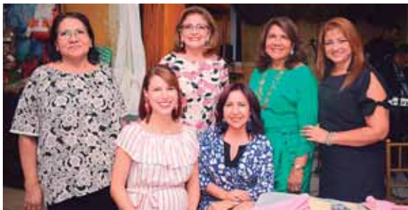
Todas las apreciadas damas disfrutaron una velada muy amena.