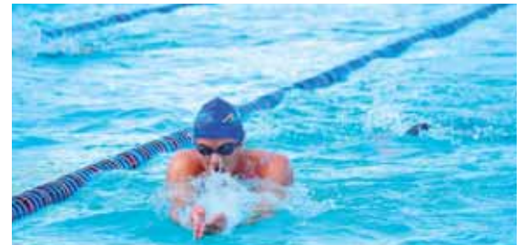
La competencia se lleva a cabo en el Complejo Olímpico.