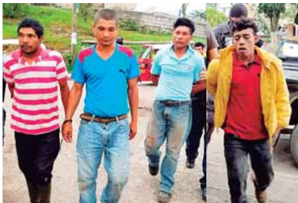
Los cuatro hombres fueron detenidos como sospechosos del crimen de Lucio Aguilar Oliva.