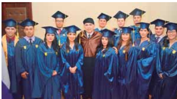
Los egresados de la carrera de Ingeniería Industrial junto a su director.