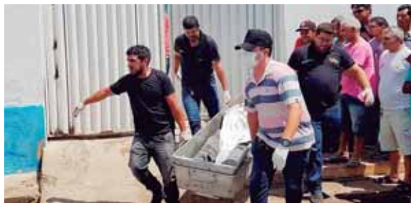
Expertos forenses cargaron los cadáveres después de un intento de robo a bancos.

Al inicio de la mañana, el alcalde de Milagres, una ciudad de 28,000 habitantes situada en el ári-