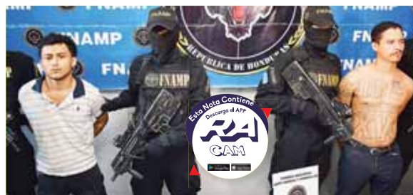
“El Escorpión” y “Little Spooky” fueron puestos a la orden de la Fiscalía por varios delitos, entre ellos extorsión y sicariato.

A éste se le decomisó una subametralladora, sin serie y una pis-