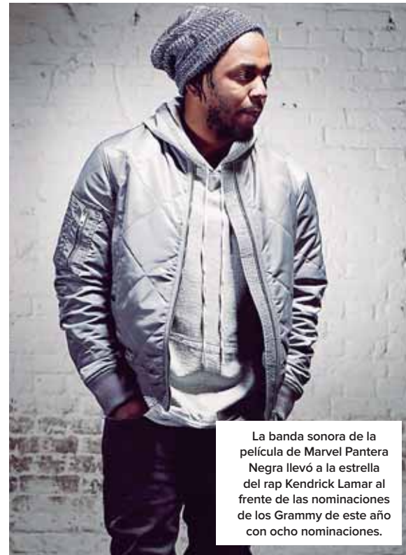
La banda sonora de la película de Marvel Pantera Negra llevó a la estrella del rap Kendrick Lamar al frente de las nominaciones de los Grammy de este año con ocho nominaciones.

El rapero competirá por ocho estatuillas gracias a la banda sonora de 'Pantera negra'. Lo sigue otro rapero, el canadiense Drake, con siete nominaciones. También hay una fuerte presencia encabezada por la cantante Cardi B.