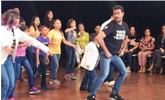
Con grandes expectativas y alegría los organizadores anunciaron el inicio de la Teletón 2018.