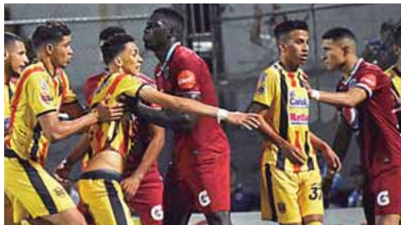
La misión del entrenador cafetero es levantar la Copa de campeón con Real España.

En su última experiencia en Honduras no le fue muy bien, fue