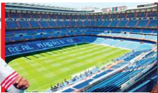
El estadio Bernabéu, escenario del choque en Madrid.

lacrimógenos contra el autobús de Boca Juniors alteró todos los planes. Ayer, tanto D'Onofrio como Barros aprovecharon para reclamar acciones para terminar con el problema de fondo. Entre toda la controversia, parece difícil centrarse en el partido, seguramente el más importante de la historia de ambos clubes: una final continental entre los dos mayores rivales, nacidos en el mismo barrio.