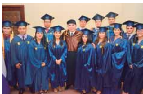
Los egresados de la carrera de Ingeniería Industrial junto a su director.