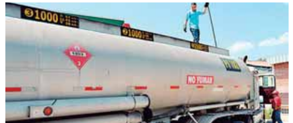
Honduras importó combustibles por 1,155 millones de dólares hasta septiembre.

de la OPEP se reunieron a puerta cerrada durante unas seis horas con el objetivo de consensuar una medida para estabilizar los precios, que se encuentran a la baja desde hace unos dos meses. Al final, un portavoz de la organización anunció que las negociaciones continuarán hoy. Según las declaraciones de los delegados antes de iniciarse la conferen-