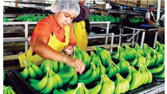
La demanda del banano hondureño ha crecido desde países de Europa Oriental como Rusia, Ucrania y Croacia.

El BCH confirmó un impacto negativo en el ingreso de divisas al cierre tercer trimestre, cuando las exportaciones de productos agroindustriales sumaron 1,931.4 millones de dólares (55.2% del total exportado), inferiores en 222 millones respecto a lo reportado en igual lapso de 2017.