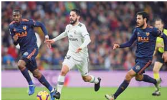
Real Madrid tiene 23 puntos en la quinta posición de la liga española, mañana tiene grandes opciones de ganar en Huesca.

to a disposición de los organizadores de la Copa Libertadores para disputar el domingo el partido de vuelta de la final del torneo más prestigioso del fútbol sudamericano, reubicado tras violentos incidentes. Rivales de Buenos Aires, River Plate y Boca Juniors se medirán en el recinto madrileño, a 10,000 km del estadio Monumental que debía acoger la vuelta, tras el empate 2-2 del partido de ida. AFP