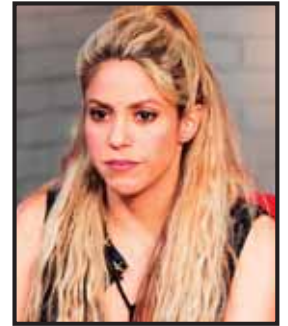
la fiscalía se opuso a cerrar el caso.

La cantante colombiana Shakira enfrentará a la justicia por supuesta evasión de impuestos en España. La Agencia Tributaria de ese país ha señalado que la colombiana defraudó a las autoridades de Hacienda, entre 2012 y 2014, con más de $16.5 millones. La defensa de la cantante colombiana ya está enterada de que