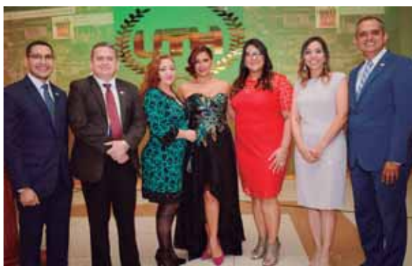
Parte de las autoridades académicas que compartieron con los egresados.