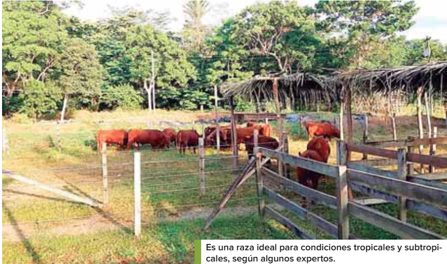
Es una raza ideal para condiciones tropicales y subtropicales, según algunos expertos.