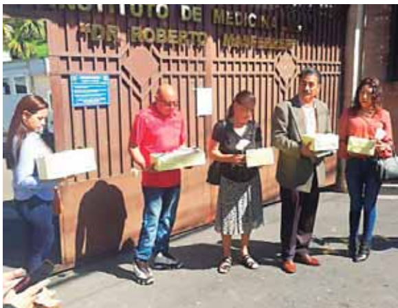
La matanza fue perpetrada entre el 10 y el 13 de diciembre de 1981.

El abogado explicó a la prensa que los restos fueron exhumados en 2015 y su entrega a los familiares es parte de las medidas de reparación ordenadas por la Corte Interamericana de Dere-