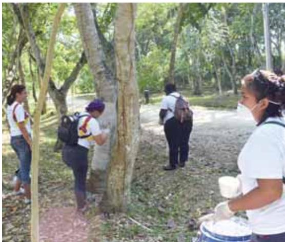
Los voluntarios pintaron varias zonas de la Laguna de Ticamaya, para darle un toque renovado.

“Estamos materializando el sueño de la empresa de unir a la gente por un mundo mejor es un sueño a través del cual estamos haciendo actividades en la laguna de reforestación, limpieza y remodelación de juegos infantiles y con nuestra campaña de Coca Cola nos vamos a unir a celebrar la Navidad