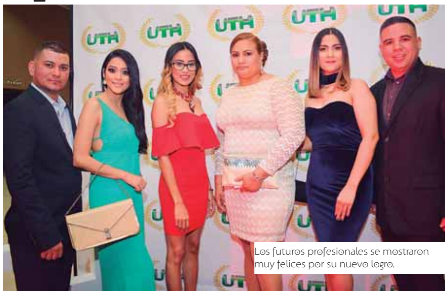
Los futuros profesionales se mostraron muy felices por su nuevo logro.

La velada se extendió algunas horas, llenas de alegría, dicha y muchas historias, que sin duda quedarán en la memoria de quienes las protagonizaron, asimismo disfrutando de la presen-