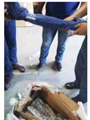
La mercancía se revisó de manera minuciosa.