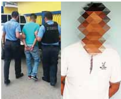
Uno de los detenidos fue en Puerto Cortés, un individuo de 21 años. El otro de 37 años.

La Policía Nacional a través de la Dirección Policial de Investigación (DPI) logró el arresto de dos sospechosos de delito sexual, uno en Puerto Cortés y otro en Marcala, La Paz.