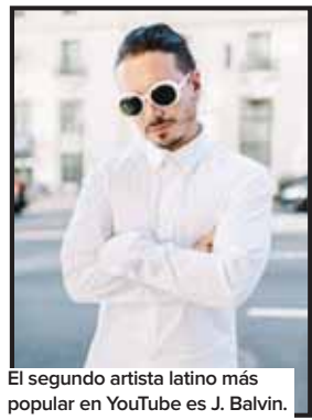
El segundo artista latino más popular en YouTube es J. Balvin.