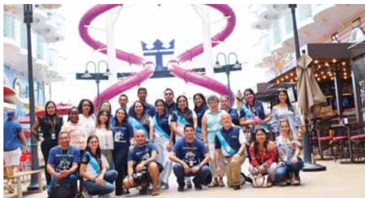
El equipo de medios de comunicación y representantes de Travel Diunsa y Royal Caribbean dentro del crucero.