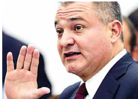
Genaro García Luna, fungió como Secretario de Seguridad Pública durante el mandato del presidente Felipe Calderón.

Un atentado suicida en una reunión religiosa dejó ayer al menos 50 muertos y 72 heridos en Kabul, en uno de los atentados más sangrientos en la capital afgana en las últimas semanas. El ataque se produjo en una sala de fiestas durante la reunión de ulemas, para celebrar el aniversario del profeta Mahoma.