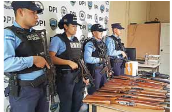
Después de realizar la inspección, los agentes policiales presentaron el armamento decomisado.

tinuarán con estos operativos a fin de prevenir que productos de pólvora, especialmente de alto poder, causen tragedias en época navideña.