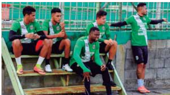
Los verdes conocerán a su rival el 3 de diciembre. Puede enfrentarse al Tigres o Monterrey de México.

El ex jugador dijo que confían en la jerarquía de los jugadores de Olimpia, que saben de la presión y de la exigencia de estar en el club más popular del país.