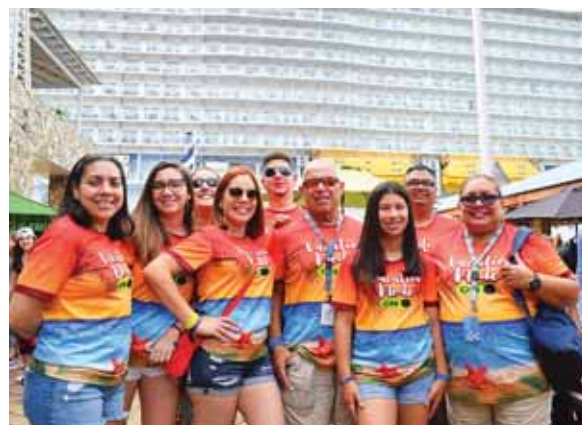
Desde la bella isla de Puerto Rico, una familia completa recorrió Roatán y disfrutaron un caluroso día.

Hot Pepper and Lentil Chili y para endulzar el paladar se encuentra el New York Cheesecake.