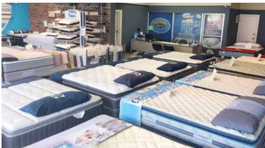
Marcas de prestigio para su confort.

Durante “DormiBlack” te atenderán de 9:00 a.m. a 6:00 p.m., el viernes 23 y sábado 24 de noviembre con horario extendido de 9:00 a.m. a 9:00 p.m. y domingo 25 de 10:00 a.m. a 6:00 p.m.