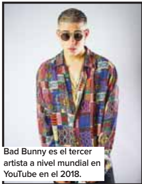
Bad Bunny es el tercer artista a nivel mundial en YouTube en el 2018.

El camino lo abrió "Despacito", que se apoderó del mundo en el 2017, y este año los artistas latinos han llegado más lejos convirtiéndose en los reyes de YouTube.