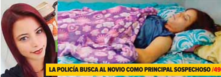
LA POLICÍA BUSCA AL NOVIO COMO PRINCIPAL SOSPECHOSO /49

ESTRANGULAN A COORDINADORA DE "VIDA MEJOR" EN OCOTEPEQUE