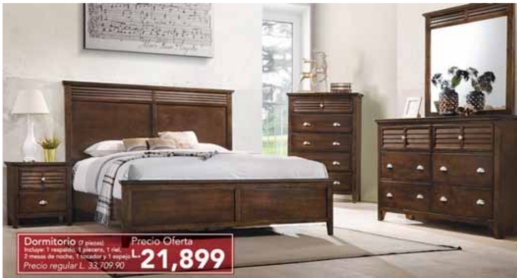
Dormitorio (7 piezas) Incluye: 1 resacaño, 1 placero, 1 rial, 2 mesas de noche, 1 tocador y 1 espejo. Precio regular L. 33,709.90 Precio Oferta L. 21,899