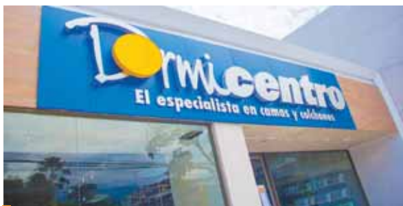
Dormicentro Avenida Circunvalación de San Pedro Sula.