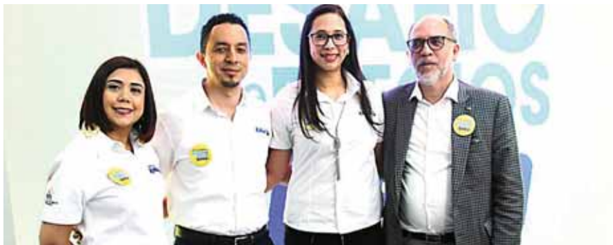
Farmacias Kielsa presentó en Tegucigalpa la campaña “DESAFÍO DE PRECIOS KIELSA”.

El pasado 9 de noviembre se llevó a cabo en Tegucigalpa el lanzamiento de la nueva campaña “DESAFÍO DE PRECIOS KIELSA”, en donde están garantizando que en Farmacias Kielsa cuentan con los precios más bajos del mercado y si el cliente indica que en otra cadena de farmacias lo encuentra más bajo no solo se lo igualan, sino que le REBAJAN EL DOBLE LA DIFERENCIA.