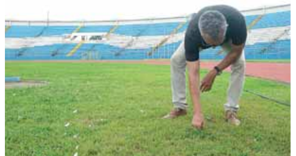
Tanto a la cancha del Olímpico como al Morazán, se le da la debida nutrición a la grama, aplicando elementos mayores y menores.