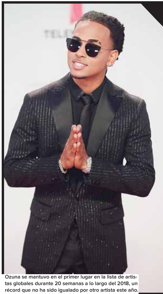
Ozuna se mantuvo en el primer lugar en la lista de artistas globales durante 20 semanas a lo largo del 2018, un récord que no ha sido igualado por otro artista este año.

Bad Bunny es el artista número 3 a nivel mundial en YouTube en el 2018. Sus dos videos con más de mil millones de visitas se