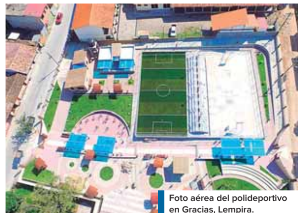
Foto aérea del polideportivo en Gracias, Lempira.

Con el proyecto se crearon 41 puestos de trabajo de manera directa. La obra fue ejecutada por el Instituto de Desarrollo Comunitario, Agua y Saneamiento (Idecoas), a través del Programa de Convivencia y Espacios Seguros para Jóvenes en Honduras (Convivir). Para poner en marcha estos proyectos, de manera previa las comunidades conforman un Comité Ejecutor del Proyecto (CEP), por medio del cual son capacitadas y asesoradas por ejecutivos de Idecoas. Lo que se busca con el CEP es que las comunidades asuman la responsabilidad de realizar las actividades administrativas, organizativas, logísticas y técnicas durante la ejecución de las obras. Más de 1,300 habitantes son los beneficiados directos con la habilitación del Polideportivo de Gracias, donde los visitantes podrán hacer uso de una zona acondicionada con máquinas para hacer ejercicios, una estación de enfermería, cancha de fútbol rápido y una cancha de fútbol con grama sintética.