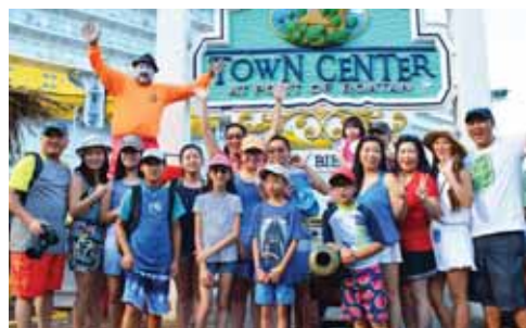
Familias completas salieron a dar un paseo a lo largo de Roatán.