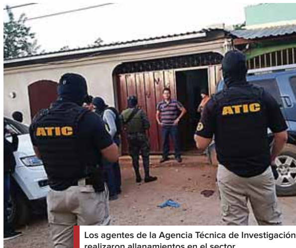
Los agentes de la Agencia Técnica de Investigación realizaron allanamientos en el sector.

TAMBIÉN SE DECOMISÓ ARMA Y MUNICIONES USADAS PARA EL SICARIATO