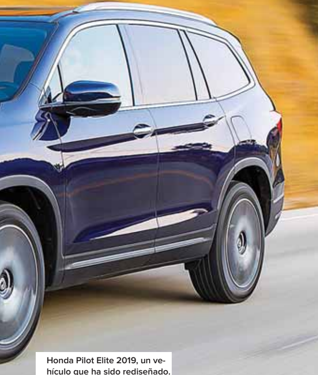
Honda Pilot Elite 2019, un vehículo que ha sido rediseñado.

Dicho vehículo ha sido rediseñado con tecnología indispensable para las familias de hoy a través de nuevas actualizaciones que incluyen: