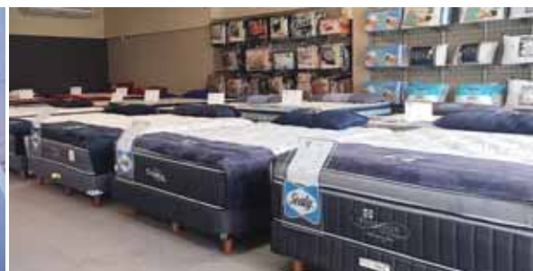
Con el “DormiBlack” aproveche el descuento de 35%.