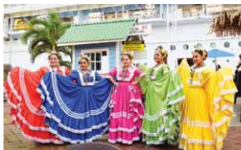
Los bailarines de danza folclórica de la escuela Oro Lenca, desde la capital del país, deleitaron con su presentación a los turistas.