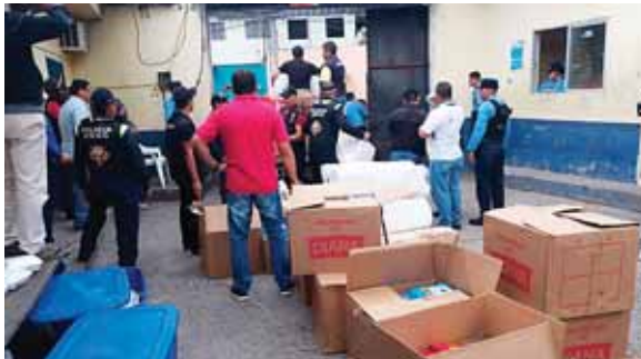
Entre el producto decomisado había 18 sacos de cohetes "Caballo Rojo" y ocho paquetes de varas de cohetes, entre otros.