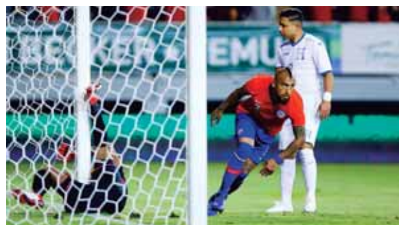
Arturo Vidal corre para festejar su primer gol de la noche, al minuto siete del partido.