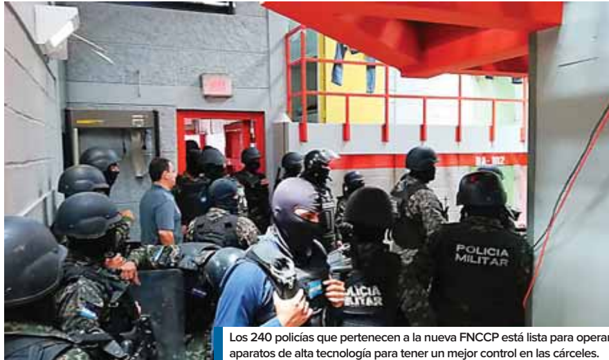
Los 240 policías que pertenecen a la nueva FNCCP está lista para operar aparatos de alta tecnología para tener un mejor control en las cárceles.

La FNCCP será la encargada de toda la parte de la tecnología que se ha instalado; es decir, de los escáneres hasta las cámaras de seguridad que operan en los centros penales, mientras que la seguridad interna de las cárceles esta siempre en poder del Instituto Nacional Penitenciario y los anillos de seguridad externos le competen a la Fuerza de Seguridad Interinstitucional Nacional (Fusina). Suazo refirió que “los 240 hombres con los que inicia esta fuerza serán (ubicados) en los diferentes centros penales, y los mismos ya han sido entrenados en el