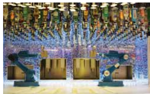
El Bionic Bar, con sus camareros robóticos sirven cócteles exclusivos mientras bailan al ritmo de la música, es uno de los novedosos atractivos del Symphony.