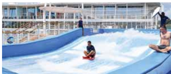
El Anthem Of The Seas es un himno al aventurero que todos llevamos dentro.