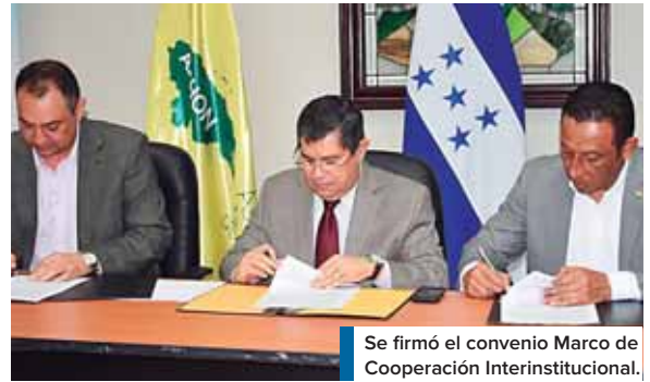
Se firmó el convenio Marco de Cooperación Interinstitucional.