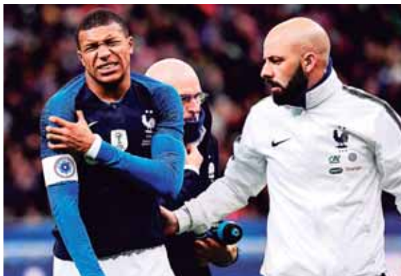
El PSG puede perder a Mbappé y Neymar a una semana de recibir al Liverpool en el Parque de los Príncipes.