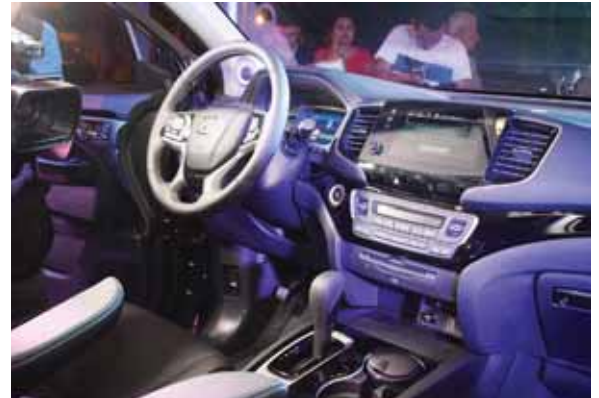
La Honda Pilot Elite 2019 es un vehículo con un interior muy cómodo, amplio y bien equipado.

La Honda Pilot Elite 2019 es un vehículo con un interior muy cómodo, amplio y bien equipado; cuenta con un motor 3.5 gasolina y 280 caballos de fuerza posicionándola como una excelente opción familiar moderna y refinada. "En Honda Excel Automotriz estamos entusiasmados de presentarles la primera camione-