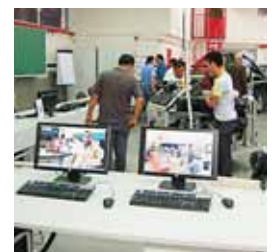
Hernández dijo que revolución tecnológica irá sustituyendo las plazas de trabajo.

El gobernante aclaró que lo anterior “es con el ánimo de edificar, no con el ánimo de generar una controversia estéril; quiero decirles que soy ferviente creyente de que tenemos que capacitar, formar y educar a nuestro recurso humano”.