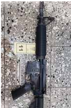
Durante los operativos se decomisó varias armas, municiones, pasamontañas, chalecos anti balas y radios de comunicación.