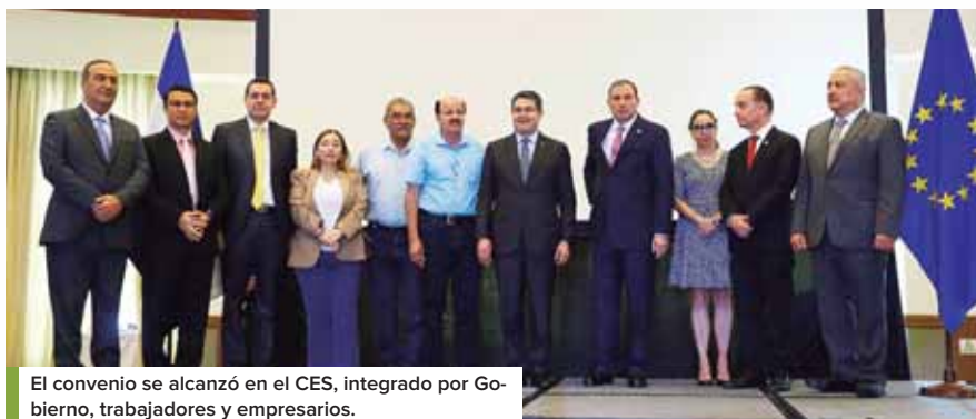
El convenio se alcanzó en el CES, integrado por Gobierno, trabajadores y empresarios.

Para mejorar las condiciones del mercado laboral y de la economía