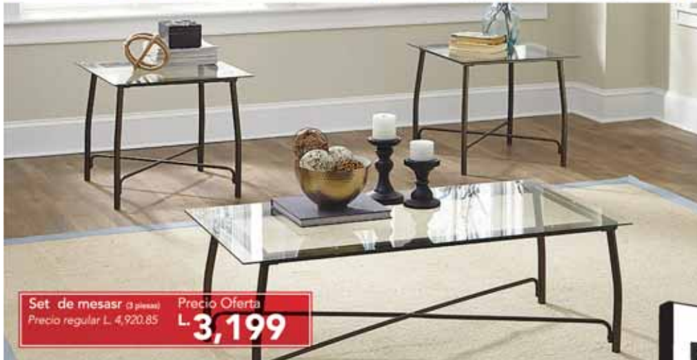
Set de mesar (3 piezas) Precio regular L. 4,920.85 Precio Oferta L. 3,199