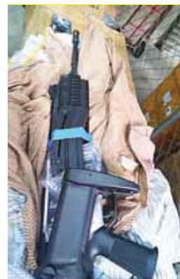
Las armas de fuego venían como encomienda.

dano cuya identidad no fue revelada por la Policía, pero ayer mismo hacían las indagaciones para lograr localizarlo, dijeron los oficiales a cargo.