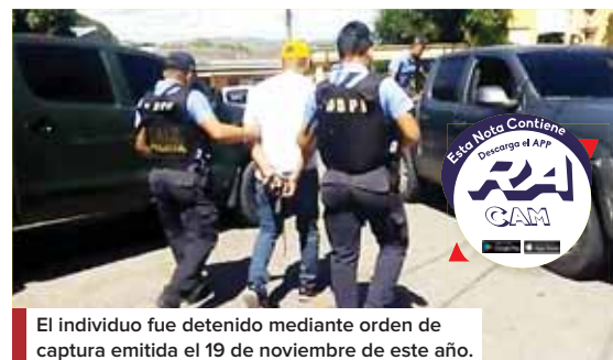
El individuo fue detenido mediante orden de captura emitida el 19 de noviembre de este año.

La boca tenía un color azul oscuro, por lo que las autoridades presumen que la causa de muerte habría sido asfixia por estrangulamiento.