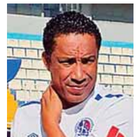
Los jugadores de Olimpia desde ayer están trabajando en Tela.

Los verdes han estado ausentes de torneos internacionales desde el 2009.