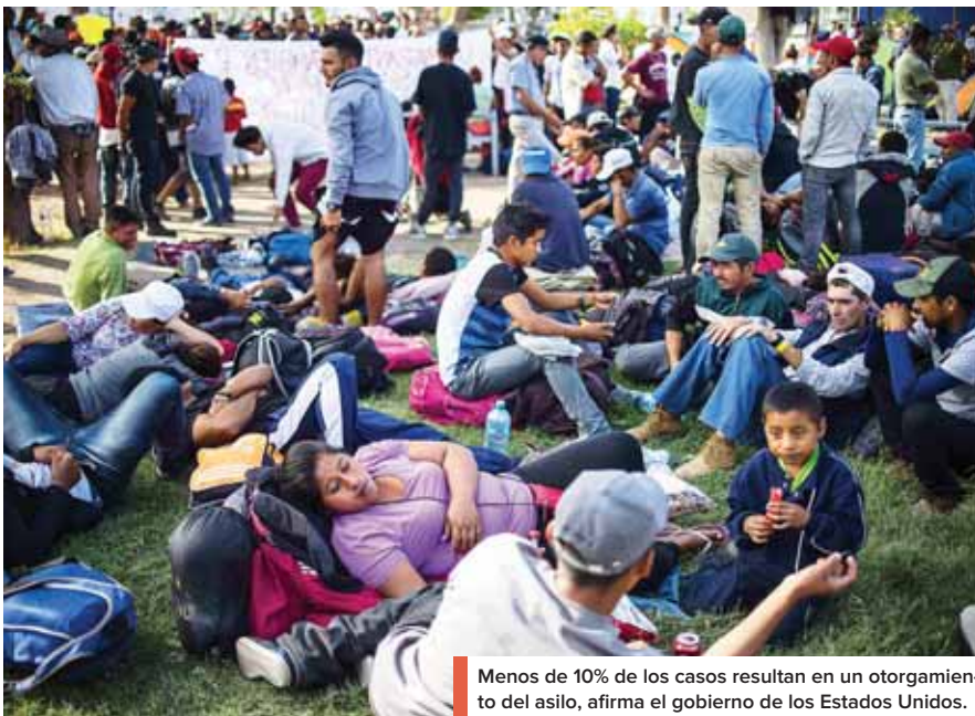
Menos de 10% de los casos resultan en un otorgamiento de asilo, afirma el gobierno de los Estados Unidos.