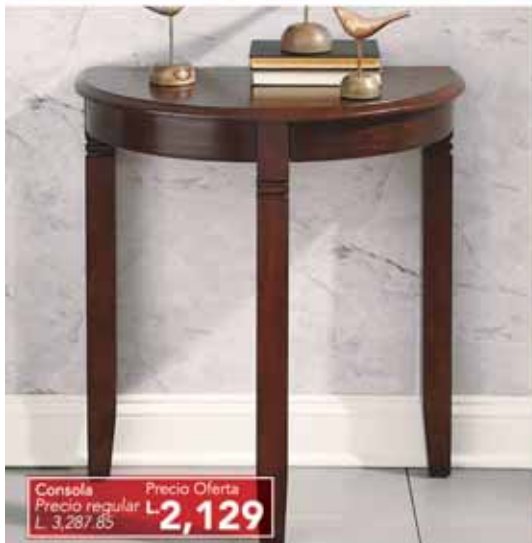
Consola Precio regular L. 3,287.85 Precio Oferta L. 2,129