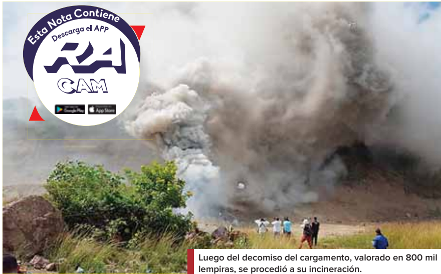
Luego del decomiso del cargamento, valorado en 800 mil lempiras, se procedió a su incineración.