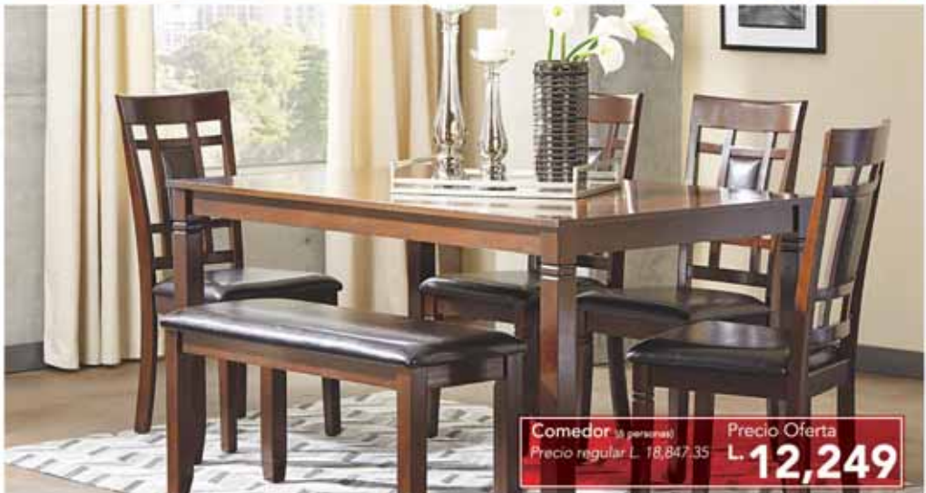
Comedor (6 personas) Precio regular L. 18,847.35 Precio Oferta L. 12,249