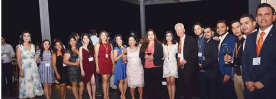
Ejecutivos y personal de la Agencia Naviera Europea posaron para Diario EL PAÍS.