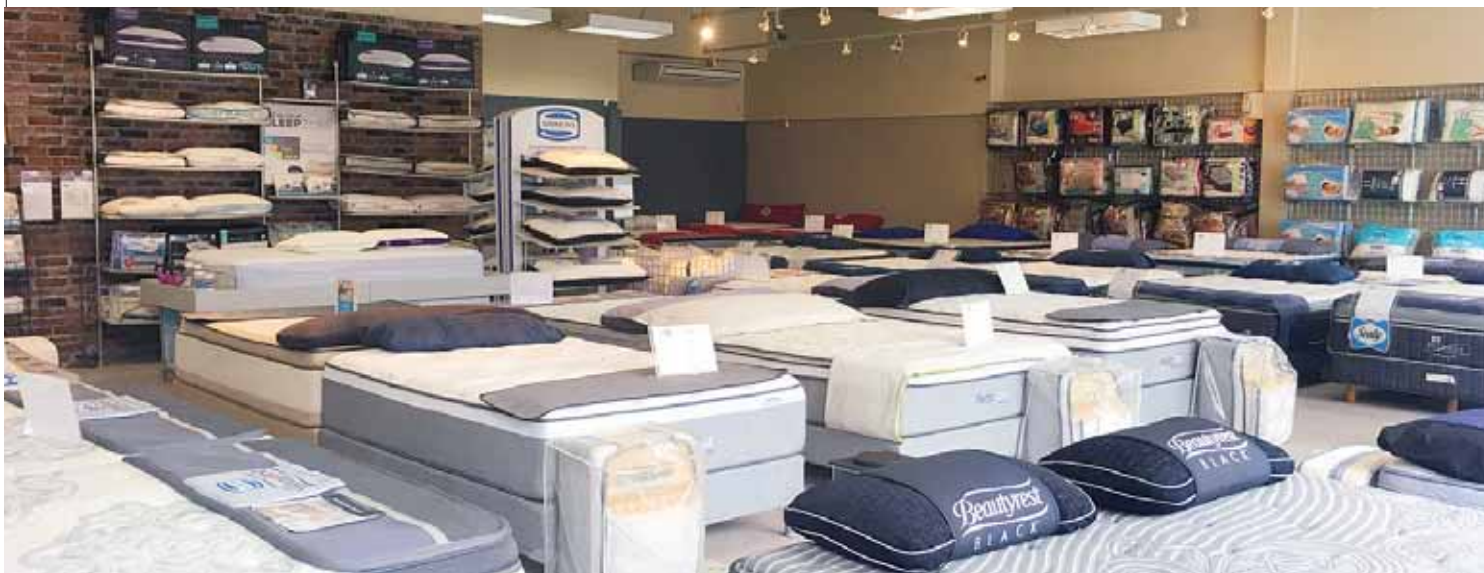
La solución para tener un descanso reparador está en Dormicentro.

Ninguna promoción te hará descansar como “DormiBlack” de Dormicentro, con un 35% de descuento en toda la tienda, la cual está vigente hasta el 25 de noviembre para consentirte y que aproveches esta oportunidad para llevarte solo calidad.