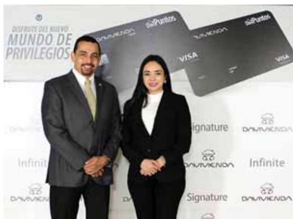
Ejecutivos de Davivienda durante el lanzamiento.

Banco Davivienda ofrece una nueva experiencia en privilegios a sus tarjetahabientes con las tarjetas de crédito Visa Signature e Infinite Davipuntos, siendo ambos productos