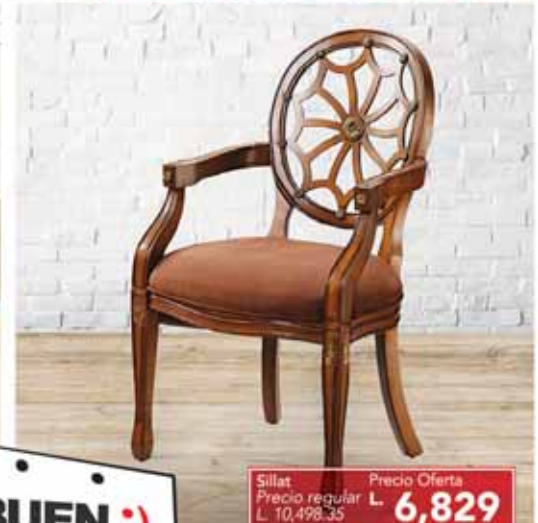
Sillat Precio regular L. 10,498.35 Precio Oferta L. 6,829

Lunes a Sábado | 9:00 am a 6:30 pm www.muebleriaelements.com/ MUEBLERIAELEMENTS