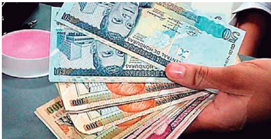
La inflación está en el rango que exige el FMI, según el funcionario.

“Si no hubiéramos puesto en orden el tema fiscal no existiera esa liquidez, que es superior a la de hace unos 3 años”, expresó.