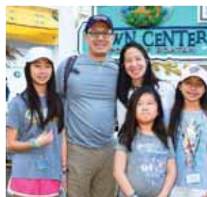
Muchos turistas del continente asiático compartieron con la población caribeña.