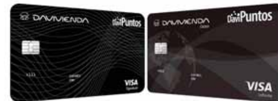
Visa Signature e Infinite Davipuntos son las nuevas tarjetas de crédito de Davivienda.

Adicionalmente, los tarjetahabientes podrán gozar de otros beneficios especiales como Bono de Davipuntos por bienvenida durante el primer mes por todas sus com-