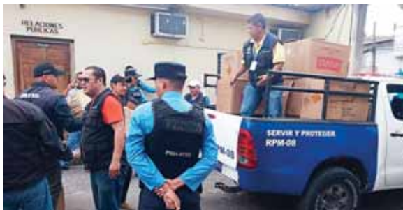
En el operativo participó la Policía Nacional en apoyo a las autoridades municipales.

torio municipal, carretera a Olancho, donde se procedió a su incineración. Oficiales dijeron que la Policía Nacional en coordinación con autoridades municipales con-