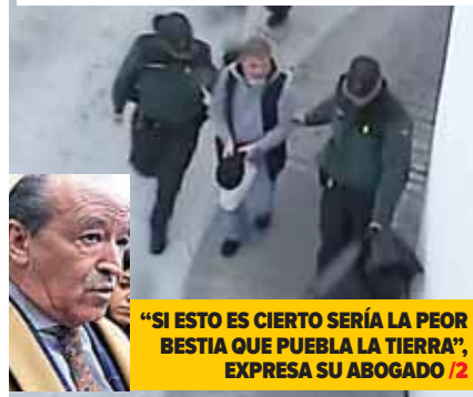
"SI ESTO ES CIERTO SERÍA LA PEOR BESTIA QUE PUEBLA LA TIERRA", EXPRESA SU ABOGADO /2

"EL REY DEL CACHOPO" SE NIEGA A DECLARAR POR EL CRIMEN DE PAREJA HONDUREÑA