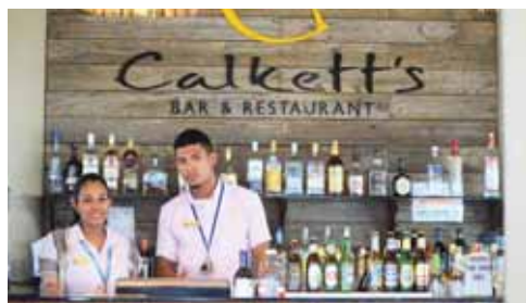
Calkett's es uno de los bares con los que cuenta el prestigioso Mayan Princess Beach and Dive Resort.