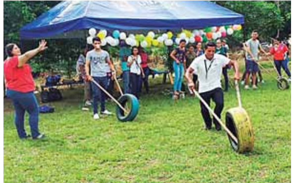
Los juegos tradicionales forman parte de las costumbres y tradiciones de San Marcos, Santa Bárbara.