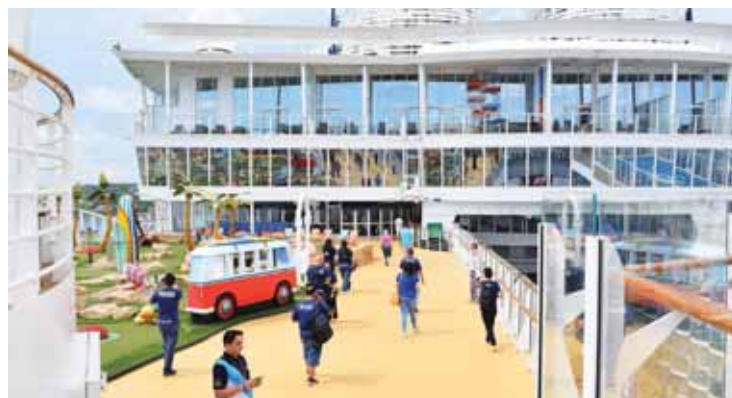
El área de los niños, es uno de los atractivos más visitados por los viajeros.