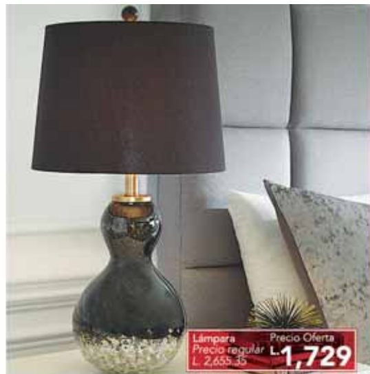
Lámpara Precio regular L. 2,655.35 Precio Oferta L. 1,729