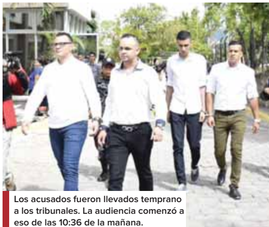
Los acusados fueron llevados temprano a los tribunales. La audiencia comenzó a eso de las 10:36 de la mañana.