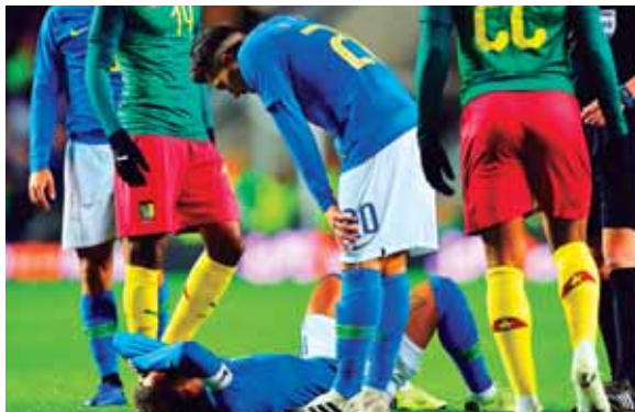
Neymar se quejaba de un dolor en la ingle, se jugaba el minuto siete del partido. Hoy se conocerá más detalles de su lesión.