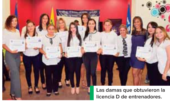
Las damas que obtuvieron la licencia D de entrenadores.