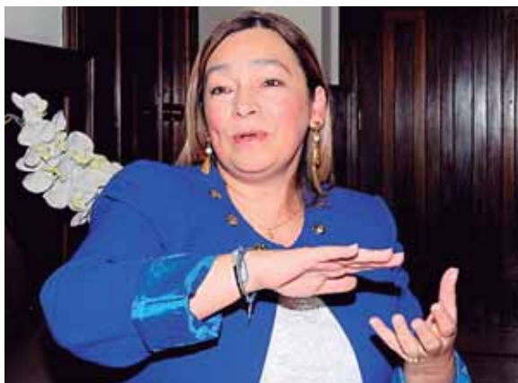
La funcionaria afirmó que hay que demostrar la evolución que ha tenido el FMI en cuanto a las recaudaciones tributarias.

Honduras busca firmar un nuevo acuerdo con el FMI, como el Stand