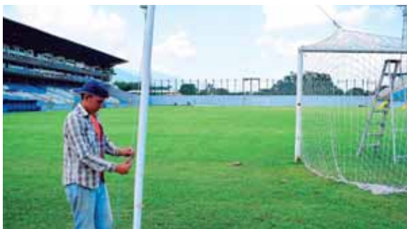
Los empleados de Inmude trabajaban afanosamente la tarde de ayer en los últimos detalles.

De acuerdo a lo informado por los organizadores, para proteger el césped decidieron traer una lona especial del extranjero, de la misma que se utilizan en los mejores estadios de Centroamérica, y además se aplicaron químicos de protección antes y después del evento, para que recobre en poco tiempo su verdor. Afortunadamente, el engramillado no presenta hoyos que puedan representar un riesgo para los jugadores, y sus cuidadores indican que dentro de cuatro días estará de nuevo en todo su esplendor, al tiempo que afirman que es-