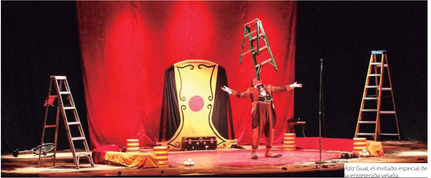
Aziz Gual, el invitado especial de la entretenida velada.