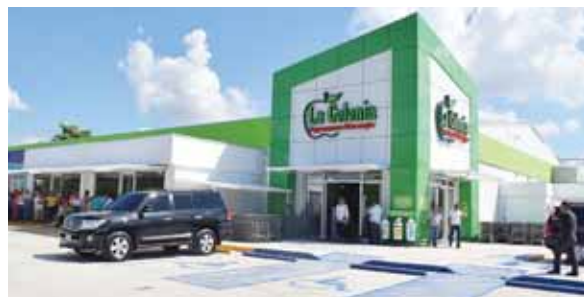
Esta nueva tienda está ubicada en la colonia San Roberto de Sula.

encontrar comercios como: Farmacias Kielsa, Espresso Americano, Pizza Hut, Helados Sarita, Boleadas Express, ATM Banred24, Banco de Occidente, Western Union, Super Queques y Sherwin Williams, entre otros, con el objetivo de satisfacer las necesidades de quienes les visiten.