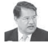
Edgardo Rodríguez Político y periodista

D e cara a la aprobación del presupuesto del país para el próximo año y tomando en consideración la crisis social y económica que abate a Honduras, es preciso reflexionar sobre dos áreas que son fundamentales para la redistribución del ingreso y reducir la pobreza que nos golpea, me refiero a la salud y la educación. En ambos rubros el gasto mensual de la población se ha visto incrementado en los últimos años de forma sustancial, ello debido al mal servicio, que obliga al hondureño a recurrir al sector privado, encareciendo el costo de vida de las familias.