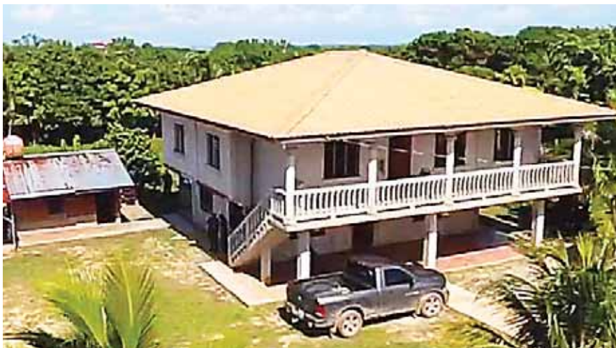
La organización de Los Simpson es originaria del departamento de Gracias a Dios. Según las autoridades tienen muchos bienes inmuebles, carros, lanchas y barcos.