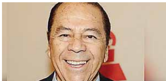
Lucho Gatica tenía 90 años y residía en la Ciudad de México, donde sus ciudadanos le rinden homenaje a su memoria.