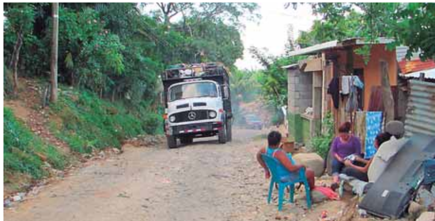
Los recolectores de basura y el equipo pesado otra vez en acción en el crematorio municipal de La Ceiba.

Los afectados estaban en una misma sintonía. Desalojarían hasta que les pagaran a todos y no solamente a un grupo de personas. Así se fue gestando el movimiento diario hasta que cerca de las 4:00 de la tarde de ayer se le canceló a la mayoría, por lo que decidieron permiti-