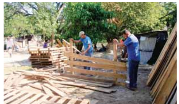
Los ciudadanos del bordo de El Pedregal están reconstruyendo sus casas porque no tienen adónde ir.

“Ante la presencia de Dios aquí estamos esperando que nos rebiquen porque queremos que nos den un predio donde vivir. Yo me dedico a recoger botes y a veces