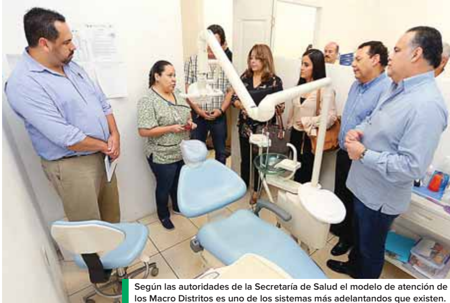
Según las autoridades de la Secretaría de Salud el modelo de atención de los Macro Distritos es uno de los sistemas más adelantados que existen.

“Seguiremos aprendiendo de ellos (Secretaría de Salud), pues cuentan con grandes experiencias y es importante que nos acompañen y nos apoyen en una total colaboración, pues lo que queremos nosotros es asegurarnos que a la población se le acerca la salud, de que los vecinos no tengan que viajar largas distancias, además de desconges-