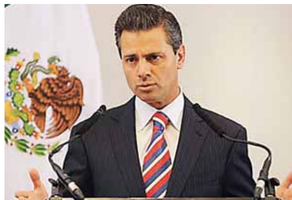
El gobierno de Enrique Peña Nieto “persiguió, capturó y extraditó al criminal Joaquín Guzmán Loera”, dijo un vocero del gobierno.

“Son absolutamente falsas y temerarias las afirmaciones que se dice realizó el abogado de Joaquín ‘el Chapo’ Guzmán. Ni él, ni el cártel de Sinaloa ni ningún otro realizó pagos a mi persona”, escribió Calderón.