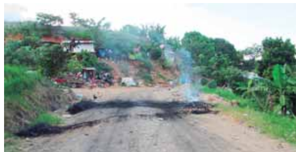
La calma retornó ayer después que se llegó a un arreglo de pago con las autoridades municipales.

A algunos ni siquiera se les ha pagado un mes y se les ha prometido que para mañana ya tendrán algo en sus bolsillos. Otros dicen que aún les deben dos meses y si para finales de la próxima semana no se les cancela, volverán a tomar el crematorio en señal de protesta.