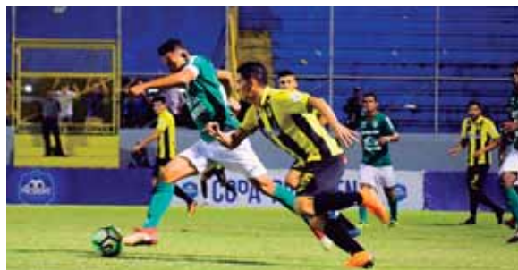
Será un duelo complicado para ambos clubes. En el Apertura 2018-19, empataron los dos partidos 1-1 y 2-2.

En aquel Apertura 2018, empató 2-2 en el primer juego ante el Olimpia, pero perdió 0-2 en la vuelta y hasta allí llegaron en su ilusión de avanzar a un puesto histórico.