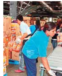
Durante 5 años las Mipymes estarán exentas del ISR, tras una reconsideración.

Cabe destacar que el Gobierno de la República puso a disposición 2,400 millones de lempiras para apoyar a la micro, pequeña y mediana empresa en el país.