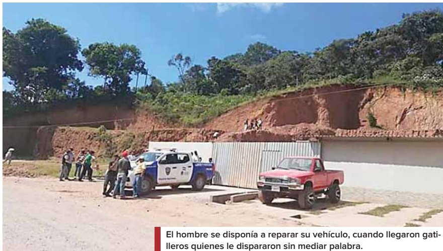
El hombre se disponía a reparar su vehículo, cuando llegaron gatilleros quienes le dispararon sin mediar palabra.