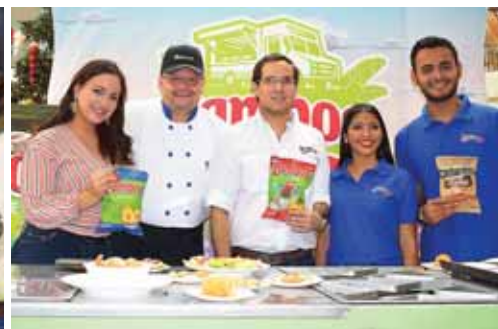
Con gran éxito se realizó el Zambos Truck en Mall Multiplaza de San Pedro Sula.

Yummies realizó en San Pedro Sula el exitoso Zambos Truck, un camión equipado con una cocina única que lleva de una forma diferente, el delicioso sabor a los amantes de la marca, y además pueden descubrir cómo preparar sabrosas recetas con los productos Yum-