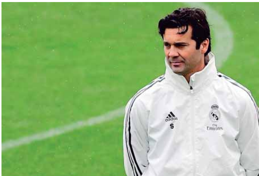
El exentrenador de la filial fue promovido inicialmente para un periodo de interinidad, con el objetivo de sacar al equipo de la crisis. Al final se queda como titular en el Madrid.

Solari, centrocampista merengue entre 2000 y 2005, llegó como reemplazante provisional de Julen Lopetegui, y terminó convenciendo tanto a la dirección como a los