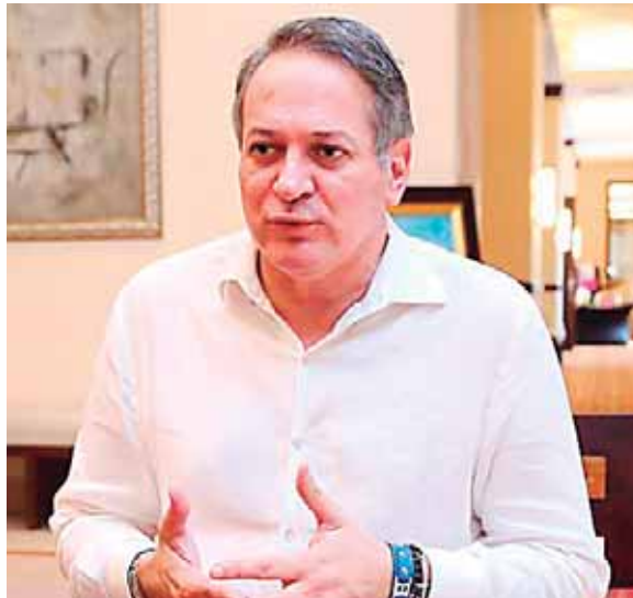
El analista dijo que los emprendedores invierten los recursos en negocios pequeños para que les dé sostenibilidad.

De manera que el endeudamiento de la persona no sería destinado solo al consumo, sino a otras líneas como vivienda, opción que hace poco no tenía, gracias a los proyectos impulsados por el gobierno y la empresa privada.