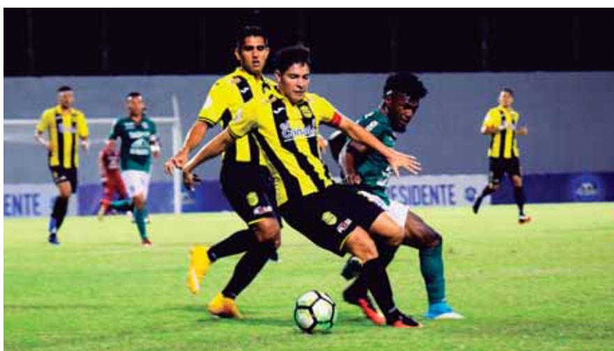
En los dos últimos torneos, ambos se enfrentaron en semifinales. En esas ocasiones cada uno logró acceder a la gran final.

Futbolísticamente hablando, son dos equipos muy parejos, Real España