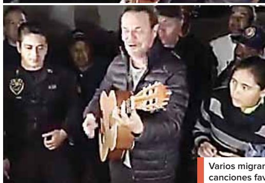
Varios migrantes tuvieron la oportunidad de pedir sus canciones favoritas. También intercambiaron opiniones.