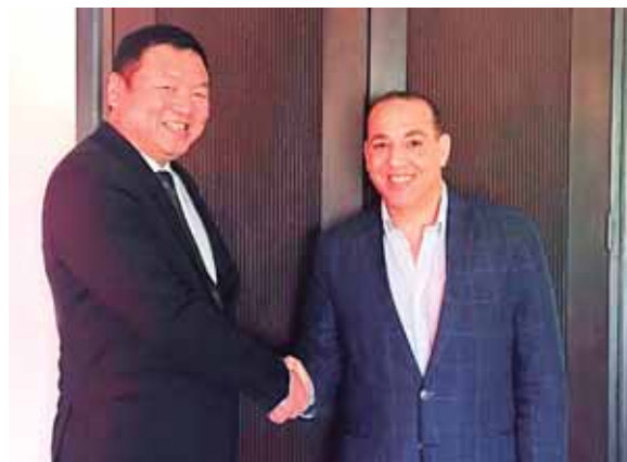
Entre los objetivos del acuerdo figuran el impulso a los sectores productivos del país para importar y exportar bienes.

El Grupo Financiero Ficohsa (GFF) es una entidad regional de capital hondureño con sede en Panamá, comprendida por nueve empresas que cada una en su rubro reciben la misma denominación: Banco Ficohsa Honduras, Banco Ficohsa Guatemala, Banco Ficohsa Nicaragua y Banco Ficohsa Panamá, Ficohsa Seguros, Ficohsa Casa de Bolsa, Ficohsa Tarjetas de Crédito, Ficohsa Pensiones y Ficohsa Casa de