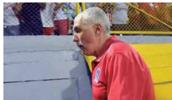
Keosseán cree que los albos llegaron bien a las semifinales.