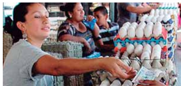
Pese al incremento de los huevos en los últimos días, otros productos como los combustibles no han aumentado.

Castillo destacó que los “blanquillos” han presentado alzas en las últimas semanas, no así los otros.