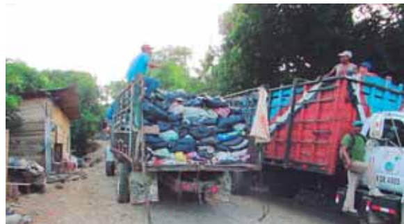
Había una cantidad de basura acumulada de forma exagerada, pero ayer procedieron a despejarla.