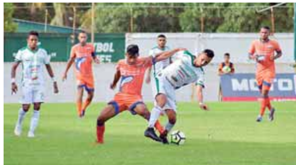
Para la UPNFM es su segunda liguilla semifinal que participa, anteriormente lo hizo ante Olimpia que lo dejó fuera del torneo.