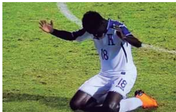
Al final del partido, los jugadores hondureños agradecieron por este punto que aún los tiene con posibilidades de ir a Polonia.