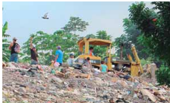
Los colonos que viven en los alrededores ya no tendrán que sufrir por los enfrentamientos entre los recolectores y policías.