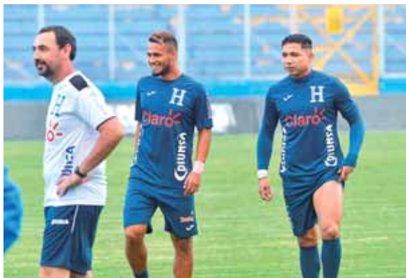
Los jugadores quieren devolver la alegría de los triunfos a la afición.

TEGUCIGALPA. Luego de su primer entrenamiento con los jugadores locales y los legionarios que se incorporaron ayer, el entrenador interino de la Selección Nacional, José Valladares, manifestó que en el partido ante Panamá de este viernes buscarán ser agresivos, ya que juegan en casa.