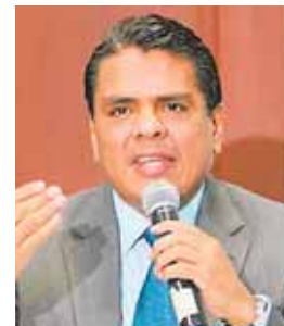
El embajador Alden Rivera dijo estar pendiente de los compatriotas.

También presentan problemas de llagas en los pies por las largas distancias que tienen que recorrer, precariedad en general por la ausencia de una alimentación balanceada y además hay casos de deshidratación, detalló.