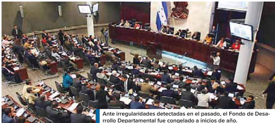
Ante irregularidades detectadas en el pasado, el Fondo de Desarrollo Departamental fue congelado a inicios de año.