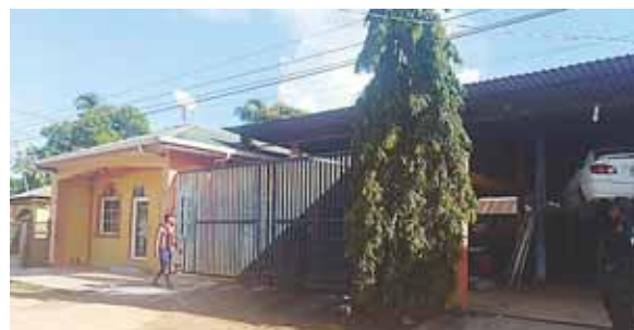
En esta vivienda también operaba un taller mecánico y un establecimiento de bebidas alcohólicas.