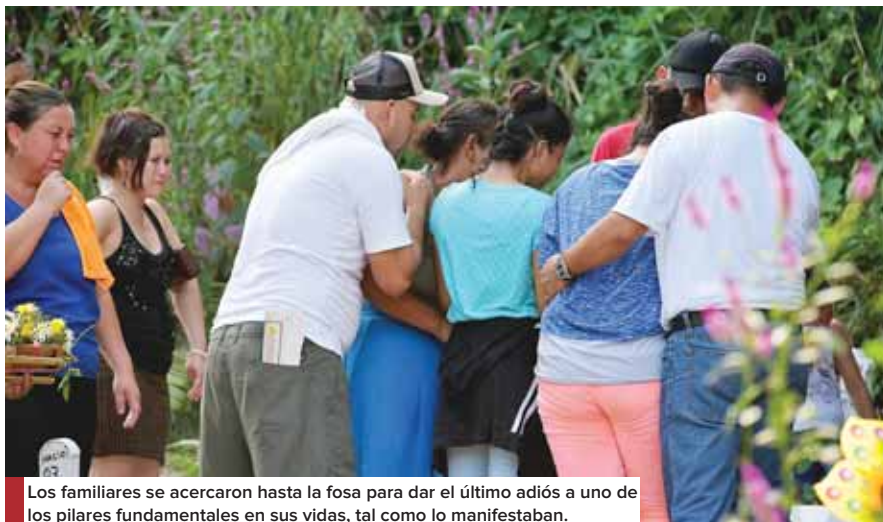
Los familiares se acercaron hasta la fosa para dar el último adiós a uno de los pilares fundamentales en sus vidas, tal como lo manifestaban.

sinato de la atleta, mediante un acuerdo de duelo, en el que también destacó sus cualidades al representar a la mujer en el deporte del fisiculturismo, "promoviendo en su estilo de vida diaria un ejemplo de nuestra disciplina".