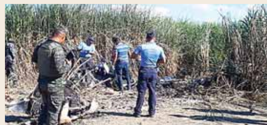
Autoridades cuando hacían el peritaje de la nave.

Los restos de la avioneta serán trasladados a la Base Coronel Armando Escalón, de la Fuerza Aérea Hondureña, en la Lima, para su respectivo proceso de peritaje conforme a la ley.