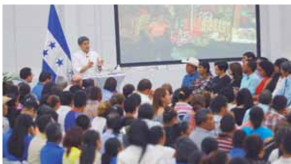
El presidente tuvo un conversatorio con los micro, pequeños y medianos empresarios, sobre la Ley de Apoyo Financiero.

dades de la nueva ley, destacó que propuso esa iniciativa porque “me toca proteger al hondureño luchador que no ha tenido la oportunidad de trabajar”.