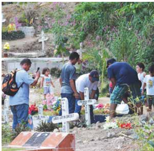
Momento en que familiares y amigos cercanos introducían el ataúd a la fosa en el cementerio Los Laureles, sector La Puerta.

De acuerdo con información preliminar, las causa de muerte sería asfixia por sofocación, ya que el cuerpo fue encontrado con una bolsa plástica en la cabeza.