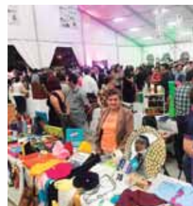
Satisfacción por parte de los expositores en el evento.