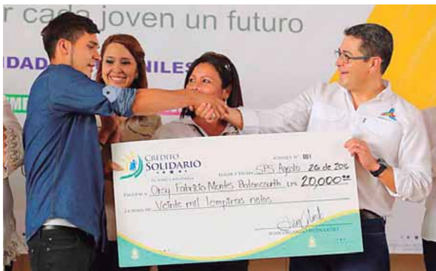
El programa Crédito Solidario ha brindado el apoyo a 89 mil microempresarios a quienes les ha otorgado 144 mil créditos con tasas de interés de 1% mensual.

Asimismo, indicó se realizarán ruedas de negocios para establecer acuerdos comerciales entre