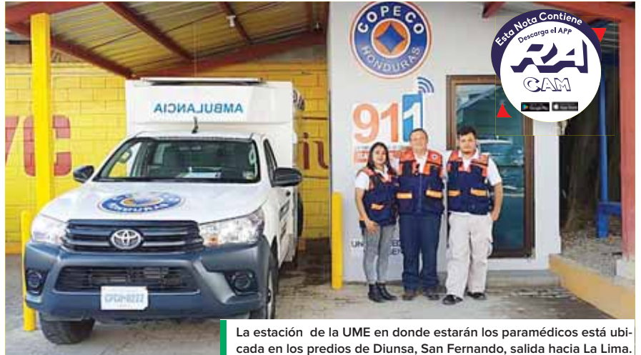
La estación de la UME en donde estarán los paramédicos está ubicada en los predios de Diunsa, San Fernando, salida hacia La Lima.

“En esta primera fase tenemos 20 unidades aquí en el Valle de Sula, que no solo atiende en San Pedro Sula, sino en Potrerillos, Choloma, Villanueva, La Lima y estamos en un proyecto de expansión donde estaremos ubicando unidades en Puerto Cortés y en Naco para acer-