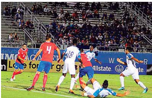
El juego fue brusco en casi todo el primer tiempo y eso le costó a Honduras quedarse con diez hombres, desde el minuto 37.

chó fuera, por muy poco. Ahora los catrachos esperarán a ver lo que pasa entre Costa Rica y Estados Unidos, que se enfrentan este viernes, y cerrarán contra los norteamericanos el lunes, sabiendo ya si les basta empatar o tienen que derrotarlos. Dos de los tres irán al Mundial de Polonia.