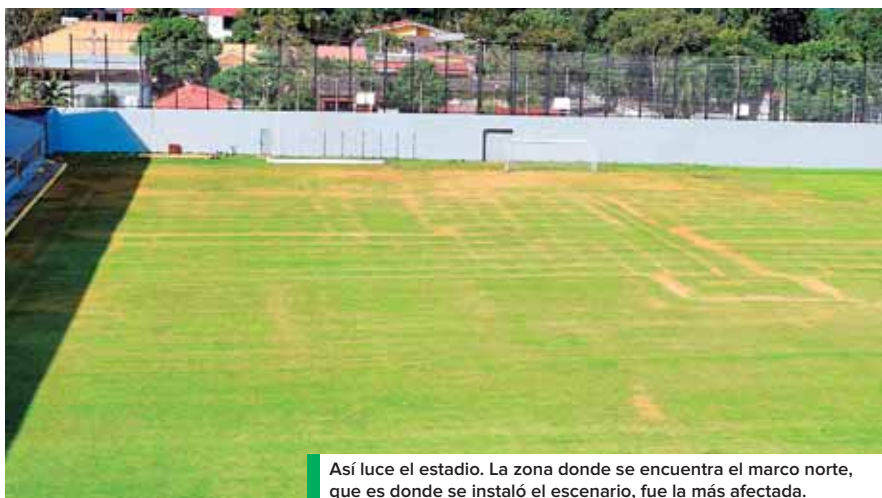
Así luce el estadio. La zona donde se encuentra el marco norte, que es donde se instaló el escenario, fue la más afectada.