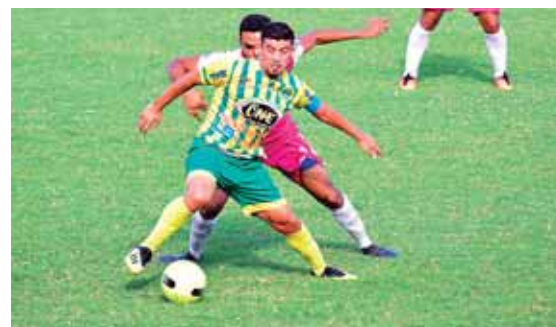
Limeños y parrilleros lucharán mañana en La Lima por clasificarse a los cuartos de final de forma directa.