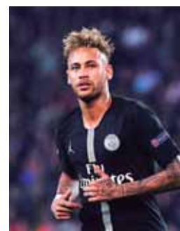
Neymar con el PSG van por buen camino con diez triunfos.