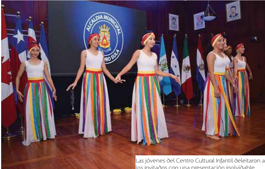
Las jóvenes del Centro Cultural Infantil deleitaron a los invitados con una presentación inolvidable.