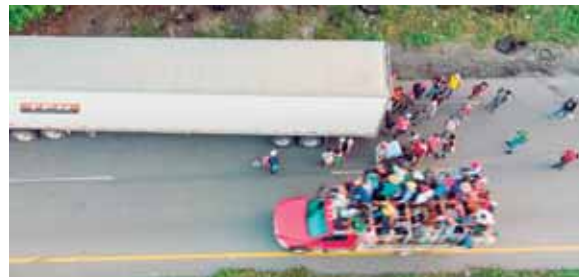
Muchos camioneros se están negando a transportar a los migrantes, pero los de la imagen tuvieron suerte en su camino a Arriaga.

La página digital Quadratin Chiapas reportó que casi medio centenar de agentes del INM apoyados por oficiales de gendarmería, se instalaron en grupos en pasos informales ubicados a la orilla del río Suchiate, que divi-