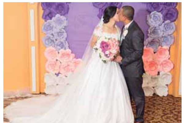
Durante uno de los inolvidables momentos de su enlace matrimonial.