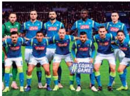
Nápoles viene de sacar un empate frente al PSG en Champions, mañana se mide a la Roma.