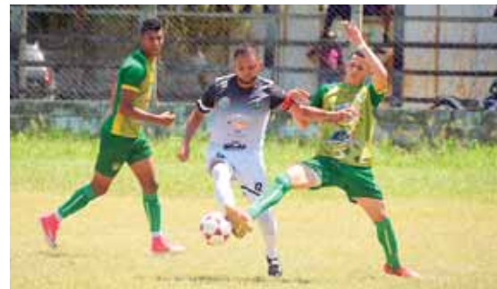
El Atlético Limeño tiene que ganar para lograr la clasificación, ya que puede perder tres o seis puntos.