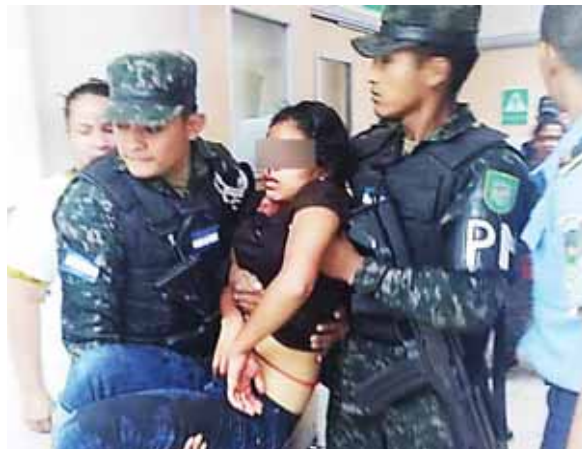
Los menores resultaron heridos cuando se conducían junto a su padre en un vehículo en busca de asistencia médica.

El reporte policial revela que, al llegar al lugar ya había presencia de varias patrullas de la PMOP por lo que se procedió a verificar la existencia de tres menores de edad heridos a quienes traslada-