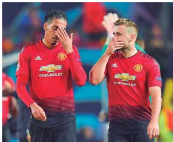
El Manchester United ha tenido un arranque difícil en la Premier League y le urge seguir ganando para alcanzar los primeros lugares.