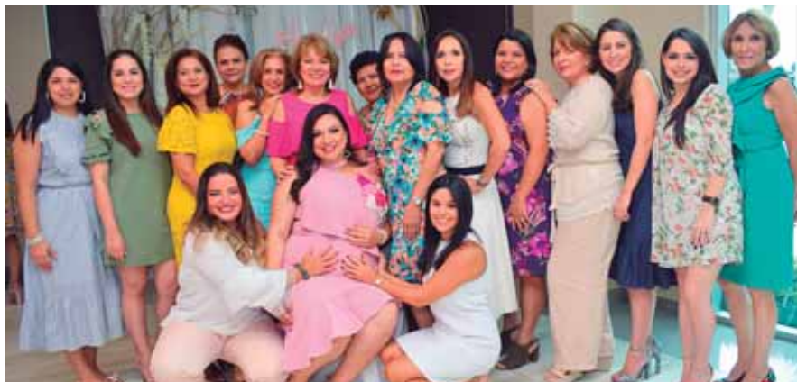
Todas las amistades posaron para la foto del recuerdo.

nalidades rosa y blanco mezcladas con pinceladas en dorado, fueron el punto de partida para Floral Boutique HN que hicieron que la estancia luciera espectacular y perfecta para la ocasión. Alicia Sikaffy de Treats Boutique fue la encargada de elaborar los exquisitos cupcakes de diseño, pasteles, popcakes, galletas y bombones de chocolate recubiertos, engalanaron la estación de dulces y el delicioso pastel de celebración realizado por Signature Cakes.