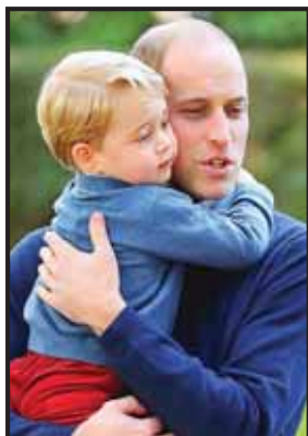
El príncipe William abraza a su hijo.