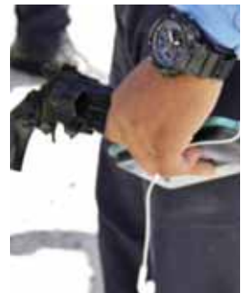
Agentes policiales le decomisaron el arma imitada.

Al hacerle el registro al asaltante descubrieron que portaba una pistola de juguete con la que había cometido la fechoría.