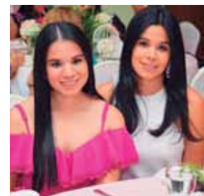
Daniela Alvarado y Gabriela Alvarado.