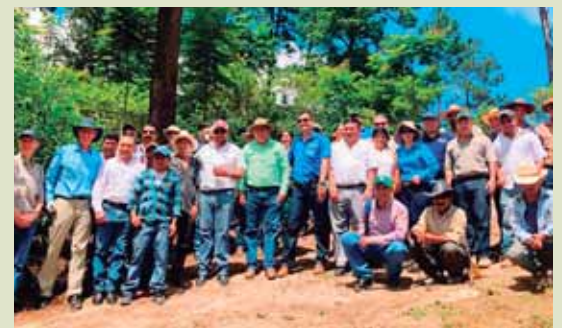
En la gira de campo participaron productores, representantes del (Ihcafé), de la SAG-Dicta y otros.

Por su parte, la importación de bienes de consumo semiduraderos, como celulares y automóviles desde Estados Unidos, televisores desde México y motocicletas de China sumó 929.3 millones de dólares, con un alza de 35.3 millones, con lo que se ha disparado el déficit, según el Banco Central