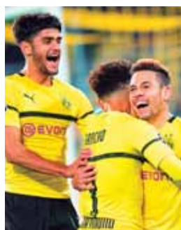
El club Borussia encabeza la liga con 20 puntos.