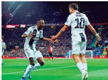
La Juventus llega con toda la motivación pues venció al Manchester United.