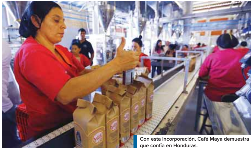
Con esta incorporación, Café Maya demuestra que confía en Honduras.

Añadió que su empresa tiene la capacidad de producir el 80 por ciento del consumo interno del grano. “Estamos comprometidos con Honduras, por eso nos adhe-