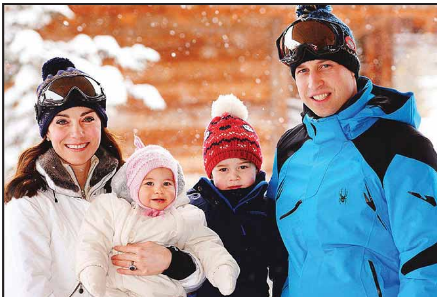
La realeza en Francia.