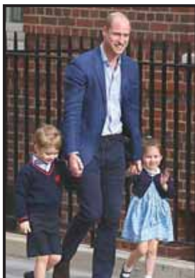
El príncipe William con sus hijos.