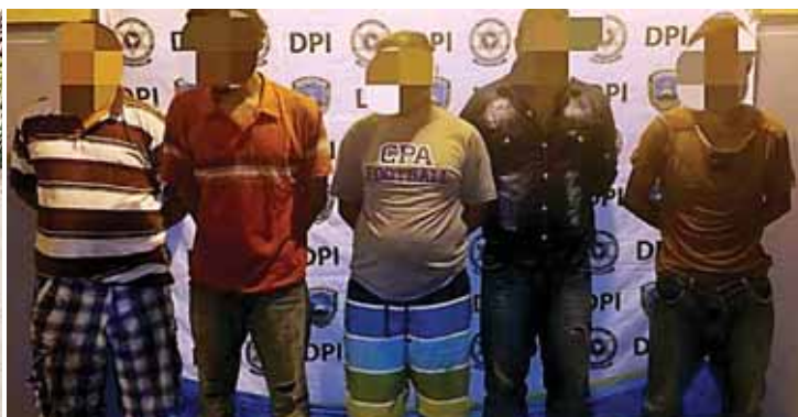
Ellos fueron capturados infraganti, cuando mantenían a una persona secuestrada, por la que exigían una fuerte cantidad de dinero.