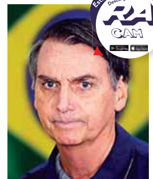
Jair Bolsonaro cuestionó en varias ocasiones la actuación de organismos internacionales, como el Comité de Derechos Humanos de la ONU.