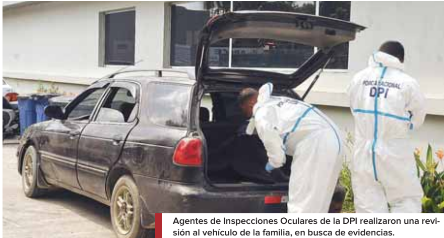
Agentes de Inspecciones Oculares de la DPI realizaron una revisión al vehículo de la familia, en busca de evidencias.

de la Dirección Policial de Investigaciones (DPI), están indagando acerca de las circunstancias en que ocurrió ese confuso incidente donde se supone hubo abuso de autoridad y tentativa de homicidio.