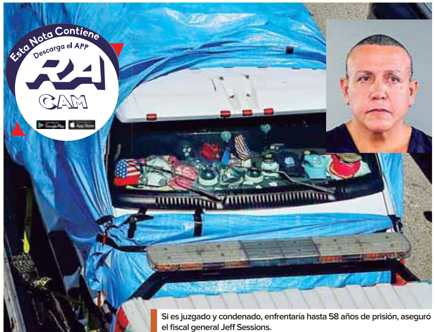
Si es juzgado y condenado, enfrentaría hasta 58 años de prisión, aseguró el fiscal general Jeff Sessions.

El presidente de Estados Unidos, Donald Trump, elogió ayer “increíble trabajo” de la policía federal (FBI) luego del arresto del sospechoso por el envío