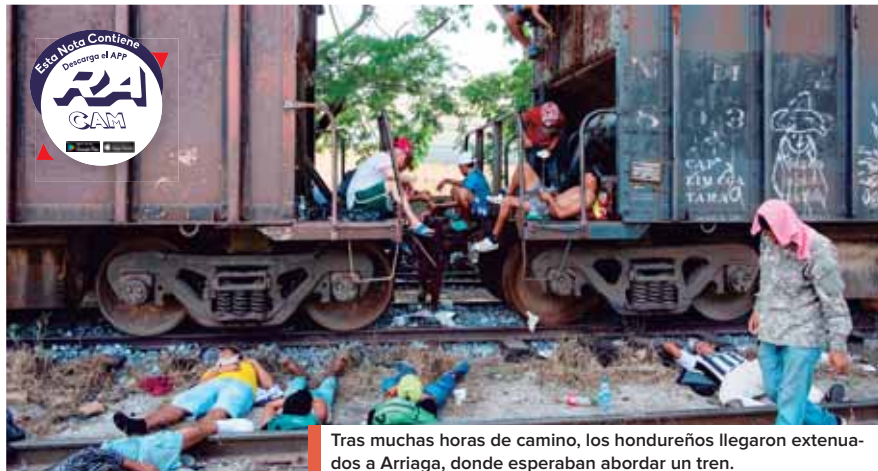
Tras muchas horas de camino, los hondureños llegaron extenuados a Arriaga, donde esperaban abordar un tren.

Ante el calor que se registra en la zona, muchos de los mi-