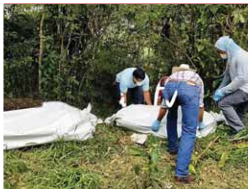
Hay un posible cómplice por la muerte de tres personas que aparecieron en una fosa común, en Nueva Frontera.

Asimismo, durante la operación se instaló una Feria de Salud para la atención integral a la población