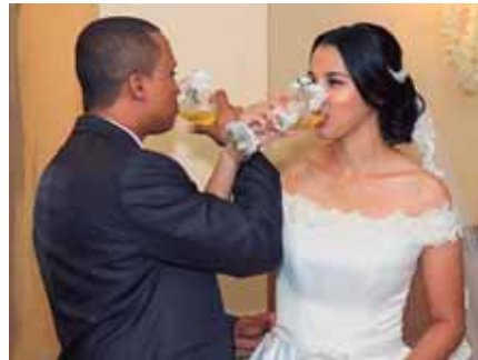
En el brindis nupcial.