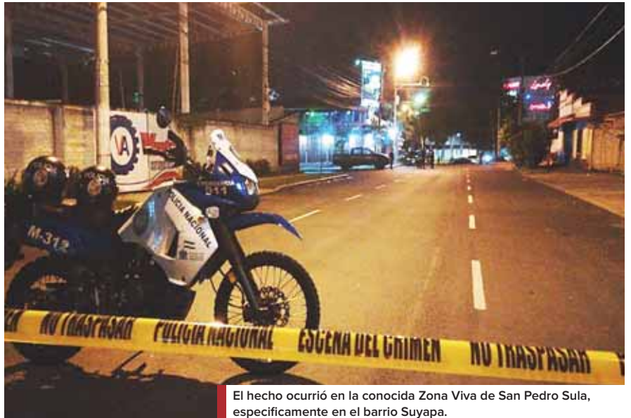
El hecho ocurrió en la conocida Zona Viva de San Pedro Sula, específicamente en el barrio Suyapa.

Mientras que la segunda versión es que presuntamente dos individuos ingresaron al local con el objetivo de asaltar a los presentes; sin embargo, ambas versiones están siendo trabajadas por agentes de la Dirección Policial de Inves-