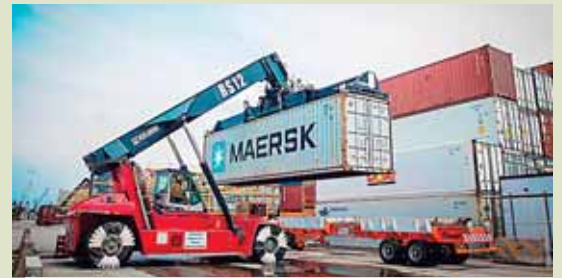
Hasta junio pasado, los ingresos de bienes de consumo alcanzaron un millón 343 mil dólares.