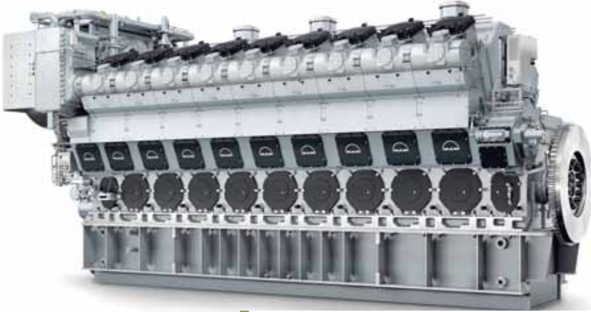
La planta estará operando con tres motores MAN 18V51/60.