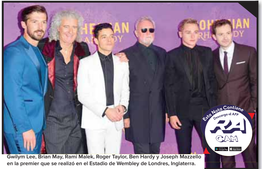
Gwilym Lee, Brian May, Rami Malek, Roger Taylor, Ben Hardy y Joseph Mazzello en la premier que se realizó en el Estadio de Wembley de Londres, Inglaterra.

Asistieron a la película: Rami Malek, Gwilym Lee, Ben Hardy, Joe Mazello, Lucy Boynton, Mike Myers, Allen Leech, Aidan Gillan y Tom Hollander junto con los miembros originales de la banda Queen, Brian May y Roger Taylor. Los productores Graham King y Jim Beach (el mánager original de