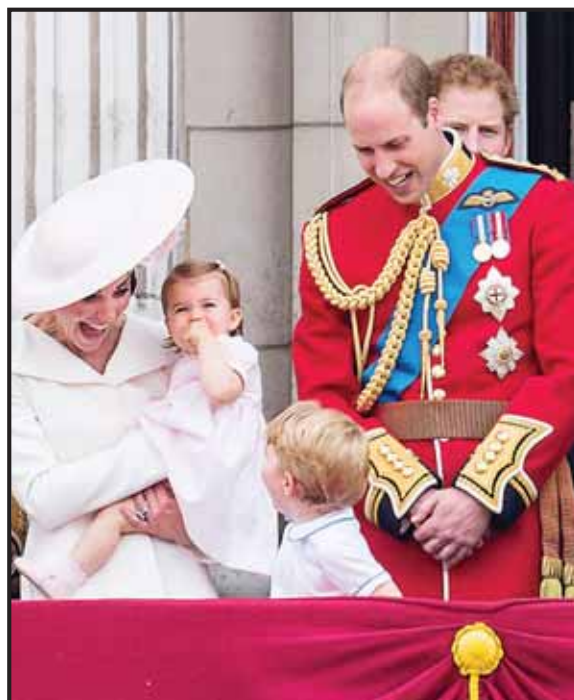
Los duques en el desfile de la Reina Isabel

Los más pequeños de la realeza inglesa son nuestros preferidos. Recopilamos algunas de las fotos más tiernas de los duques de Cambridge con sus hijos, George, Charlotte y Louis.