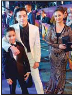
Rami Malek junto a su familia.