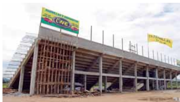
Esta es la gradería Oeste del estadio, la cual ya se encuentra casi finalizada, al igual que el cerco perimetral.

es el costo de la obra, sin contar el valor del predio que Parrillas One adquirió previamente.