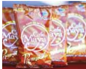
En los empaques de Café Maya está impreso el logo de Marca País.

- La empresa genera más de 400 empleos directos en la fábrica y 1,200 puestos en tiempo de cosecha del grano en sus fincas.