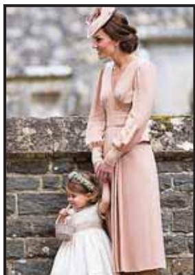
Kate Middleton con la princesa Charlotte.