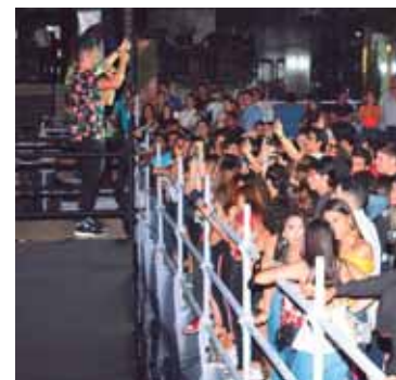
El público disfrutó la velada musical.