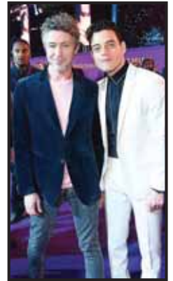
Aidan Gillen y Rami Malek.