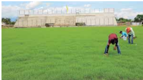
La grama del estadio es variedad Bermuda, la cual tolera muy bien el uso frecuente.

El estadio contará con una gradería general con capacidad para 3,000 personas, palco general, palco privado y silla, la casa sede, cabinas de transmisión, oficinas, camerinos y duchas y una cancha de entrenamiento.