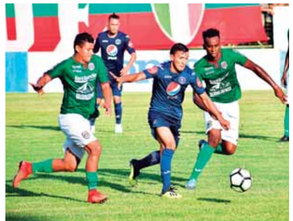
El juego entre Motagua y Marathón se juega el lunes a las de la tarde, determinó ayer la Liga Nacional.