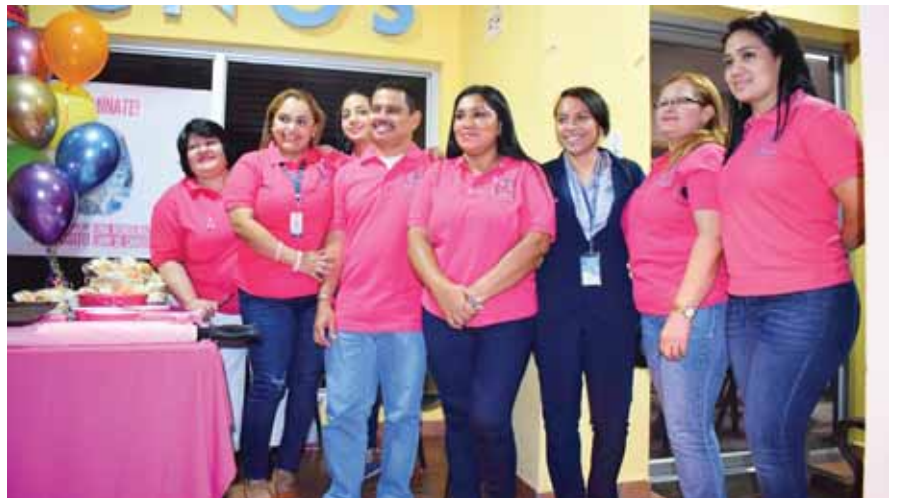
En Diagnos le atiende personal capacitado.