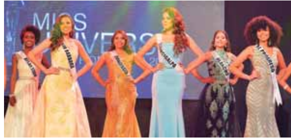
Las soberanas mientras lucían sus atuendos de gala.