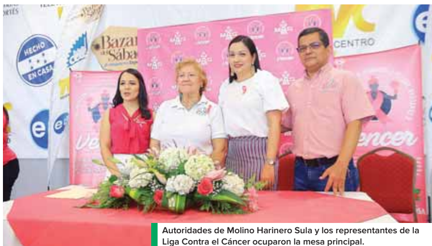
Autoridades de Molino Harinero Sula y los representantes de la Liga Contra el Cáncer ocuparon la mesa principal.

Recibió ocho quimioterapias en dos fases de cuatro y la evolución fue muy satisfactoria porque en el transcurso del tratamiento no necesitó refuerzos, “gracias a Dios y a la Liga que me apoyaron”.