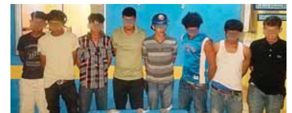
La mayoría fue detenida para efectos de investigación.