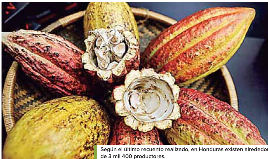
Según el último recuento realizado, en Honduras existen alrededor de 3 mil 400 productores.

El concurso realizado a nivel mundial también reconoce y valora el trabajo de los productores mediante un reconocimiento internacional a cosechadores del grano fi-