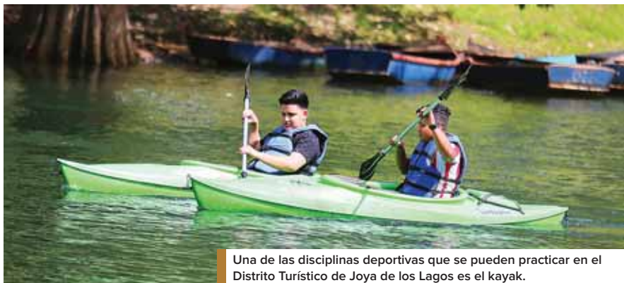
Una de las disciplinas deportivas que se pueden practicar en el Distrito Turístico de Joya de los Lagos es el kayak.

La evaluación de las unidades de transporte es un requisito indispensable para poder circular por todo el país durante el período festivo". José Lobo, director del Instituto de Transporte