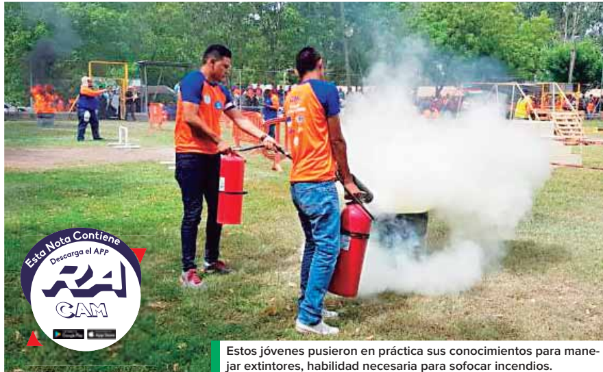
Estos jóvenes pusieron en práctica sus conocimientos para manejar extintores, habilidad necesaria para sofocar incendios.