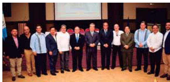
El cónsul de Guatemala con parte de sus fieles colaboradores.