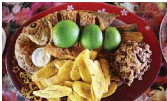
La gastronomía hondureña ofrece una amplia gama de exquisitos platillos. El pescado frito es uno de los preferidos.