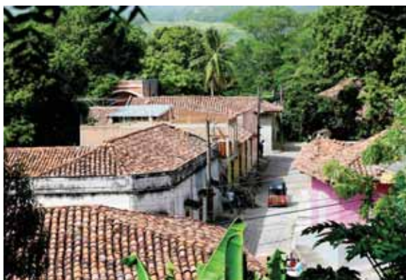
Pespire espera con las puertas abiertas a los turistas nacionales que opten por un ambiente de tranquilidad y frescura.