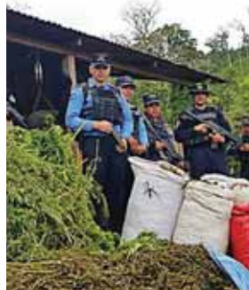
En el lugar se encontró siete sacos con marihuana.

Autoridades realizan investigaciones para identificar, localizar y capturar a los propietarios del alucinógeno.