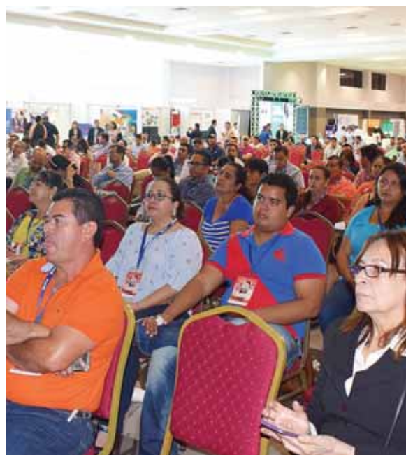
Durante el evento impartieron diversas charlas.

Con gran éxito se llevó a cabo el evento “Evolución Pyme” el pasado 27 de septiembre en la Cámara de Comercio e Industrias de Cortés (CCIC) el cual se realizó por primera vez en San Pedro Sula como un encuentro corporativo único y de proyección regional con un formato valioso que ofreció información sobre áreas como: comercial, negociación, procesos y tecnología.