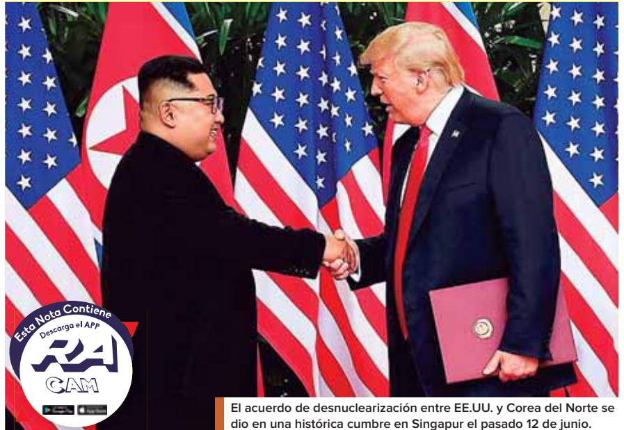
El acuerdo de desnuclearización entre EE.UU. y Corea del Norte se dio en una histórica cumbre en Singapur el pasado 12 de junio.

Esos fueron solo algunos de los insultos que los líderes de los dos estados con armas nucleares se lanzaron entre sí