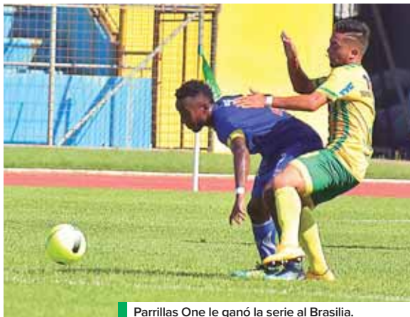
Parrillas One le ganó la serie al Brasília.