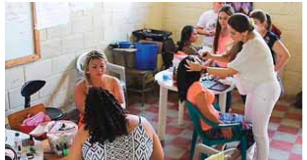
Previo al concurso, cada una de las participantes fue peinada y maquillada por sus compañeras estudiantes de belleza.

Cada año las privadas de libertad eligen a su reina, la cual debe demostrar su talento, El estar en un establecimiento penitenciario no ha sido obstáculo para que las féminas continúen preparándose.