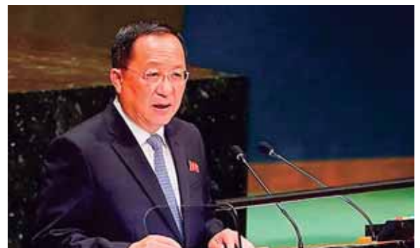
El ministro de Exteriores de Corea del Norte, Ri Yong Ho, afirmó que “no hay forma” de que su país se desarme.

Después de que los medios estadounidenses informaran en agosto pasado que Pyongyang había conseguido encajar una ojiva nuclear en un misil, Trump advirtió a Pyongyang de que no amenazara a Estados Unidos o se enfren-