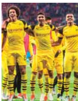
Dortmund es líder con 14 puntos, uno más que el Bayern.