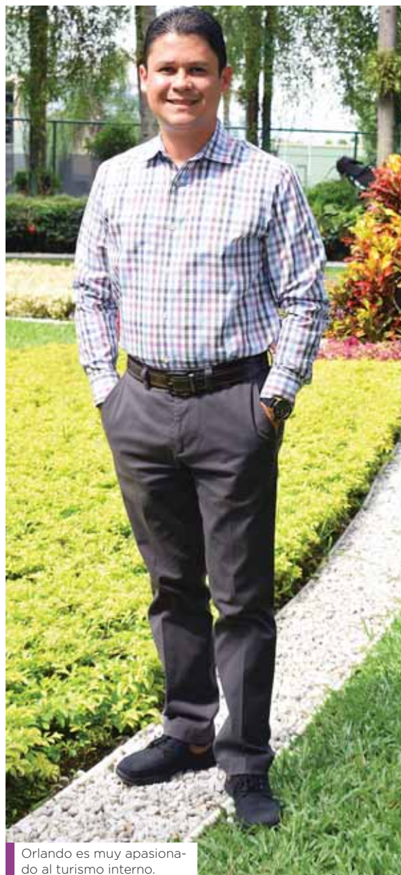
Orlando es muy apasionado al turismo interno.

boración de etiquetas para prendas, fuimos parte de un proceso de certificación de normas ISO, pero fue de mucho aprendizaje y muchos retos, quiero mencionarles que la herencia que dejó esta empresa fue haber dejado profesionales muy capacitados que están incorporados en otras fábricas y con un perfil mucho mejor que con el que iniciaron y en lo personal deseo compartirles algo que me marcó para toda la vida, yo estuve en Estados Unidos por un período de un año más o menos y como todos, buscando una mejor oportunidad, después de quince días de estar allá, conseguí trabajo, como pintor, fuimos a una residencial y alguien me preguntó si podía pintar y como los hondureños nunca decimos que no, me fui a trabajar, recuerdo que pinté un portón y cuando yo finalicé mi trabajo, sin querer derramé pintura en la acera, la limpié pero no había quedado igual, llegó el dueño y me preguntó qué había pasado, yo le conté y me dijo muy tranquilo que debía dejar el lugar tal cual lo encontré, eso me sirvió de algo: uno debe hacer las cosas bien de principio a fin.