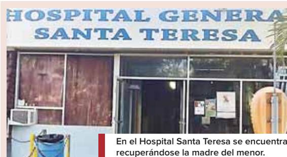
En el Hospital Santa Teresa se encuentra recuperándose la madre del menor.

Desde la cárcel fueron remitidos al hospital público Gabriela Alvarado de Dandí, pero al no contar en el mismo con materiales quirúrgicos y los cirujanos necesarios, fueron remitidos de emergencia al Hospital Escuela Universitario (HEU) DE Tegucigalpa.