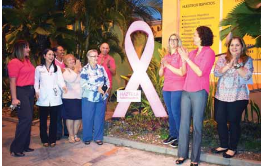
Diagnos encendió la flama y con ello inició oficialmente la campaña rosa.

“La Tomosíntesis nos permite encontrar lesiones ocultas y por ello se ha incrementado la detección de cáncer, tenemos una casuística importante de mujeres que se han realizado mamografía 2D, con resultado normal, pero que al hacerlas en 3D hemos encontrado cáncer”, explicó el Dr. Paz.