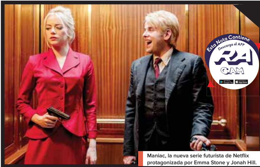
Maniac, la nueva serie futurista de Netflix protagonizada por Emma Stone y Jonah Hill.