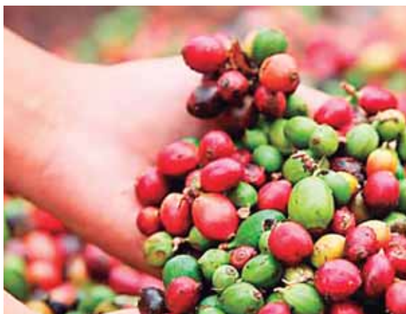
Las exportaciones de café generaron 680.28 millones de dólares en mayo del presente año.