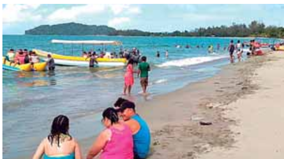
En un ambiente familiar, muchos hondureños llegaron a disfrutar de las ofertas de restaurantes y hoteles.

del Saber. El doctor Ugarte agradeció a los muchachos sus aportes a la alcaldía y valoró también lo que realizan para otras empresas del país. Les pidió mantener siempre sus mentes abiertas para que pongan en práctica lo aprendido en sus futuros empleos.