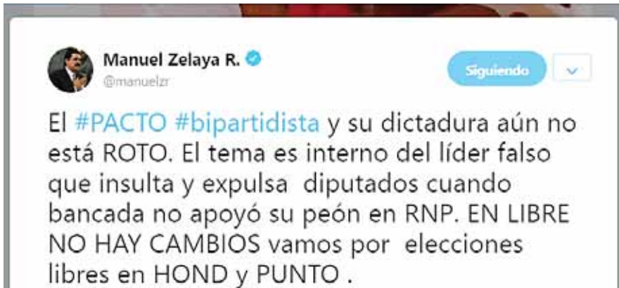
El expresidente Manuel Zelaya fustigó en sus redes a Luis Zelaya, a quien llama "líder falso".