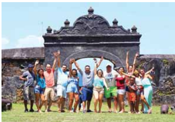
La Fortaleza de Santa Bárbara, otro centro de atracción, se encuentra ubicada en la ciudad de Trujillo, departamento de Colón.