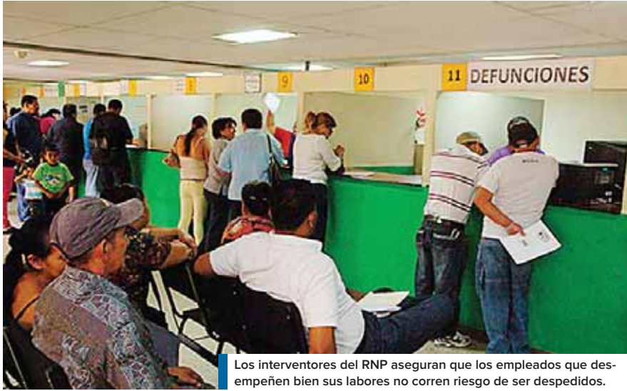
Los interventores del RNP aseguran que los empleados que desempeñen bien sus labores no corren riesgo de ser despedidos.