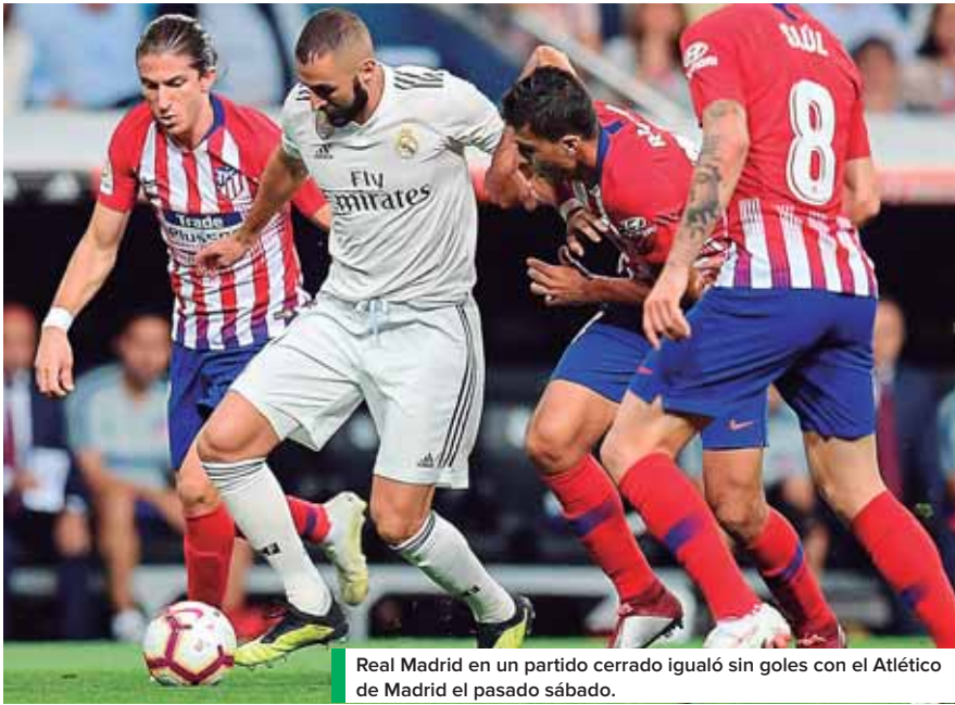
Real Madrid en un partido cerrado igualó sin goles con el Atlético de Madrid el pasado sábado.