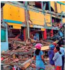
Los hospitales no daban abasto con la llegada de víctimas y muchos heridos