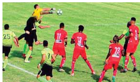
El empate fue un buen negocio para los mineros en La Ceiba.