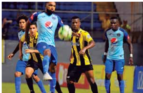
Real España y Motagua fue un buen partido que agradó a los aficionados que llegaron en un buen número.