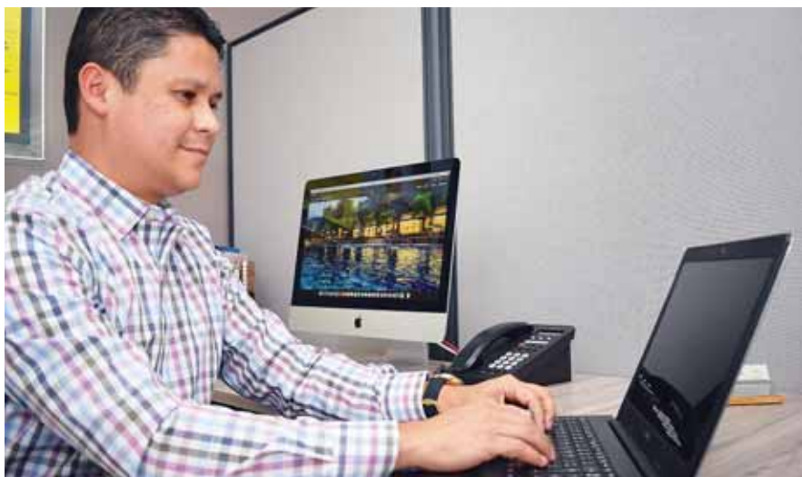
Lo que más le gusta de su trabajo es organizar su día desde muy tempranas horas.