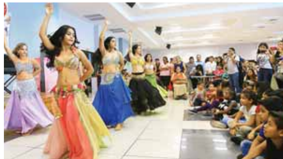
En el lanzamiento de la campaña se realizaron diversas actividades. Estas jovencitas mostraron sus habilidades en danza árabe.