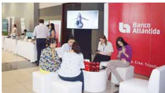
Banco Atlántida ofrece sus productos y servicios.

“Nos sentimos contentos de estar cerca de la Pyme porque estamos tratando de innovar con soluciones tecnológicas para que tengan el conocimiento de que existen muchas formas de acceder a la tecnología, la Pyme es el motor de los países lo que hace falta en muchos casos es estar informados de que hay diversas mane-