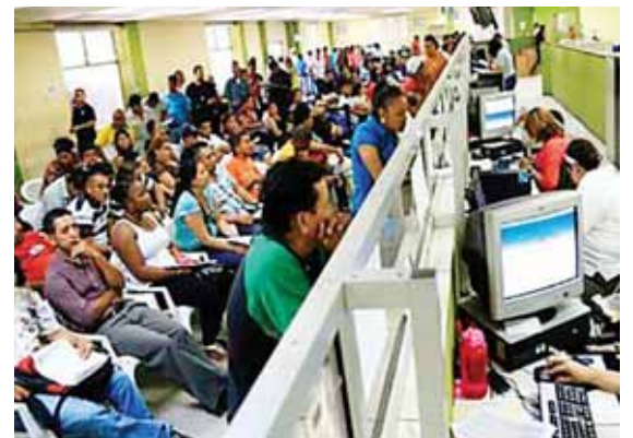
El SAR estará trabajando en un horario normal, de 8:00 de la mañana a 4:00 de la tarde, a pesar que inicia el feriado.

Por otra parte, sostuvo que la empresa privada trabajará el lunes, martes y miércoles de esta Semana Morazánica, entonces no hay ningún inconveniente para que preparen la declaración del Impuesto Sobre Ventas (ISV), cuyo plazo de presentación y pago vence el 10 de octubre. Todos retornamos a nuestras actividades el 8 de octubre, por tanto tendrán ese día también el martes y miércoles de esa semana para cumplir con ese trámite. “De manera que no se justifica prorrogar ese vencimiento porque no cae en día inhábil”. Aseguró que la recaudación tributaria durante el año ha estado conforme a lo proyectado, pues al “26 de septiembre teníamos una recaudación acumulada de 73,700 millones de lempiras”. Se esperan los pagos que se hicieron el sábado y los que se harán el domingo para calcular la recaudación acumulada proyectada, que rondará los L.77,000 millones, señaló.