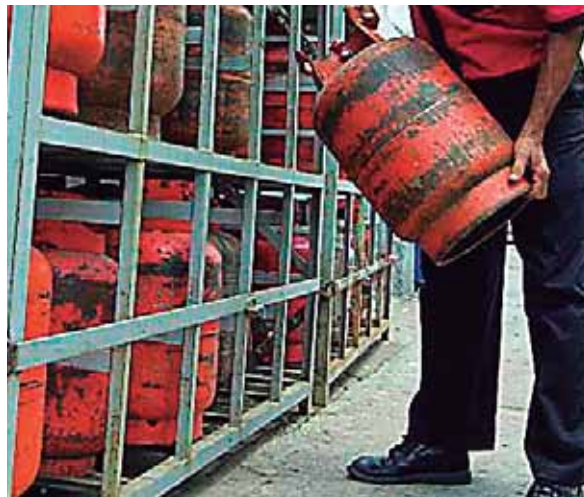
El precio entrará en vigencia a partir de hoy a las 6:00 de la mañana según la Secretaría de Energía.