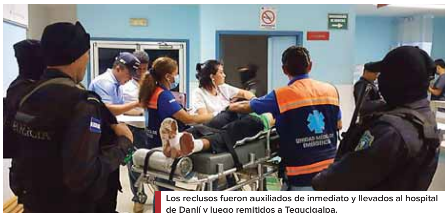
Los reclusos fueron auxiliados de inmediato y llevados al hospital de Danlí y luego remitidos a Tegucigalpa.