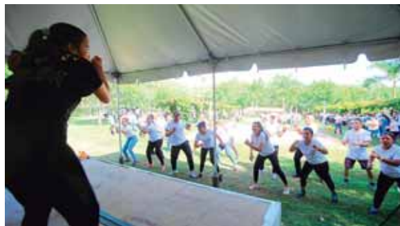
No todo fue trabajo duro. También hubo tiempo para el esparcimiento, como demostraron estos jóvenes que practicaron zumba.

Lara detalló que los aspectos básicos son: la selección de víctimas cuando hay desastres múltiples; rescate en alturas; circuito del