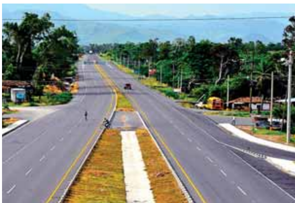
La infraestructura vial permitirá a los excursionistas desplazarse a su lugar de destino sin mayor inconveniente.