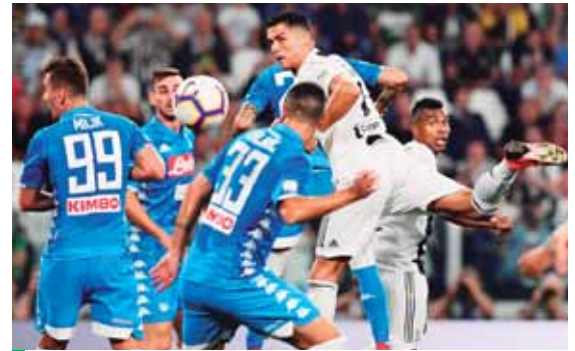
Cristiano Ronaldo fue titular pero no anotó.