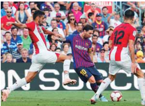
Barcelona empató y en una semana perdió siete puntos en los tres encuentros disputados.