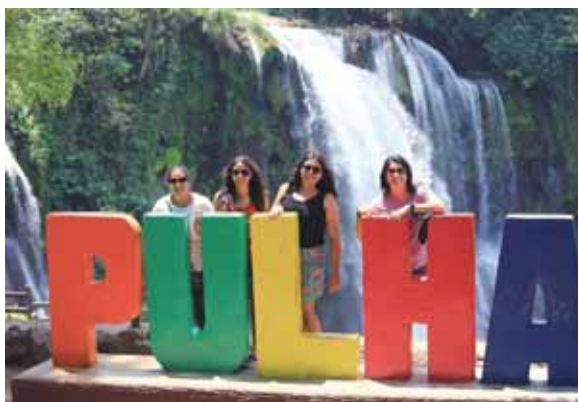
Las cataratas de Pulhapanzak son uno de los atractivos más concurridos por los visitantes durante temporadas de asueto.