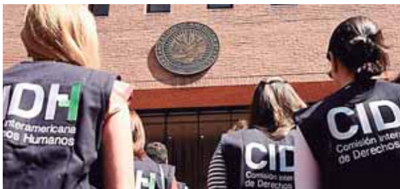
El ICE terminó el año fiscal 2018 con diversos y grandes operativos donde detuvo a casi 300 personas.