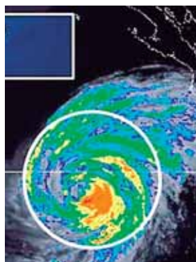
Por las lluvias hay 8 personas muertas y 6 desaparecidas.

Se esperan “tormentas muy fuertes” en la península de Baja California