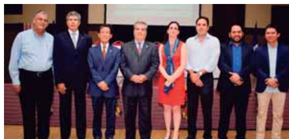
Los miembros de la Asociación del Cuerpo Consular, fueron parte de los invitados especiales de la noche.