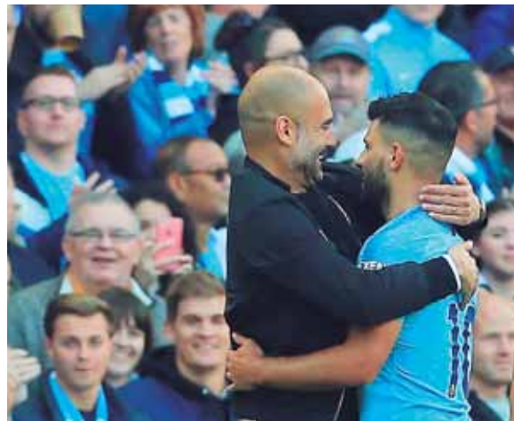
Manchester City con 19 puntos lidera en Inglaterra, Liverpool tiene igual cantidad y más abajo se queda con 17 el Chelsea.