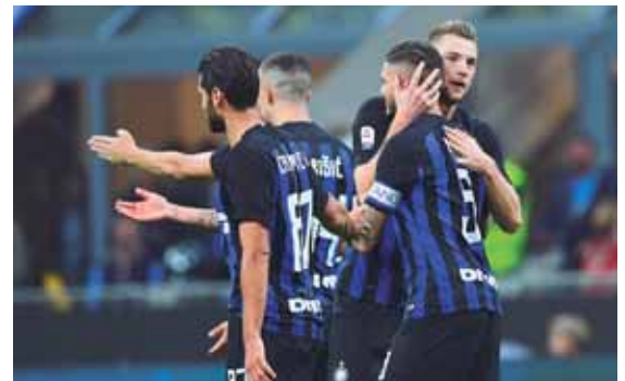
Inter de Milán se dio un festín goleando al Sassuolo.