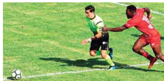
El partido entre cocoteros y mineros fue muy disputado.

Goles: F. Grant (46) B. Acosta (24) C. Bernárdez (53) Corrales (85) Árbitro: Saíd Martínez