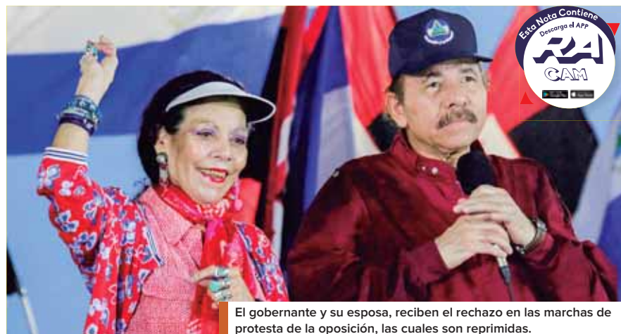
El gobernante y su esposa, reciben el rechazo en las marchas de protesta de la oposición, las cuales son reprimidas.

“Yo le digo a los congresistas y senadores norteamericanos que están votando a favor de esa ley injerencista que lo que vienen es simplemente a hacerle daño a la economía del país”, indicó el mandatario en una ceremonia que presidió junto a su esposa, la vicepresidenta Rosario Murillo.