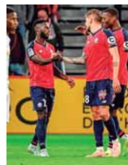
Con su triunfo el Lille sumó 16 puntos en Francia.