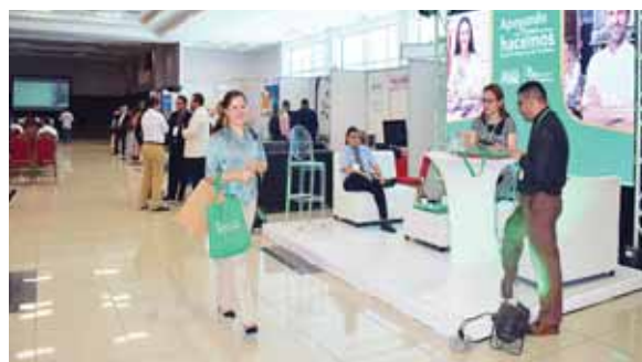
Banco de Occidente estuvo presente en “Evolución Pyme”.

Indicó que muchas empresas se acercaron al stand de Softland a solicitar información con lo cual descubrieron algunas necesidades, encontrándose con la grata sorpresa que el empresario Pyme en Honduras sabe que es necesario invertir en