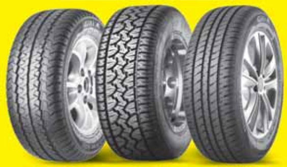
GITI VAN 600 GITI AT 100 GITI COMFORT T20