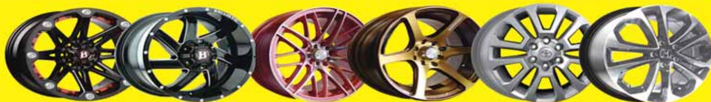
BALLISTIC OFF ROAD