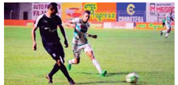
Los progreseños aprovecharon la localía para vencer al Juticalpa.