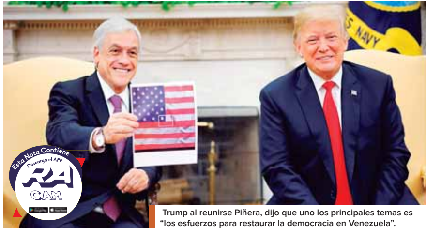
Trump al reunirse Piñera, dijo que uno de los principales temas es “los esfuerzos para restaurar la democracia en Venezuela”.

A la pregunta de si va a reunirse con el presidente de Venezue-