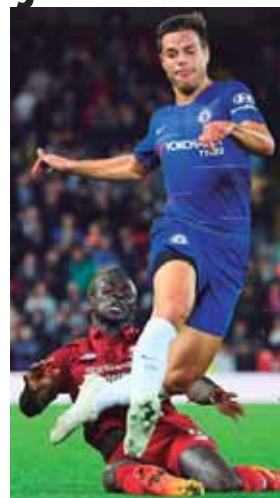
El pasado miércoles en Copa inglesa, Liverpool cayó 2-1 ante los Blues, va en busca de revancha.

En Stamford Bridge se verán las caras dos invictos en la Premier, el Liverpool que parece haber alcanzado por fin la regularidad y el Chelsea renacido.