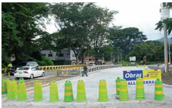
El puente mide 30 metros de longitud y 10 metros de ancho, con sus respectivos pretilles y acera peatonal.

El alcalde Armando Calidonio realizó un recorrido por cada uno de los “stands” y degustó de la comida catracha propia de los departamentos representados durante la actividad recreativa. Además, felicitó personalmente a los participantes y reconoció su esfuerzo y dedicación.