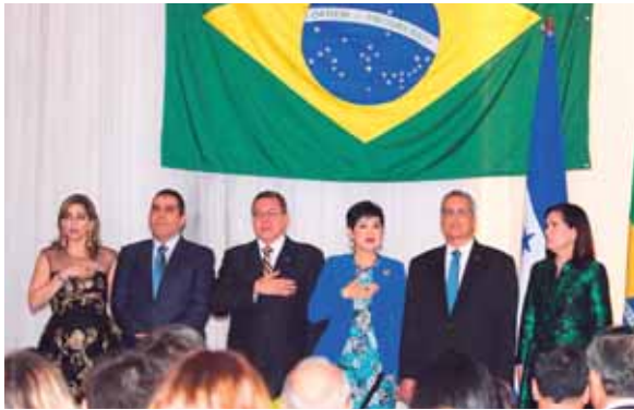
Cuando se entonaban las solemnes notas del himno nacional de Honduras.