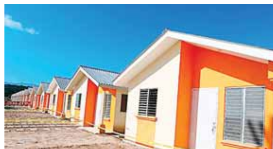
Según autoridades de Convivienda, son varios proyectos los que se ejecutan y que estarán disponibles a corto plazo.

Destacó que “cada muchacho que formamos en Infop nos cuesta 116,000 lempiras al año”.