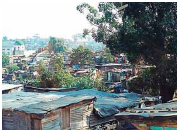
El estudio de la Fideg se obtuvo en una medición de la pobreza con base en el consumo.