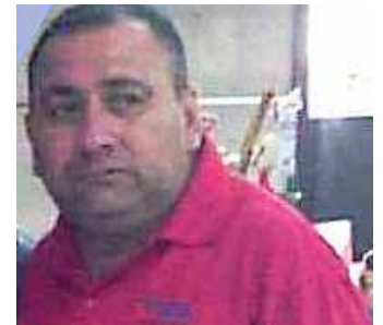
Ministerio Público, según sus parientes donde trabajaba en ese oficio desde hace 14 años.