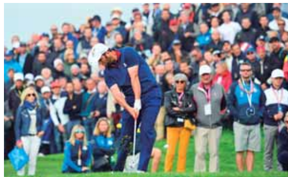
Jon Rahm quería ganar en su debut en la Ryder Cup. Su motivación era contagiosa. Pero no pudo ser.

un hoyo abajo. Hoy volverán a disputarse fourballs por la mañana y foursomes por la tarde.