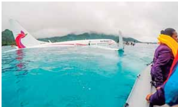
Los 36 pasajeros y 11 miembros de la tripulación fueron trasladados a un hospital

Air Niugini no dio precisiones sobre las causas del accidente. AFP