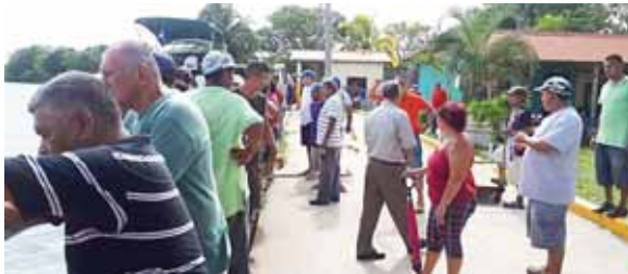
Los familiares permanecen a la espera de noticias.

Ayer, sus colegas faenadores, ya no salieron a buscarlos, a causa de la fatiga y por sus economías men-