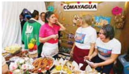
Los miembros de la Tesorería obtuvieron el primer lugar con la representación de Comayagua.