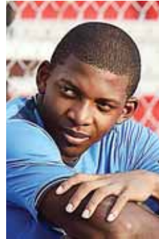
"Buba" López, reconocido futbolista.