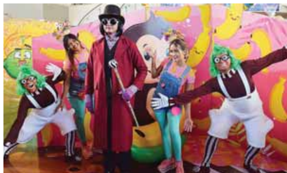
Los niños podrán disfrutar de dulces, ositos de goma enormes, chocolates de 2 metros, malteadas gigantes y muchas sorpresas.

guardería porque hay muchas madres que salen a trabajar y deben dejar a sus hijos con los hermanos o con vecinos, porque no hay nadie más quien se los cuide.