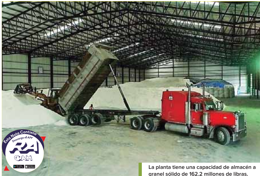
La planta tiene una capacidad de almacén a granel sólido de 162.2 millones de libras.

“Podemos procesar 73 mil toneladas de producto en tres meses y anualmente alrededor 200 mil toneladas de producto seco”, explicó