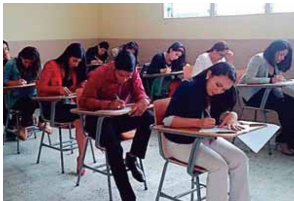
La nueva oferta académica pretende capacitar a los jóvenes para que aprovechen mejor las oportunidades en el área laboral.