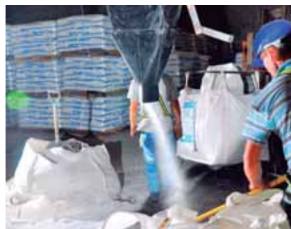
Los empleos generados son 250 y adicionales a ellos 200 fuentes de trabajo indirectas.