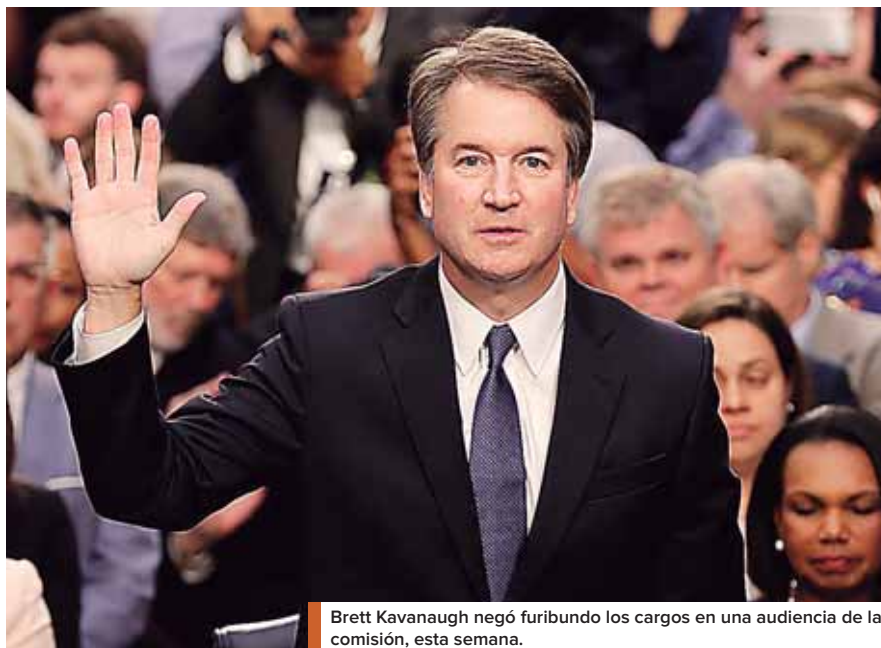
Brett Kavanaugh negó furibundo los cargos en una audiencia de la comisión, esta semana.

Los demócratas han pedido repetidas veces una investigación del FBI sobre las acusaciones por parte de la profesora universitaria Christine Blasey Ford, una de las tres mujeres que acu-