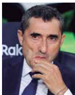
Valverde dice que el Bilbao irá a buscarlos en el juego.