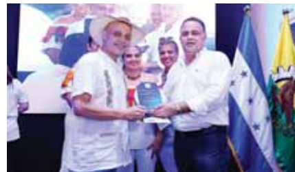
El tercer lugar fue para el departamento de El Paraíso, representado por Servicios Públicos.