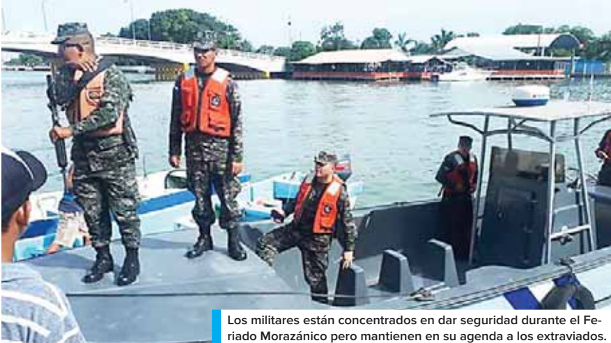
Los militares están concentrados en dar seguridad durante el Feriado Morazánico pero mantienen en su agenda a los extraviados.