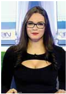
Carmen Boquín, destacada presentadora de TV Internacional.