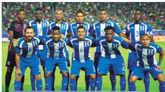
A casi un año de haber sido eliminados a Rusia 2018, la selección aún no tiene entrenador para el proceso rumbo a Qatar.

Salomón descartó por los momentos optar a la presidencia de la federación e insistió que él solo cumple un mandato de la Fifa, concluyó.