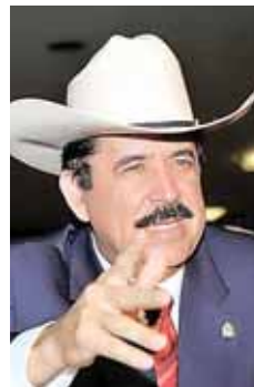
Manuel Zelaya, expresidente de la nación.