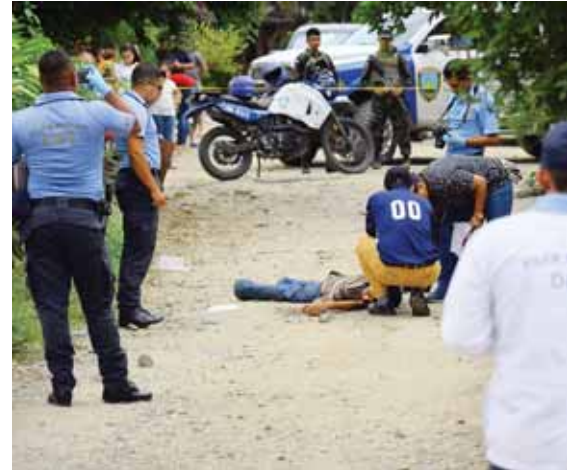
Medicina Forense realizó el levantamiento de los restos del joven quien fue ultimado en plena vía pública.