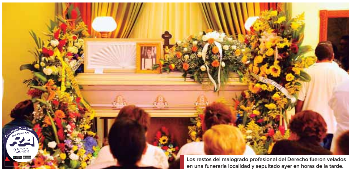
Los restos del malogrado profesional del Derecho fueron velados en una funeraria local y sepultado ayer en horas de la tarde.