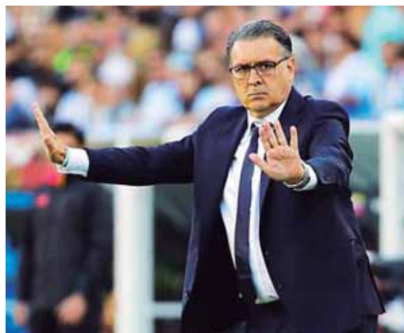
El entrenador argentino suena para volver a la selección de su país y México, pero sigue trabajando con el Atlanta en la MLS.

debería ser la gente que da esas informaciones las que lo hagan", aseveró. El "Tata", exseleccionador de Argentina y Paraguay y extécnico del Barcelona entre otros, ha visto su nombre vinculado desde hace semanas al de su país y, desde hace días, también con el de México, Colombia e incluso con el de Estados Unidos, luego de firmar una brillante campaña con el Atlanta, que lidera la Conferencia Este con 63 puntos en 30 partidos gracias a un fútbol ofensivo y vistoso.