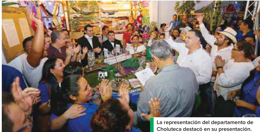
La representación del departamento de Choluteca destacó en su presentación.

“Lo más importante es que somos una familia, un grupo de amigos y personas que estamos sirviendo a la ciudad y es justo que podamos compartir esto y poder hacer amigos, ayudarnos y conocernos”, aseguró el alcalde Calidonio luego de felicitar y agradecer a los colaboradores municipales.