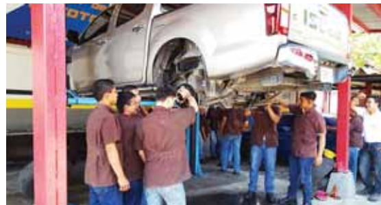
La preparación de cada muchacho en el Infop cuesta 116,000 lempiras anuales.

En varias ocasiones, Valladares acompañó a Leonel Rivera durante el transporte de drogas; estuvo presente en las pistas de aterrizaje cuando Los Cachiros recibieron cantidades sustanciales de drogas y se comunicó con Leonel Rivera mientras Los Cachiros transportaban drogas a través de Honduras.