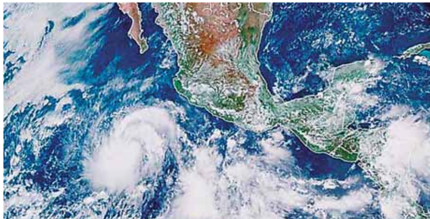
Las autoridades están preparando 700 refugios en Sonora, Baja California con capacidad para atender hasta 180 mil damnificados.

Al menos ocho personas murieron y otras seis se encuentran