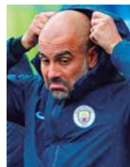
Guardiola no quiso profundizar en el caso del francés.