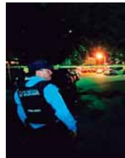
El hecho ocurrió en la colonia La Pradera.

Al menos 4 muertos diarios se reportan en Honduras por esas causas de acuerdo a datos oficiales del Observatorio de la Violencia de la UNAH.