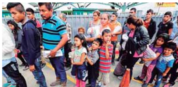
Unos 136 niños continúan bajo cuidado de la Oficina de Refugiados; 96 son hijos de padres que ya han sido deportados.

El presidente electo de México Andrés López Obrador dijo ayer que el acuerdo sobre el nuevo TLCAN con Estados Unidos está cerrado y que no hay una fecha límite para que se sume Canadá que aún negocia con Washington. López Obrador habló cuando los Congresos de Estados Unidos y México están cerca de recibir el texto final de su acuerdo bilateral. AFP