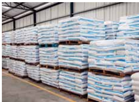
En el área de almacenamiento del complejo “Estela Joch” se observa cloruro de sodio ensacado.