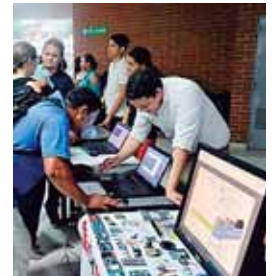
Con este proyecto serán beneficiados centros educativos públicos.

Con el “Hackathón”, las carreras de Informática Administrativa, Pedagogía y Psicología en apoyo de la Unidad de Vinculación Universidad-Sociedad, potenciarán el talento de los estudiantes universitarios con el desarrollo de videojuegos y otro tipo de aplicaciones educativas que fortalezcan el proceso de enseñanza-aprendizaje.