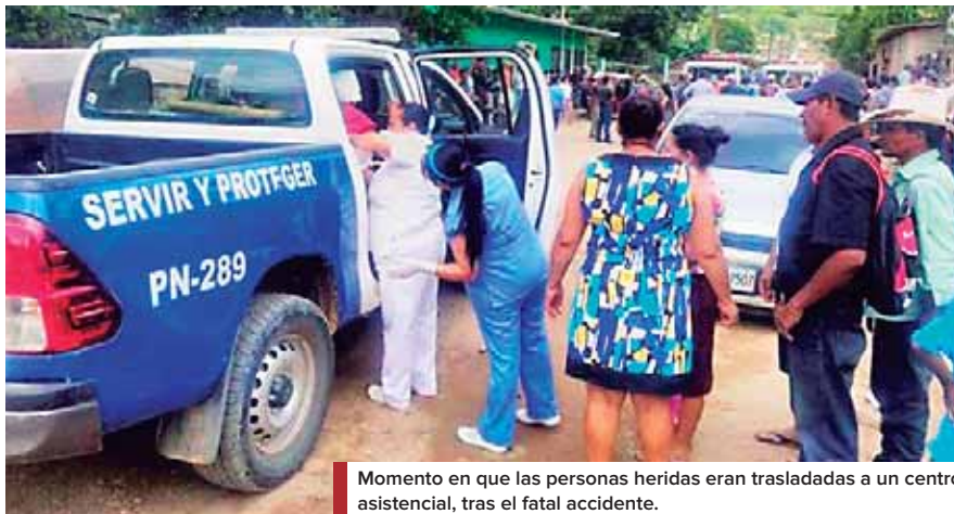
Momento en que las personas heridas eran trasladadas a un centro asistencial, tras el fatal accidente.

El ataque con cuchillo ocurrió la madrugada del 9 de diciembre de 2017 en la colonia San Martín de Trujillo, Colón.