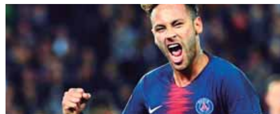
El París suma puntos en el primer lugar.

El encuentro viene marcado, además, por el rifirrafe entre el capitán madridista Sergio Ramos y el delantero “colchonero” Antoine Griezmann, después que el primero asegurara del segundo que “la ignorancia es atrevida”, en respuesta a las declaraciones del francés afirmando que puede estar en la misma mesa que Cristiano Ronaldo y Messi. Los azulgrana reciben al antiguo equipo de su técnico Ernesto Valverde tras cosechar su primera derrota el miércoles en Liga ante el Leganés y a las puertas de una terrible serie de encuentros, que incluyen, por orden; Tottenham, Valencia, Sevilla, Inter y Real Madrid.