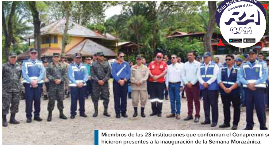
Miembros de las 23 instituciones que conforman el Conapremm se hicieron presentes a la inauguración de la Semana Morazánica.