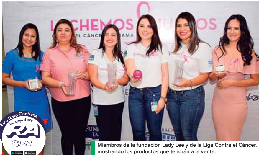
Miembros de la fundación Lady Lee y de la Liga Contra el Cáncer, mostrando los productos que tendrán a la venta.

En ese sentido dijo que el vaso rosa y el “speaker” estarán dis-