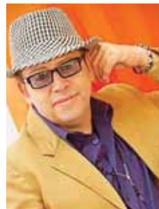
Miguel Caballero Leiva, famoso periodista capitalino.