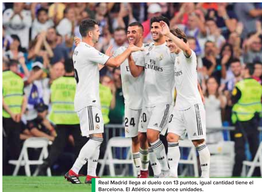
Real Madrid llega al duelo con 13 puntos, igual cantidad tiene el Barcelona. El Atlético suma once unidades.