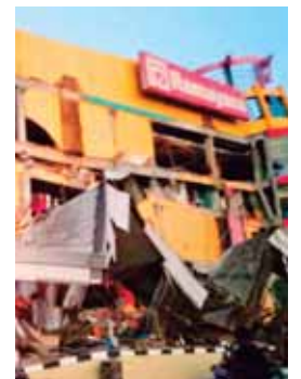
Indonesia se asienta sobre el llamado Anillo de Fuego del Pacífico; una zona de gran actividad sísmica.