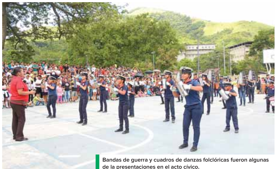
Bandas de guerra y cuadros de danzas folclóricas fueron algunas de las presentaciones en el acto cívico.

Los participantes en el desfile aprovecharon para dar a co-