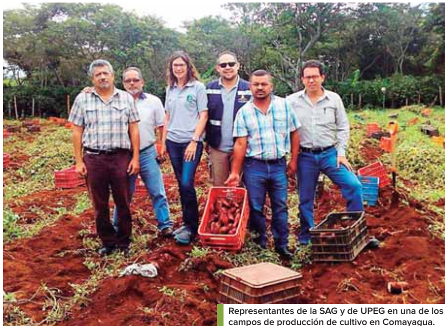
Representantes de la SAG y de UPEG en una de los campos de producción de cultivo en Comayagua.

El proyecto ha logrado capacitar a dos grupos comunitarios, por lo que con el tema “Enfoque de mejoramiento de vida”, se crearon dos