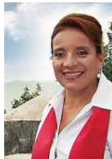
Xiomara Zelaya, destacada dama de la política hondureña.