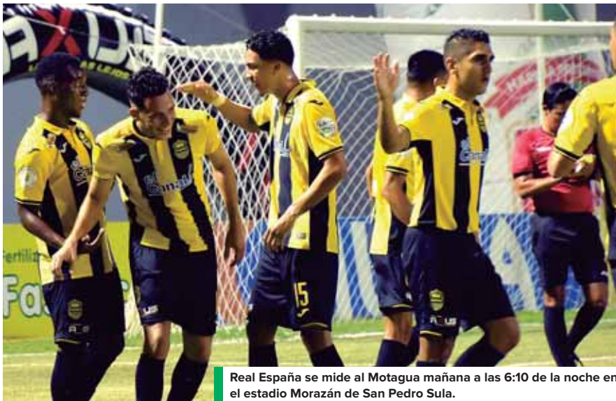
Real España se mide al Motagua mañana a las 6:10 de la noche en el estadio Morazán de San Pedro Sula.