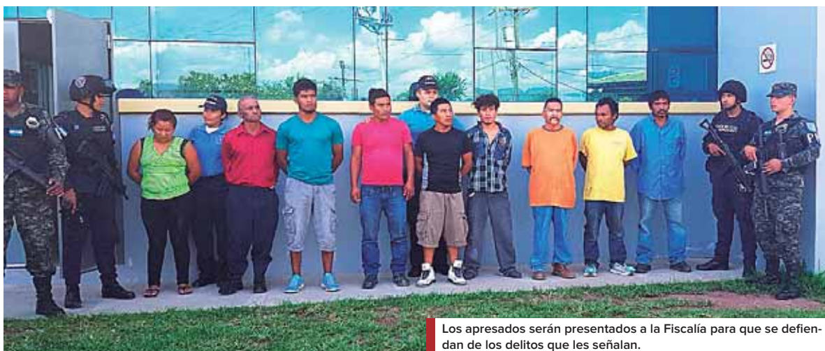
Los apresados serán presentados a la Fiscalía para que se defienda de los delitos que les señalan.

Asimismo, por el delito de violación en el caserío Los Llanitos, al