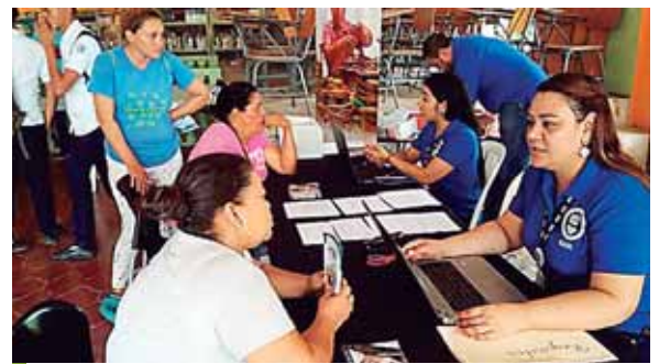
Foto de Archivo: Microempresarios de San Lorenzo, Valle reciben asistencia técnica de la SAR.

“El propósito es generar un espacio de respuesta inmediata de manera conjunta para la formalización, a través de la asistencia técnica y legal, a la micro y pequeña empresa”, puntualizó el funcionario.