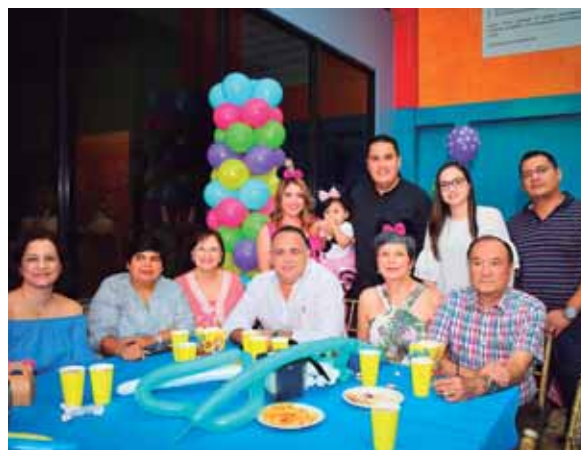
El matrimonio Rodríguez junto a los demás familiares que llegaron a la celebración.