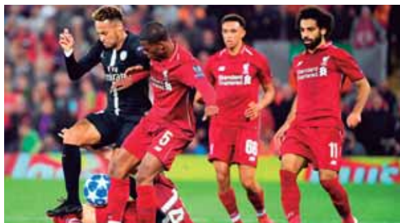
Neymar batalló ante un Liverpool que demostró que va de nuevo con su objetivo de llegar a la final.

La Champions tiene un toque especial y si Leo lo dice como lo dijo el día del Gamper, más. Los últimos años no han sido los mejores en la competición. Tenemos ganas pero también en la Liga y en la Copa del Rey". Rakitic, Barcelona