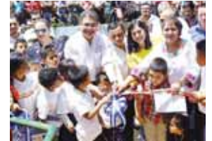
Hernández inauguró ayer un centro básico en Intibucá.

“La inversión que viene en dinero y en otro tipo de recur-