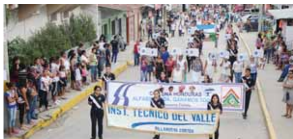
Los jóvenes y las personas alfabetizadas recorrieron las principales calles de Villanueva hasta llegar al parque central.