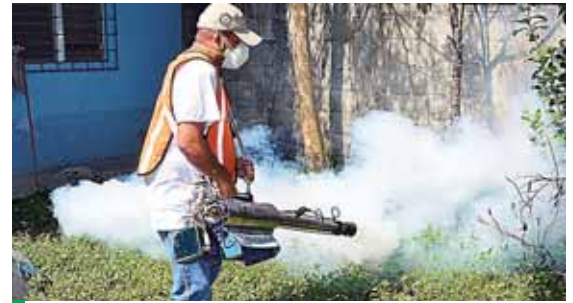
Los operativos inician hoy y continúan mañana. Los promotores de salud esperan alcanzar a unas 900 viviendas.

Amelia es una antropóloga estadounidense que está haciendo un estudio en el país. “Estoy enfocada en la situación de los deportados, documentar un poco cuáles son los efectos de haber pasado por el sistema de detención y deportación de Estados Unidos y cómo se vuelve a acoplarse o no a la vida acá”, dijo.