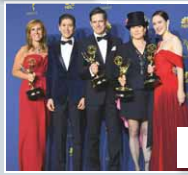
Los ganadores de la desconocida serie “La maravillosa señora Maisel”.