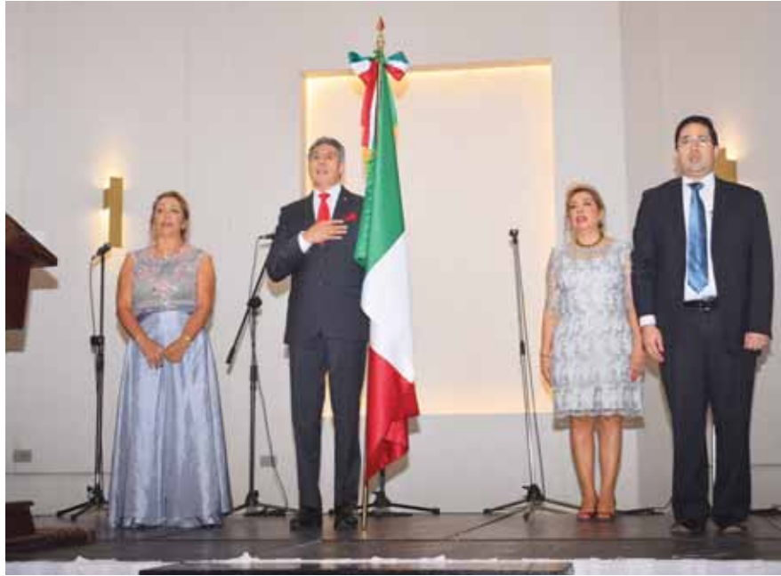
Momento cuando se entonaban las sagradas notas del himno de México!