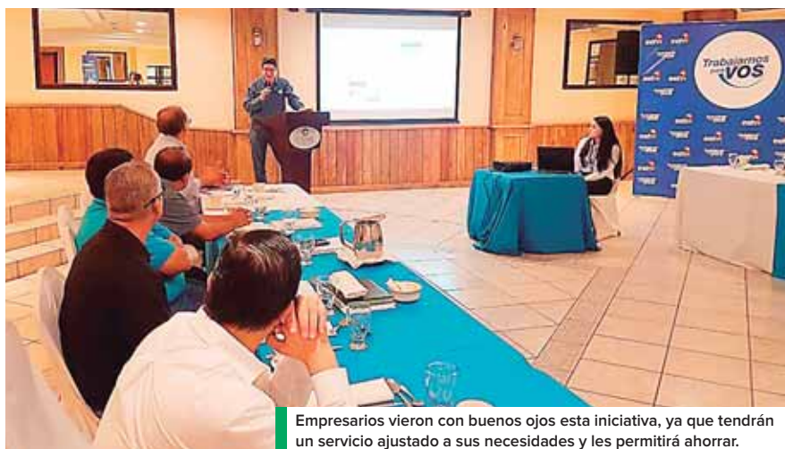
Empresarios vieron con buenos ojos esta iniciativa, ya que tendrán un servicio ajustado a sus necesidades y les permitirá ahorrar.

"Con ese acceso verificarán día con día y podrán observar en qué horas tienen mayor consumo, cómo está sincronizado el consumo con su proceso productivo a las medidas del caso. El portal lo que muestra es acceso al equipo