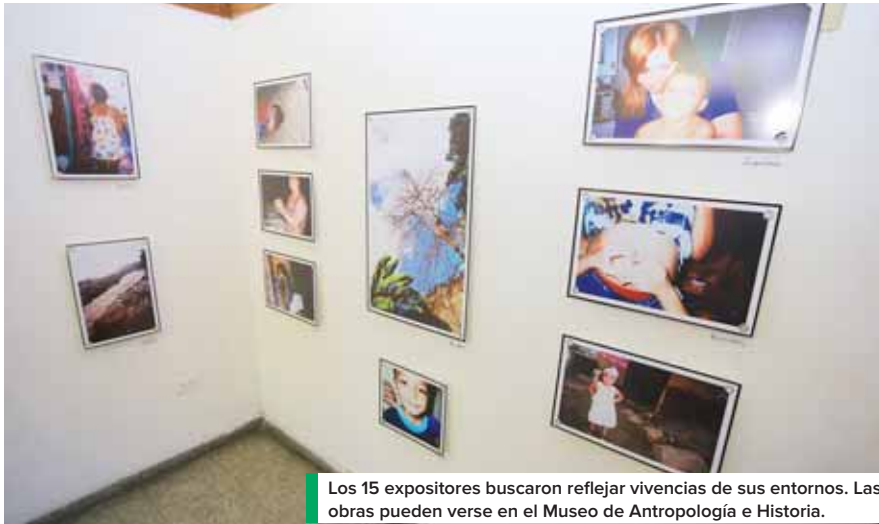
Los 15 expositores buscaron reflejar vivencias de sus entornos. Las obras pueden verse en el Museo de Antropología e Historia.