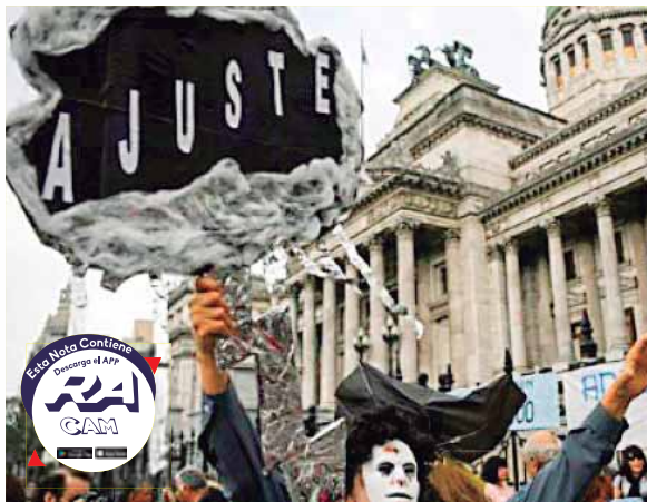
Los jubilados protestaron el 17 de setiembre en Buenos Aires contra los planes de austeridad fiscal del gobierno argentino.

brío fiscal es un objetivo central de la política económica de este gobierno”, afirmó Dujovne.