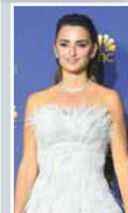
La elegancia de Penélope Cruz desbordó en la alfombra roja de los Emmys.