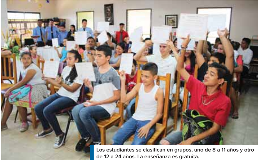
Los estudiantes se clasifican en grupos, uno de 8 a 11 años y otro de 12 a 24 años. La enseñanza es gratuita.