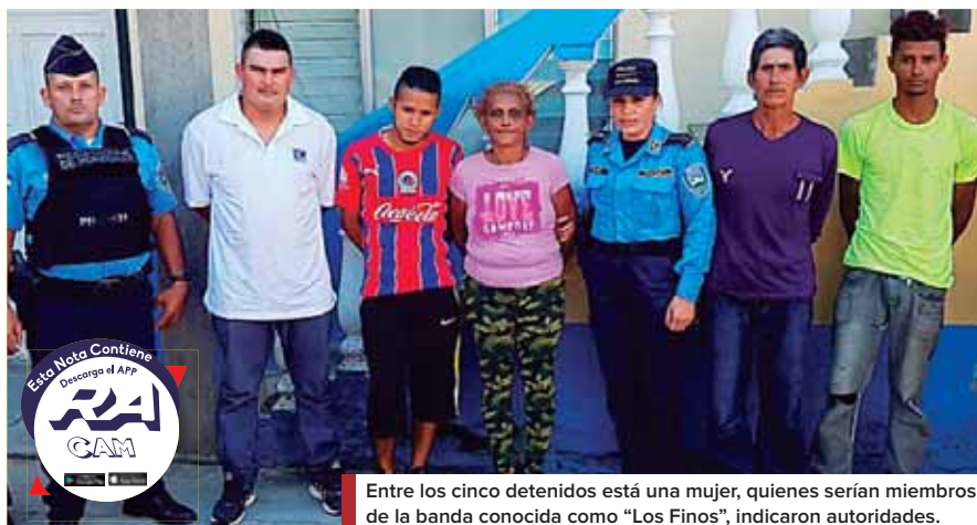
Entre los cinco detenidos está una mujer, quienes serían miembros de la banda conocida como "Los Finos", indicaron autoridades.