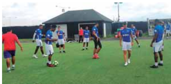
Los jugadores entrenaron la tarde de ayer en la capital estadounidense y esta noche enfrentan al DC United.