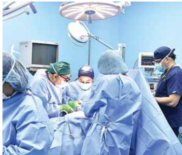
En el hospital Leonardo Martínez realizan constantemente brigadas quirúrgicas, por lo que la mora está en cero, según sus directores.

Los miembros de World Surgical Foundation son, en su mayoría, médicos retirados que buscan apoyar a países de escasos recursos, por lo que desde hace 14 años visitan Honduras y, desde hace dos años, están trabajando en coordinación con el Leonardo Martínez Valenzuela.