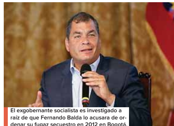
El exgobernante socialista es investigado a raíz de que Fernando Balda lo acusara de ordenar su fugaz secuestro en 2012 en Bogotá.

El sector privado se pronunció un día después de que los sindicatos de trabajadores públicos aceptaran iniciar un diálogo con el Gobierno, con mediación de la Iglesia católica, pero sin suspender la huelga iniciada el 10 de septiembre. AFP