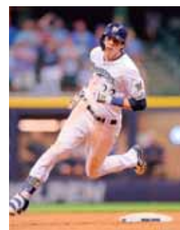
Christian Yelich de Milwaukee con una buena temporada.