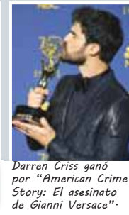
Darren Criss ganó por “American Crime Story: El asesinato de Gianni Versace”.