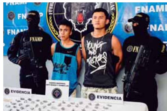
A los capturados se les encontró supuestamente marihuana y 300 lempiras que serían del cobro de extorsión.