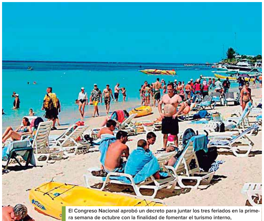
El Congreso Nacional aprobó un decreto para juntar los tres feriados en la primera semana de octubre con la finalidad de fomentar el turismo interno.

Indicó que el año anterior se cerró con una movilización superior a los 3.4 millones de turistas hondureños a lo largo y ancho del territorio, precisó. Dijo que la derrama económica superó los 3,000 millones de lempiras y este año la expectativa es que se superen esas cifras. “Creemos que se logrará pues se ha mejorado la conectividad terrestre que tenemos y también la oferta que está presentando el