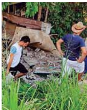
El producto fue recogido por empleados de la bloquera.

Al lugar se hicieron presentes empleados de la empresa bloquera para ver el estado de sus compañeros. También recogieron parte del producto que quedó en buenas condiciones.