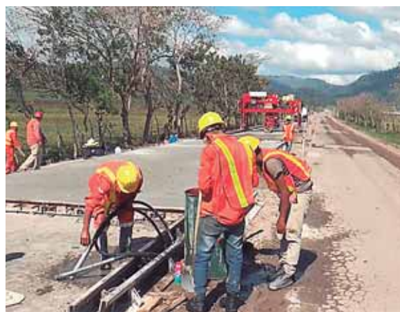
Los trabajos son con concreto hidráulico. Utilizan alta tecnología para garantizar una obra de calidad, dicen sus constructores.