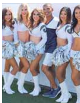
El linebacker de los Packers fue castigado ante Vikings.