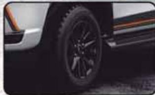
Rines de lujo