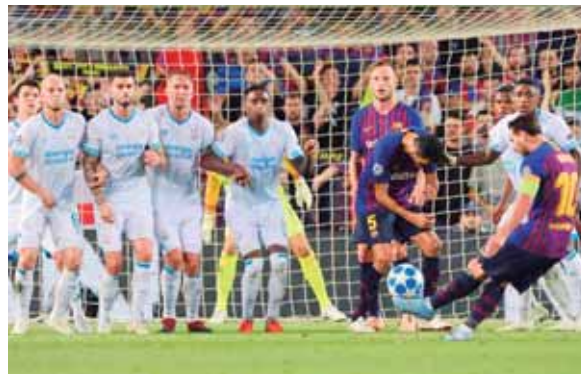
El primer gol azulgrana llegó a los 32 minutos luego de un lanzamiento libre ejecutado por el astro argentino.