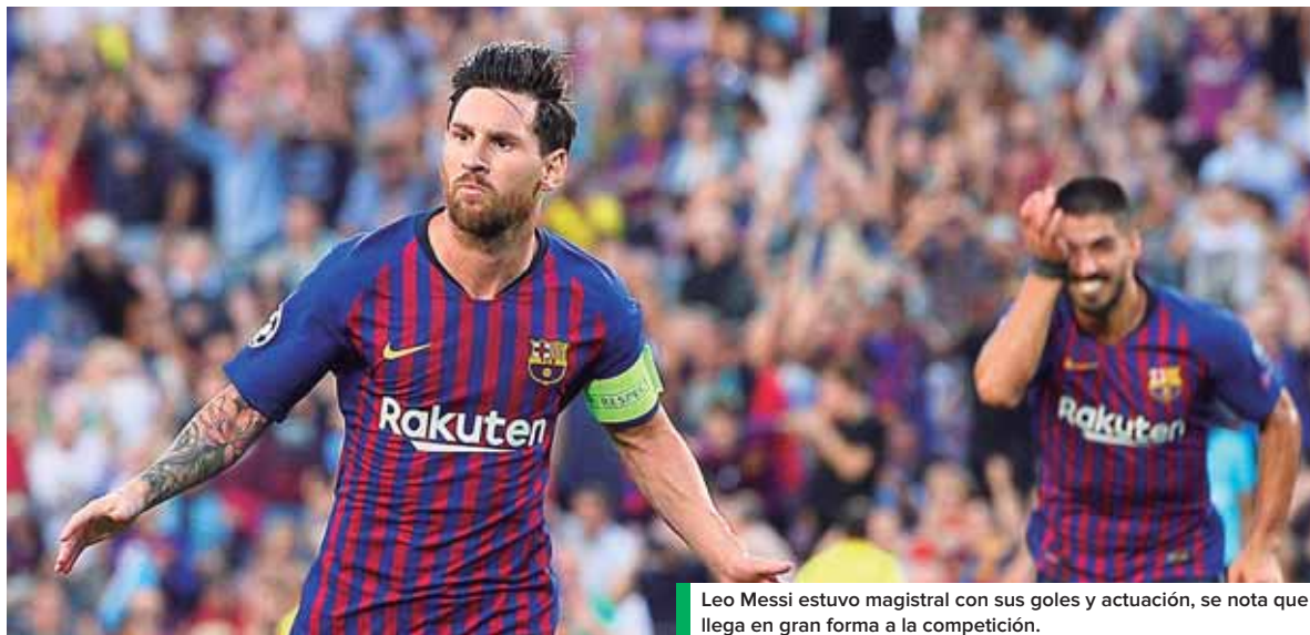
Leo Messi estuvo magistral con sus goles y actuación, se nota que llega en gran forma a la competición.