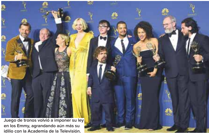
Juego de tronos volvió a imponer su ley en los Emmy, agrandando aún más su idilio con la Academia de la Televisión.