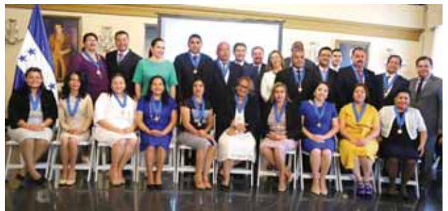
El presidente de la República y la primera dama junto a los homenajeados.