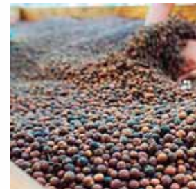
Honduras exporta 225 toneladas de pimienta gorda a Canadá.

En 2015 se concretó la primera exportación de 225 toneladas métricas a Canadá como un producto innovador.