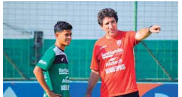
El jugador manifiesta que se quiere quedar en el Marathón, porque le tratan muy bien y se le da confianza, pero hay más ofertas.