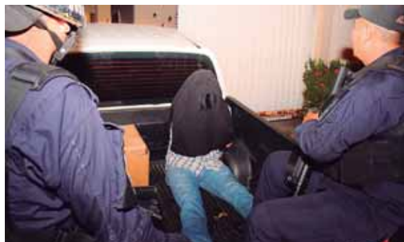
En la vivienda fueron rescatadas dos féminas y se le dio captura a un hombre como sospechoso.

Todos los acusados serán presentados a la Fiscalía de Turno para que respondan por los delitos que se les imputan.