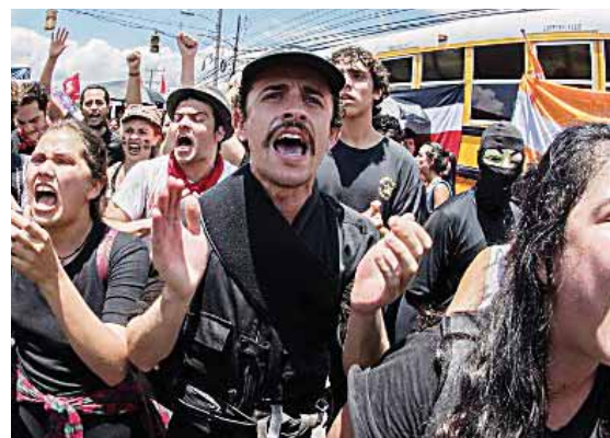
Las protestas han provocado bloqueos de carreteras y cierres en plantas de distribución de combustibles.