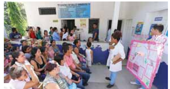
En la actividad participaron colaboradores municipales de la OMM, personal de salud y los estudiantes del área de salud de la UNAH-VS.

El funcionario indicó que visitarán casa por casa para eliminar el criadero de zancudo, abatir las pilas o cualquier recipiente donde almacenan el agua para finalizar con la fumigación y así evitar que se registren nuevos casos de dengue, zika y chikungunya.