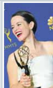
El Emmy a mejor actriz, fue para Claire Foy por “The Crown”.