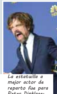
La estatuilla a mejor actor de reparto fue para Peter Dinklage.