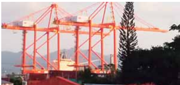
Las grúas Postpanamax son para cargar barcos "gigantes".

ra el viernes 21 de septiembre desde las 8:30 de la mañana. OPC ha informado que realizó inversiones cercanas a los 140 millones de dólares en la nueva infraestructura, en la adquisición de dos grúas Súper Post Panamax y un dragado de 14.5 metros.