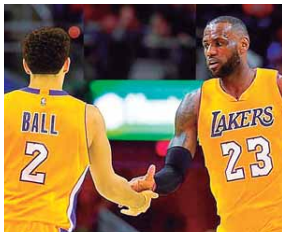
El 16 de octubre se pone en marcha la NBA, una de las ligas que mueve millones de dólares en los Estados Unidos.

la 2019-20 y en 143 millones de dólares en la 2020-21. Este curso 2018-19 marca un hito en la NBA al ser la primera vez que el tope salarial supera la barrera de los 100 millones. Exactamente, el techo de gasto en nóminas se coloca en 101.86 millones de dólares y el impuesto de lujo se va hasta los 123.73 millones de dólares. La 2016-17 estaba destinada a ser la primera de siempre en saltar por encima de los 100 millones en salarios, pero se quedó en 99 millones.