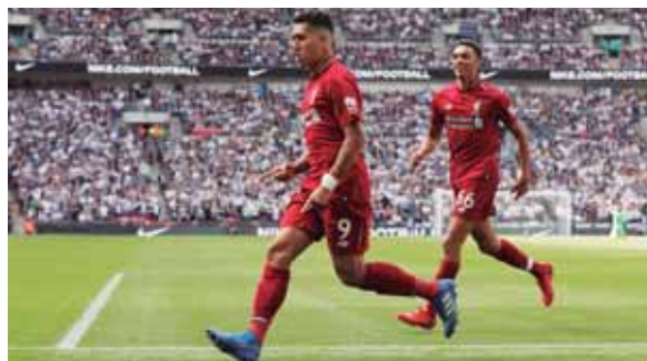
Cuando parecía que Liverpool-PSG terminaba en empate, apareció Firmino para conseguir el triunfo.

El Atlético de Madrid ganó 2-1 en el campo del Mónaco en su primer partido de Liga de Campeones, que tuvo que remontar tras empezar los locales por delante el marcador.