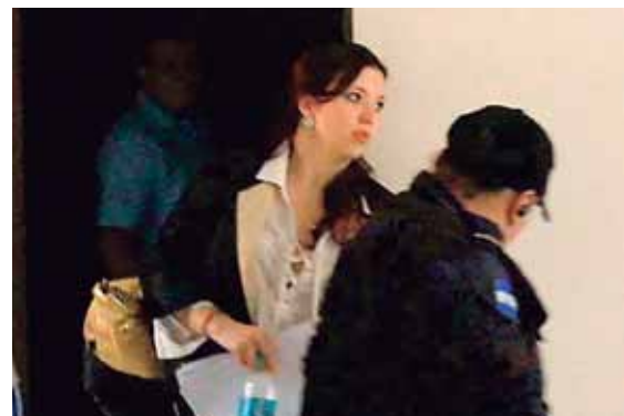
El juicio inició ayer en la Sala II del Tribunal de Sentencia sampedrano y se espera que finalice el próximo viernes.

Ambos serán remitidos al Juzgado correspondiente por suponerlo responsable de cometer el delito de extorsión continuada.