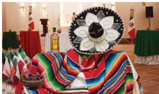
El salón Jerusalén estuvo engalanado para la ocasión.