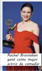
Rachel Brosnahan ganó como mejor actriz de comedia.

Mejor actriz de miniserie o película para televisión: Regina King, “Seven Seconds”.