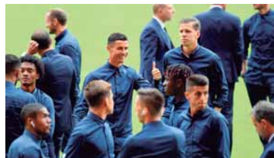
Cristiano Ronaldo es la gran atracción en su primer juego de Champions con la camisa de la Juve.

El legendario portero español Iker Casillas se convirtió en el primer futbolista en jugar 20 ediciones de la Liga de campeones del fútbol europeo al atajar en el partido que el Porto igualó 1-1 en su visita al Schalke. Casillas debutó en la Champions en la temporada 1999/2000 con la camiseta del Real Madrid. Con el equipo blanco conquistó tres veces el título, en 2000, 2002 y 2014, antes de fichar en 2015 por el Porto.