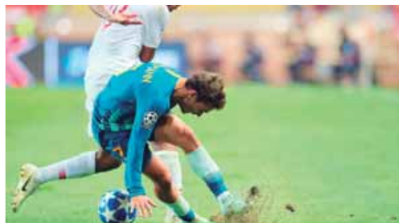
Atlético de Madrid se trajo la victoria de Mónaco y comienza a mostrar que va en serio por la Champions.