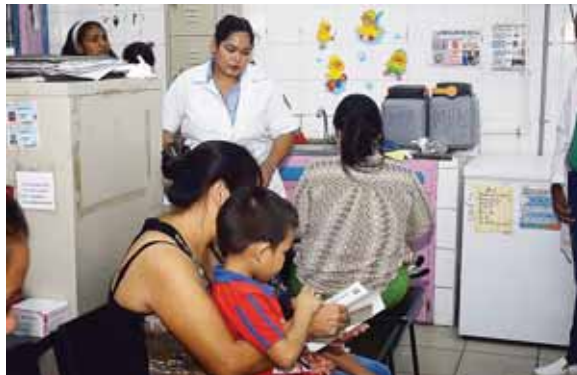
Si alguien tiene un niño de doce meses debe acudir a poner el esquema de vacunación en cualquier centro de salud.

Explicó que la primera dosis de vacunación se debe poner a los doce meses de nacido porque es una