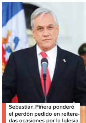
Sebastián Piñera ponderó el perdón pedido en reiteradas ocasiones por la Iglesia.

Chile, Australia, Irlanda y Estados Unidos son los países que sobresalen en ese escándalo que golpea a la Iglesia católica, por la sumatoria de denuncias de abusos sexuales por sacerdotes y otros religiosos.