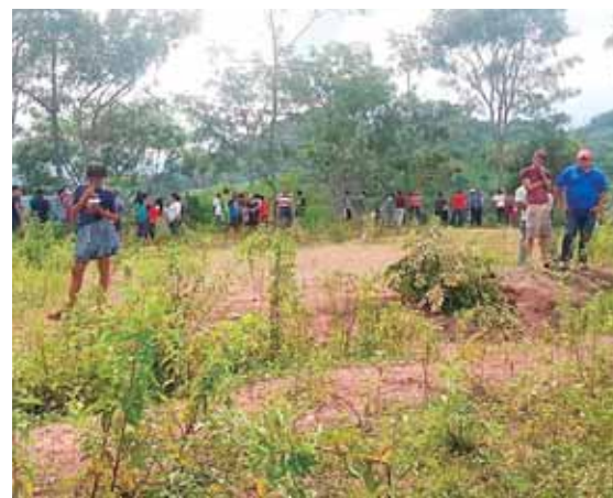
En este predio fue encontrado el cadáver del octogenario, el cual fue desenterrado por sus parientes.

"Es triste que a uno por ser pobre no le hagan caso y nos atiendan, sin importarles el dolor que sentimos al ver la forma en cómo mataron a nuestro familiar. Aquí es un castigo ser pobre", señalaron.