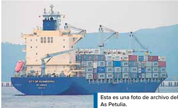
Esta es una foto de archivo del As Petulia.