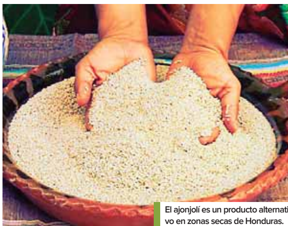
El ajonjolí es un producto alternativo en zonas secas de Honduras.

La meta inicial es producir 100 manzanas en Choluteca y 100 en el departamento de Lempira para