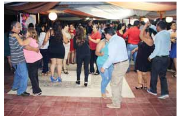
Los docentes disfrutaron de una cena, fiesta bailable y recibieron reconocimientos de la municipalidad.