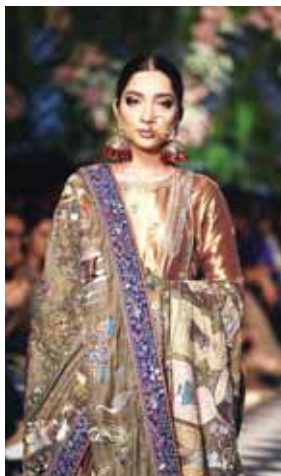
Niða utiliza solo telas puras, incluyendo lino irlandés, gasas, sedas tejidas a mano, encajes franceses, la'me y brocado.