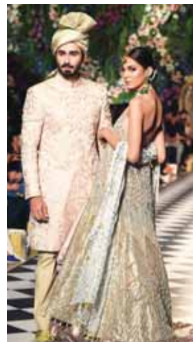
Los trajes para bodas que Niða elaboró en el Pakistán Fashion Design Council 2018.