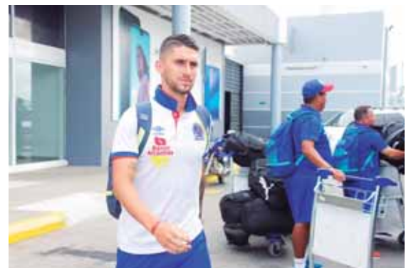
Los jugadores del club merengue a su llegada a San Pedro Sula, no dieron declaraciones.

Los merengues marchan invictos en el actual torneo y se ubican en el primer lugar de la tabla con 17 puntos de veintiún disputados.