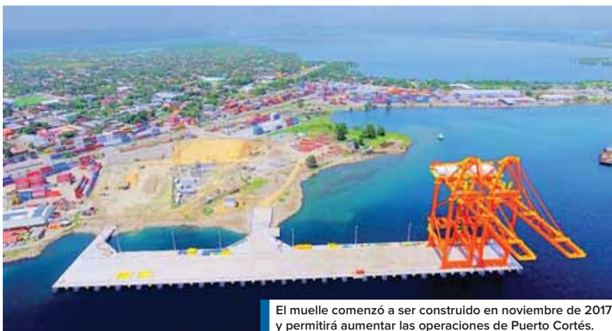
El muelle comenzó a ser construido en noviembre de 2017 y permitirá aumentar las operaciones de Puerto Cortés.

Sin embargo, antes de esa fecha se realizarán obras de construc-