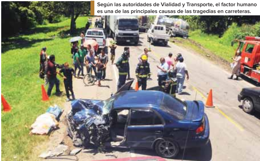
Según las autoridades de Vialidad y Transporte, el factor humano es una de las principales causas de las tragedias en carreteras.

Dijo que el problema ha crecido tanto que lo han estado analizando las diferentes autoridades, no solo las policiales sino en el seno del Consejo Nacional de Seguridad Vial con la participación de la sociedad civil y empre-