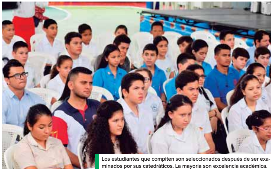
Los estudiantes que compiten son seleccionados después de ser examinados por sus catedráticos. La mayoría son excelencia académica.

cipan 240 alumnos. Comenzaron ayer y terminan este día, cuando se premien cuatro lugares: dos niveles de matemáticas y dos de español.