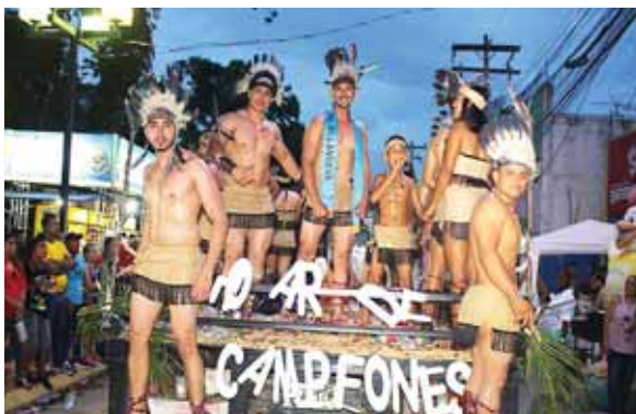
El género masculino también mostró sus encantos.

Los miles de "maduros" y visitantes que participaron de las festividades, quedaron satisfechos con el desarrollo de la Feria Agostina 2018.