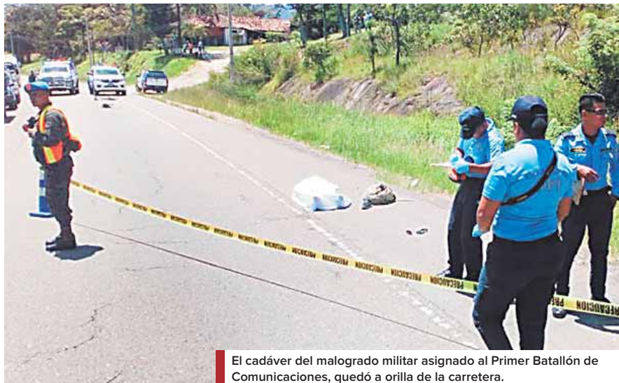
El cadáver del malogrado militar asignado al Primer Batallón de Comunicaciones, quedó a orilla de la carretera.