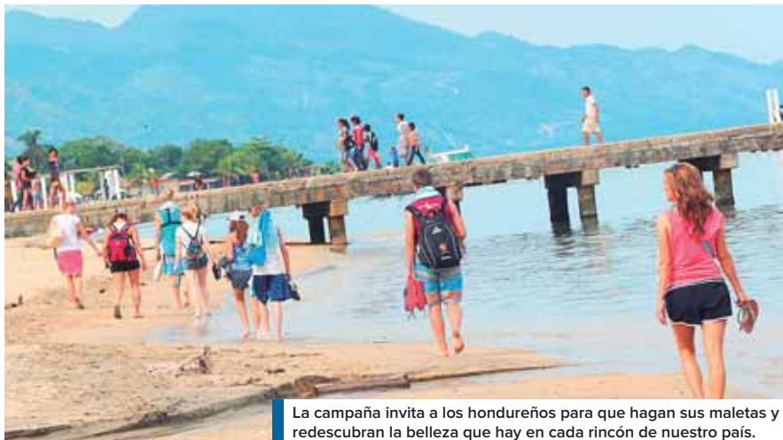
La campaña invita a los hondureños para que hagan sus maletas y redescubran la belleza que hay en cada rincón de nuestro país.