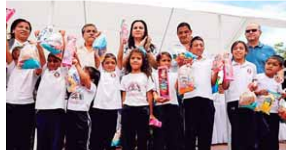
La primera dama adelantó que el gobierno construirá un Parque para una Vida Mejor a los niños de este municipio.

Un grupo de estudiantes de Medicina de la Universidad Nacional Autónoma de Honduras, se manifestó ayer a inmediaciones de Casa de Gobierno para exigir la apertura del servicio social. Son más de 300 alumnos los que se encuentran en lista de espera para cumplir ese requisito, previo a graduarse.