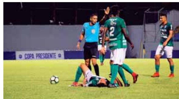
El partido fue muy friccionado. Fueron siete tarjetas amarillas para Marathón y dos para Real España.