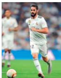
El volante es una de las principales figuras de la Roja.