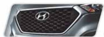
NUEVO DISEÑO FRONTAL