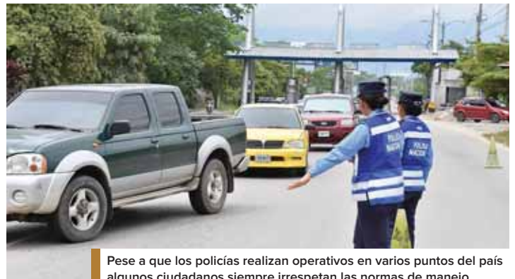
Pese a que los policías realizan operativos en varios puntos del país algunos ciudadanos siempre irrespetan las normas de manejo.