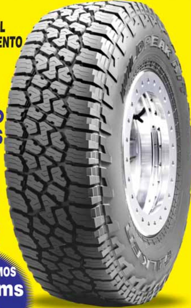
FALKEN WILDPEAK AT3W

1 Las Cabañas en Comayaguela Tels: 2237 8990 / 2220-4526 Cels: 32003278 / 9473-7228 ventasautollantas1@gmail.com