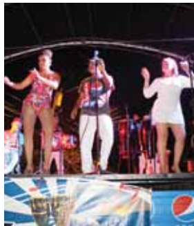
Los conjuntos musicales pusieron a bailar a la concurrencia del gran carnaval.

Entrada la noche, el espectáculo estuvo a cargo de varios conjuntos musicales, los cuales se instalaron en las principales calles de la ciudad, poniendo a mover las caderas