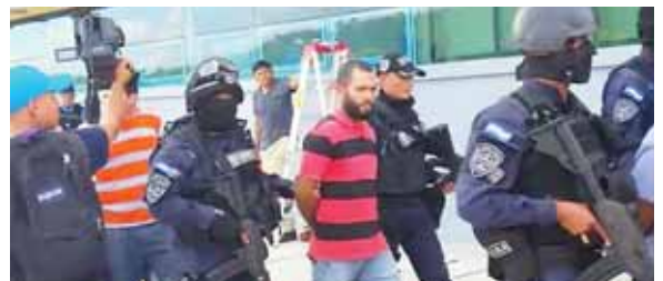
Nueve de los implicados serán enviados a "El Pozo" de Ilama, Santa Bárbara, mientras que tres mujeres tendrán un proceso diferente.