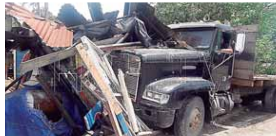
Afortunadamente el hecho no provocó pérdidas humanas, solo daños materiales, según el reporte policial.