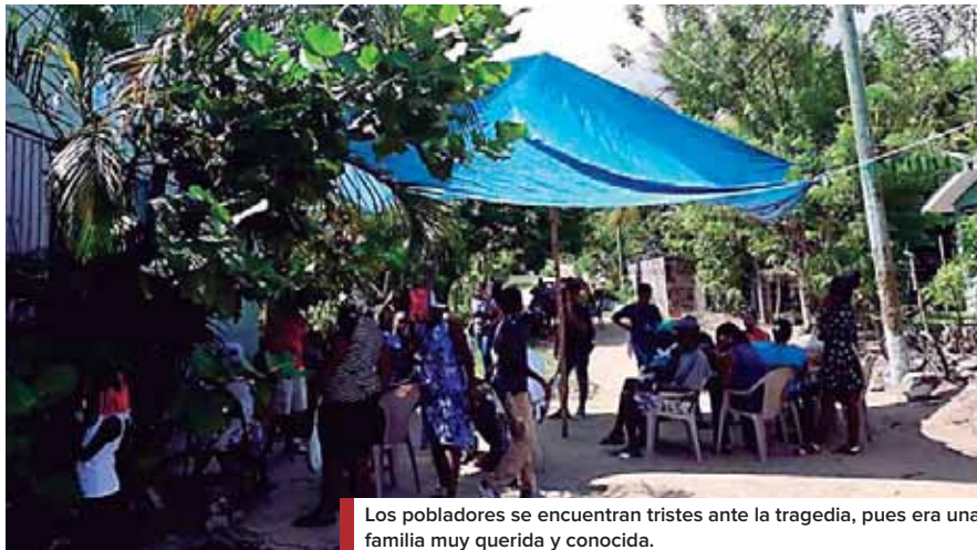
Los pobladores se encuentran tristes ante la tragedia, pues era una familia muy querida y conocida.