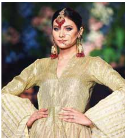
Una Linda combinación entre verde olivo y accesorios rojos.