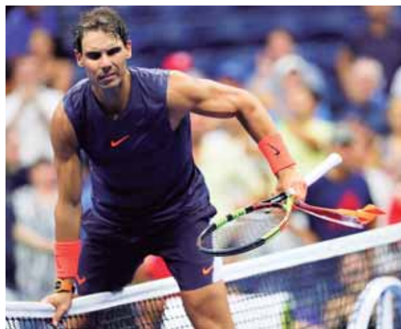
Rafael Nadal es favorito para ganar hoy, pero como rival tendrá a Del Potro que también ha mostrado que puede frenarlo.

El nivel no ha dejado de subir, pero Nadal prevalece del mismo modo que hizo ante Dominic Thiem en un épico encuentro de cuartos.