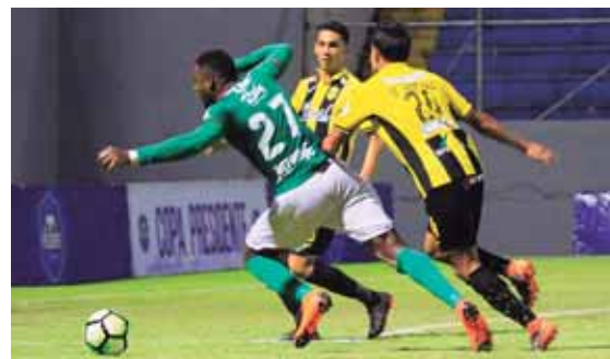
Se mira más claro el empujón hacia el goleador verde.