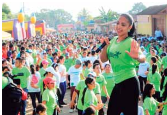
Las actividades del programa comenzarán desde la 7:00 de la mañana en los Parques para una Vida Mejor y en las plazas públicas.