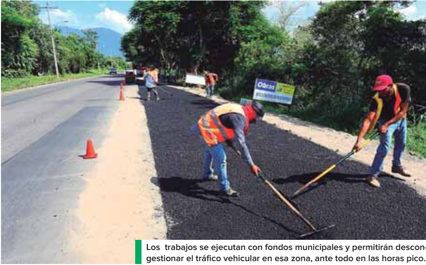
Los trabajos se ejecutan con fondos municipales y permitirán descongestionar el tráfico vehicular en esa zona, ante todo en las horas pico.