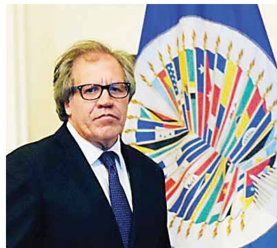
Luis Almagro, tiene como meta analizar la migración de venezolanos para los países vecinos.