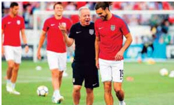
La selección de la barra y las estrellas ha perdido en 17 de las 18 ocasiones que se ha cruzado con la 'canarinha'.