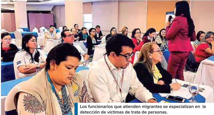
Los funcionarios que atienden migrantes se especializan en la detección de víctimas de trata de personas.