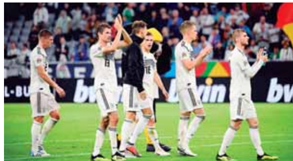
Los alemanes se mostraron satisfechos con el empate logrado ante Francia, considerando que es el actual campeón del mundo.