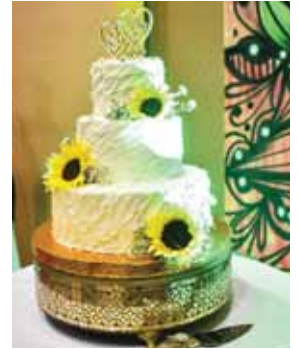
El exquisito pastel decorado con girasoles.