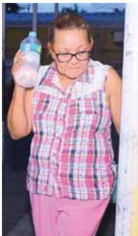
Continuará su investigación.