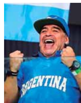
El Dorados separó su DT y se habla ahora del astro argentino.