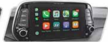
PANTALLA FLOTANTE LCD 7"