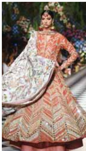
Niða se apega a las siluetas orientales, que siempre han sido su fuerte.