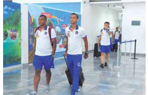
Olimpia arribó en el aeropuerto Ramón Villeda Morales.