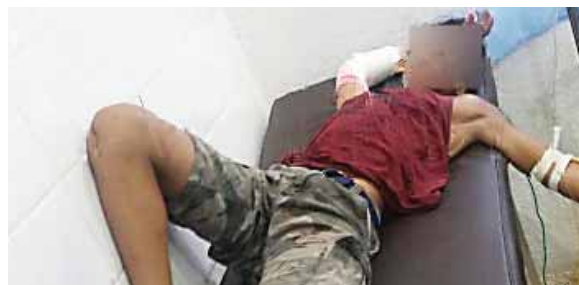
Al joven herido lo trasladaron hasta La Ceiba, en un intento por salvarle la existencia.