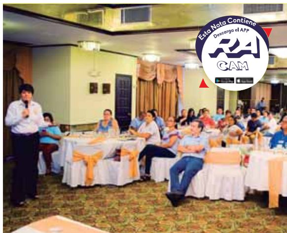
El 2 de septiembre se conmemora el Día del Migrante. Los jóvenes son los principales viajeros de modo irregular.

La Universidad Pedagógica Nacional Francisco Morazán (UPNFM) es una de las instituciones que siempre ayuda para que se lleven a cabo las olimpiadas. También hay una editorial que contribuye con material para los exámenes y la evaluación.