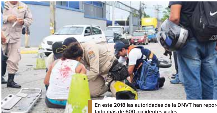
En este 2018 las autoridades de la DNVT han reportado más de 600 accidentes viales.

De manera, que urge tomar medidas, de lo contrario, la muerte seguirá rodando en carreteras y enlutando hogares.