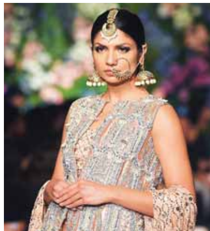
Toda la ropa y prendas de vestir creadas bajo la etiqueta de Niða Azwer están meticulosamente trabajadas a mano en Pakistán.