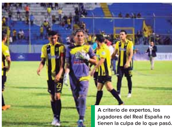
A criterio de expertos, los jugadores del Real España no tienen la culpa de lo que pasó.