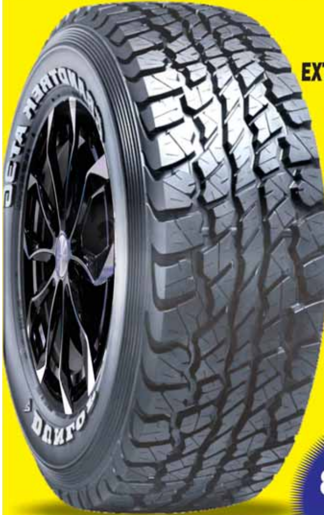
DUNLOP GRANDTREK AT3G

RECORRIDOS DENTRO Y FUERA DE CARRETERA TECNOLOGIA 100% DEL JAPON