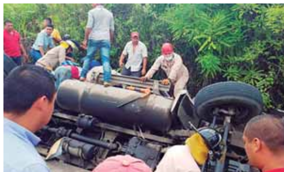
Producto del volcamiento, la rastra quedó con las llantas hacia arriba en una cuneta.

Tras el accidente algunos vecinos se llevaron a sus casas el abono.