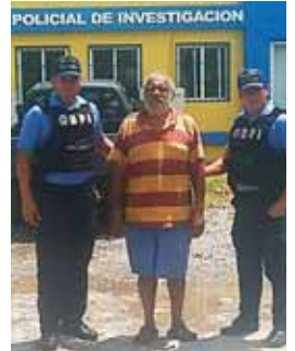
El detenido es acusado por un testigo protegido.