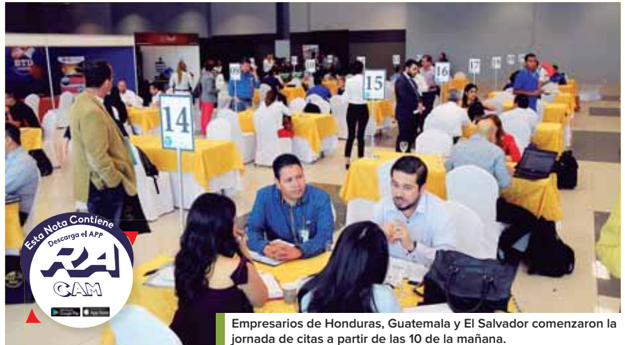
Empresarios de Honduras, Guatemala y El Salvador comenzaron la jornada de citas a partir de las 10 de la mañana.