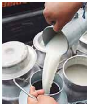
En mayo se aprobó la importación total de leche en polvo.

esos instrumentos, ya sea por plazo o tipo de sector de donde proceden, de acuerdo al experto. Los montos mínimos son variables, en este caso, se podría mencionar que en lempiras, en transacciones bancarias pueden ser hasta L50,000, dijo. En el caso de los dólares u otra moneda extranjera montos pueden ser de hasta $3,000, es decir, es bastante flexible, según Maradiaga. Las tasas de interés oscilan por el plazo, pero se puede hablar también de rangos, comentó. En los plazos menores, entre un rango de 6.60% en lempiras y en dólares entre un 4.75% hasta un 5% anualizado, expresó.