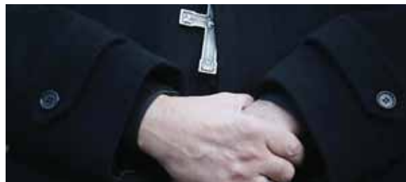
La Fiscalía anunció la creación de una línea directa para que víctimas o testigos hagan denuncias sobre abusos sexuales.

“El informe del gran jurado de Pensilvania arrojó luz sobre los actos increíblemente perturbadores y depravados del clero católico, ayudados por una cultura de secreto y encubrimientos en las diócesis. AFP