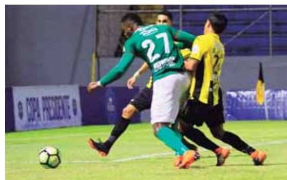
Según la gráfica, Borjas hace contacto con Justin con el brazo izquierdo.