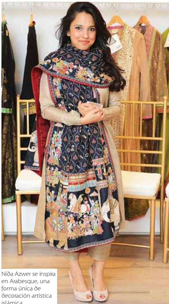
Niða Azwer se inspira en Arabesque, una forma única de decoración artística islámica.