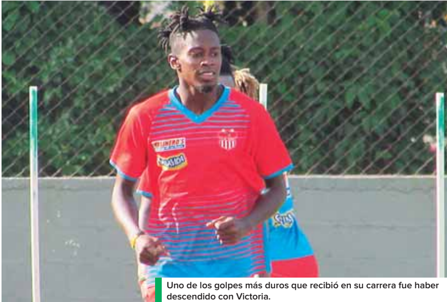
Uno de los golpes más duros que recibió en su carrera fue haber descendido con Victoria.