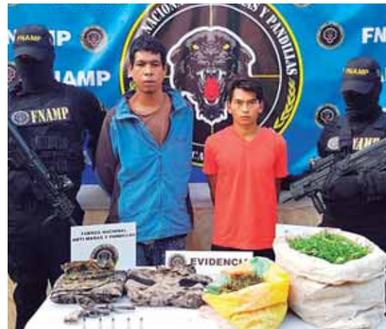
Al momento de la captura se les encontró en poder de más de 10 libras de supuesta marihuana que tenían en sacos.

También para esperar que lleguen sus familiares a identificarlo.