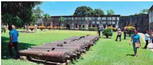
Los hondureños pueden acudir en familia a muchos lugares históricos, como la Fortaleza de San Fernando en Omoa.

gresos en los destinos y comunidades visitadas, a través de una comunicación estratégica efectiva y objetiva de promoción creativa e innovadora que permita penetrar en nuestros principales mercados y captar nuevos, logrando una mejor imagen de país, captación y familiariza-