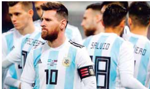
Scaloni dejó fuera en esta convocatoria a los históricos Messi, Angel Di María y Sergio Agüero, tras el fracaso en el Mundial.