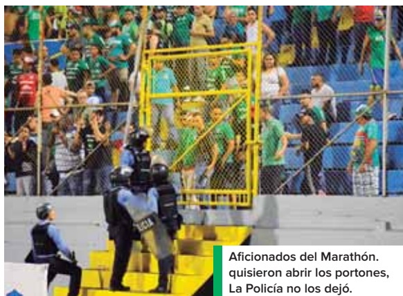
Aficionados del Marathón quisieron abrir los portones, La Policía no los dejó.