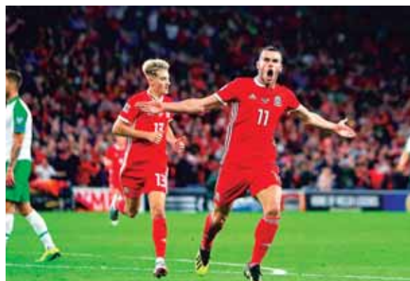
Gareth Bale comandó al país de Gales a una victoria muy amplia sobre Irlanda. El jugador del Madrid va en ascenso.