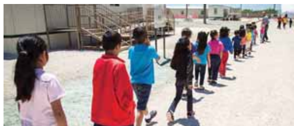
Muchos huyen de la violencia en Centroamérica, especialmente del llamado Triángulo del Norte (El Salvador, Honduras y Guatemala).

ESTADOS UNIDOS. El Gobierno de Estados Unidos dio ayer un primer paso para modificar el acuerdo que regula la detención de migrantes menores de edad, presentando un proyecto de reglamentación, que fue inmediatamente rechazado por los defensores de los derechos humanos.