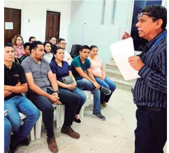
En lo que va del año 580 parejas han recibido las charlas prematrimoniales que han sido impartidas por la alcaldía sampedrana.

Díaz manifestó que es una solución vial muy importante, porque se está creando una bahía exclusiva para los conductores que van de este a oeste, eliminando así el conflicto vial en ese sector de la ciudad, pues impedirá la formación de filas.