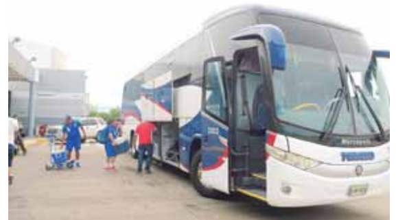
Olimpia clasificó a semifinales de la Copa Presidente y ya se concentra para el partido contra el Honduras Progreso.