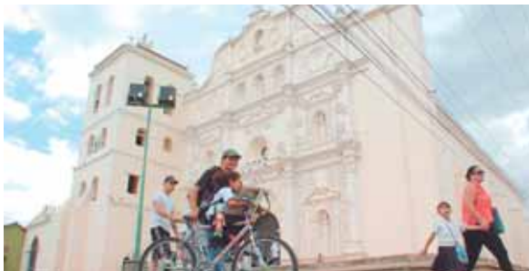
Las autoridades de turismo pretenden incentivar la afluencia de turistas para generar divisas en comunidades remotas.

Con esta campaña se pretenden incentivar la afluencia de turistas generando divisas y mejorando la distribución de los in-