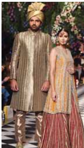
Durante el Pakistán Fashion Design Council 2018.

Inspirada en los antiguos bordados del interior de Sindh, ella reinventa meticulosamente puntadas como Hurmich, Seesha Tanka, Moti Tanka y Heera Tanka en organza y seda de alta calidad. Ella es una apasionada de garantizar la continuación de la artesanía, apoyando a un gran número de artesanos en Pakistán.