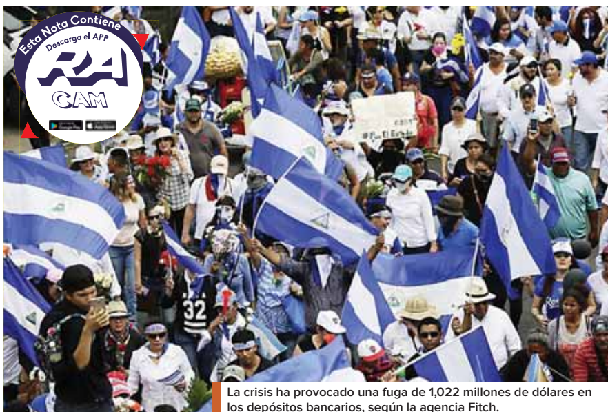
La crisis ha provocado una fuga de 1,022 millones de dólares en los depósitos bancarios, según la agencia Fitch.