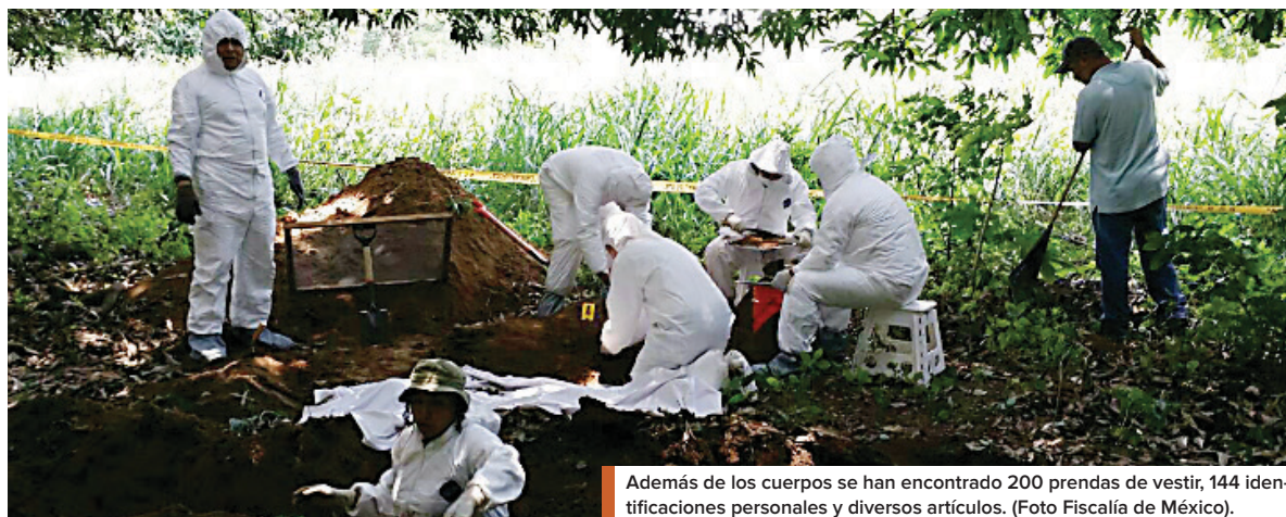
Además de los cuerpos se han encontrado 200 prendas de vestir, 144 identificaciones personales y diversos artículos. (Foto Fiscalía de México).

El gobierno de Ecuador acusó ayer al exmandatario Rafael Correa de haber gastado diez millones de dólares de fondos públicos para apoyar una campaña privada de indígenas contra la petrolera Chevron, condenada por daño ambiental.