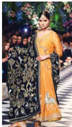
Ella es una apasionada de garantizar la continuación de la artesanía.