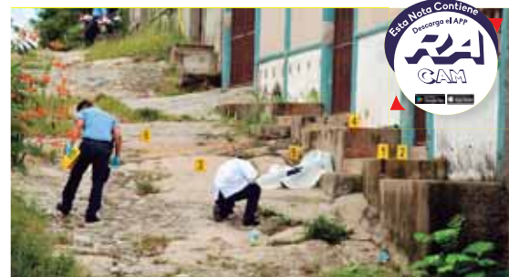
En la escena del crimen, agentes de Inspecciones Oculares de la DPI, encontraron varios casquillos.

Al lugar del percance se hicieron presentes las autoridades policiales, mientras que el motorista de la volqueta llegó a un acuerdo con los vendedores.