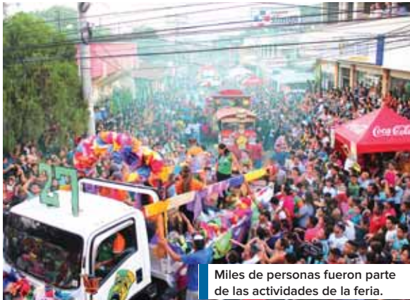
Miles de personas fueron parte de las actividades de la feria.