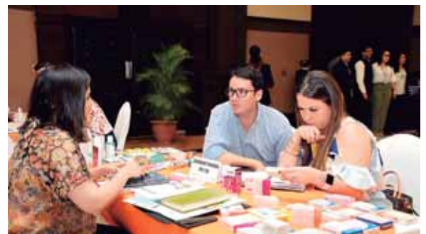
Inversionistas nacionales aseguran que los productos farmacéuticos de la India son de buena calidad y a precios cómodos.

Detalló que es uno de los 66 exportadores del mundo y comercia-