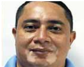
El agente de investigación estaba asignado en las oficinas de la DPI de San Pedro Sula.

Asimismo, Lara Bú ha dejado un enorme vacío en las aulas de clases de la Facultad de Derecho de la Universidad Nacional de Hon-