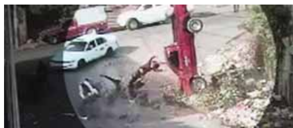
Afortunadamente el hecho no causó pérdidas humanas.

Tras el accidente, varios empleados de la Alcaldía, se acercaron para sacar a las personas que quedaron bajo el carro. Posteriormente, le dieron vuelta al vehículo que, tras la impresionante caída, quedó con las llantas hacia arriba.