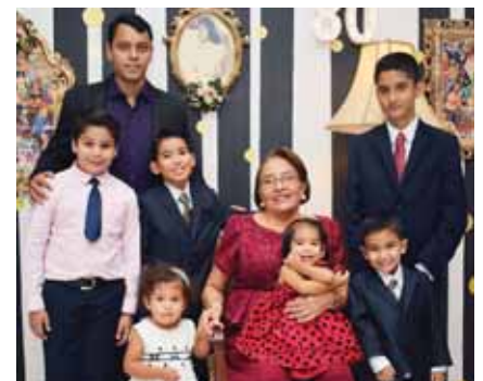
Los bisnietos acompañaron a su abuelita.