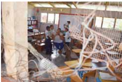
Las ventanas rotas dejan pasar la lluvia y el viento por lo que no pueden poner materiales en las paredes.