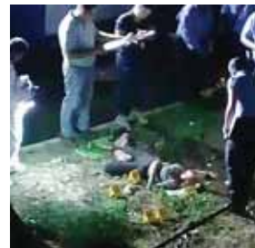
Otra fue encontrada sin vida en la colonia San Fernando con un rótulo "por sapa".

La fémina vestía, jeans oscuro, burros rosados y una camisa verde de acuerdo a vecinos a eso de las 8:45 de la noche escucharon tres disparos.