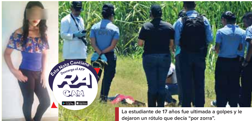
La estudiante de 17 años fue ultimada a golpes y le dejaron un rótulo que decía "por zorra".

Tanto su progenitora como hermana, recordaron que a eso de las 7:00 de la noche tuvieron la última