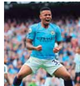
El brasileño dice que va a trabajar duro para seguir como titular en el City.

“El sábado fue Sané, pero en el futuro puedo ser yo u otros jugadores”.