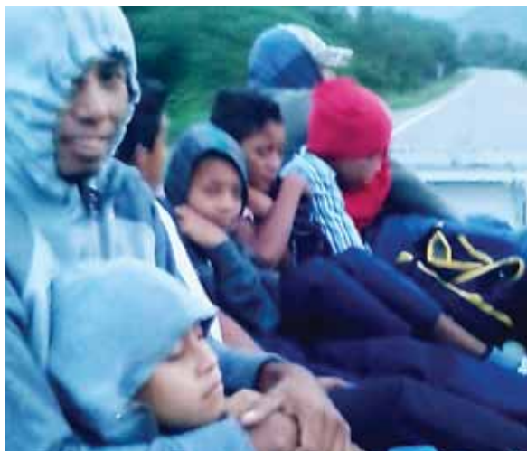
Para ir al Congreso Nacional viajaron en un "camioncito". Los docentes pagaron hotel para poder quedarse en Tegucigalpa.