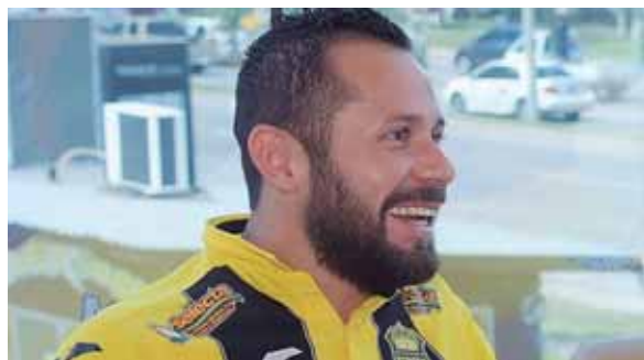
El capitán de la Máquina manifestó que este partido será el primer paso para salvar el fútbol de San Pedro Sula.