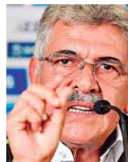
El DT dejó claro que no va a cobrar por dirigir al Tri.