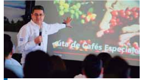
Hernández dijo que se busca dinamizar la economía.

Refirió que, junto a los otros distritos, de la Ruta del Sol y la Joya de los Lagos, el nuevo destino turístico permitirá fortalecer el occidente del país, “una región que tiene mucho que ofrecer, por la diversidad de recursos exis-