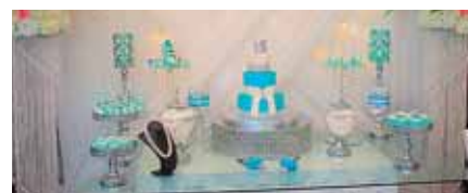
La estancia de dulces y pastelería que pudieron degustar todos los invitados a la especial celebración.