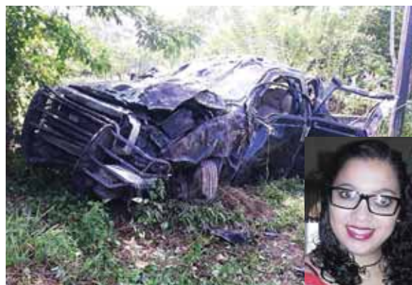
El pickup quedó completamente destruido tras el fuerte impacto, que dejó como saldo a una fémina muerta.

Los accidentes viales constituyen la segunda causa de muertes violentas el país según datos de la Dirección Nacional de Vialidad y Transporte (DNVT).