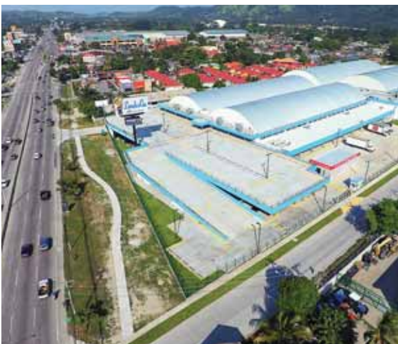
Está ubicada justo adelante del puente Río Blanco.

Honduras está creciendo. Todos los hondureños buscan comprar su solar, aunque sea de 200 o 600 metros, y poco a poco hacer las cuatro paredes de sus viviendas. Honduras crece.