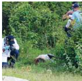
Esta menor de 17 años fue ejecutada en una colonia de Choloma, Cortés.