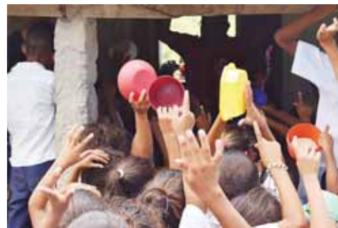
El fin de semana les entregaron bolsas solidarias con las que les prepararon su merienda escolar.