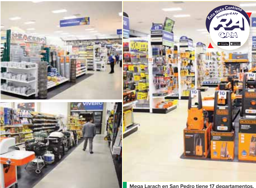
Mega Larach en San Pedro tiene 17 departamentos.