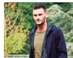
Courtois, Lloris y Kasper

En el rubro de arqueros, la FIFA informó que se encuentra el capitán y arquero francés Hugo Lloris, que luchará por el premio con el belga Thibaut Courtois, actualmente en el Real Madrid, y el danés Kasper Schmeichel, del Leicester City. También habrá un curioso premio para el mejor fan.