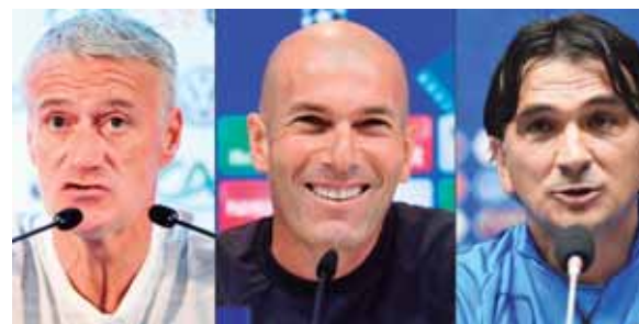
Entre los candidatos a mejor entrenador asoma Didier Deschamps, Zinedine Zidane y el croata Zlatko Dalic.