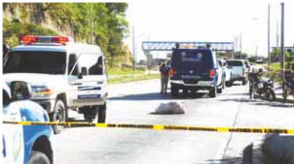
El hombre supuestamente fue ejecutado en una guarida de pandilleros y luego tirado en plena vía pública.