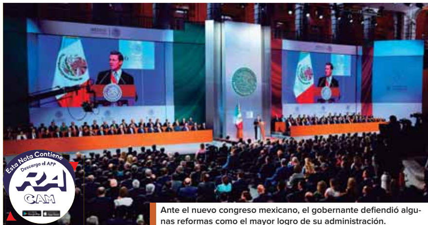
Ante el nuevo congreso mexicano, el gobernante defendió algunas reformas como el mayor logro de su administración.

Peña Nieto reiteró que dará seguimiento puntual a la negociación bilateral que se llevara a ca-