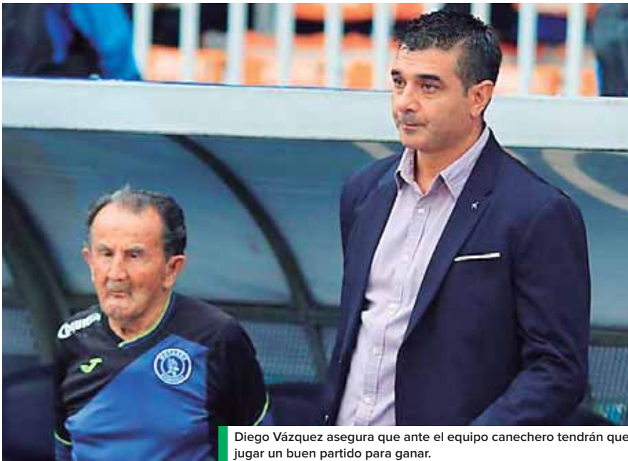
Diego Vázquez asegura que ante el equipo canchero tendrán que jugar un buen partido para ganar.