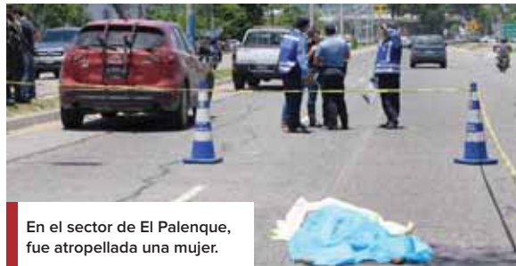
En el sector de El Palenque, fue atropellada una mujer.

También la noche del domingo pasado se reportó la muerte violenta de otra mujer quien fue encontrada en la colonia San Fernando, en las cercanías de un motel y le dejaron un rótulo "por sapa".