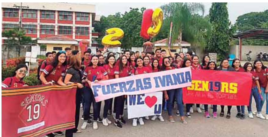
Los Seniors 2019 previo a su gran entrada a la institución.

Previo a llegar a las instalaciones de la escuela, los jóvenes degustaron un rico desayuno en el Restaurante Arnie's, al igual que compartieron un momento muy especial acompañados por sus padres.