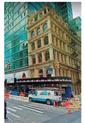
El accidente ocurrió en un edificio de Tribeca.

En algún momento, subió desde una ventana a la escalera de incendios para tratar de sacar su teléfono, pero perdió el equilibrio mientras intentaba abrir la ventana de la habitación cerrada, según los policías.