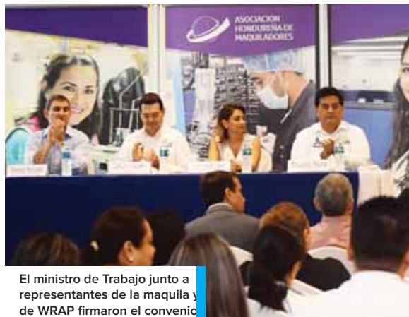
El ministro de Trabajo junto a representantes de la maquila y de WRAP firmaron el convenio

Las maquilas ya han comenzado una nueva fase de desarrollo al establecer plantas para proveer telas de hilo sintético, las que tienen un mayor valor