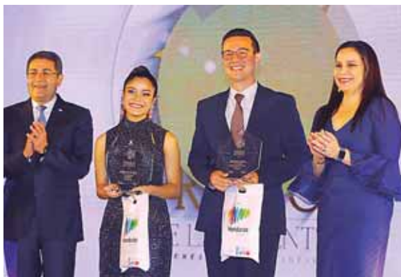
El presidente de la nación Juan Orlando Hernández junto a su esposa, en la entrega a dos de los galardonados a los Premios Juventud 2018.