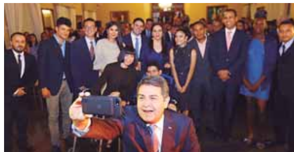
El presidente Hernández aprovechó el momento para tomarse una "selfie con los jóvenes".