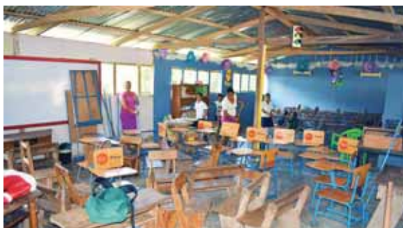
En los últimos dos días ha llovido por lo que ayer varias madres llegaron a limpiar una de las tres edificaciones.