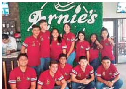
Los jóvenes pudieron disfrutar de un agradable desayuno en el reconocido Restaurante Arnie's.