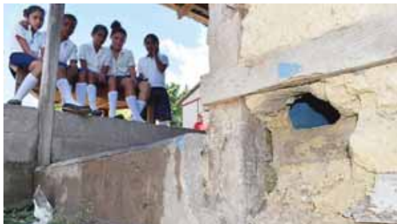
Las estructuras son de adobe. Este edificio fue construido por los padres y cada vez que llueve se va cayendo lentamente.

aproximadamente, dista Pueblo Nuevo desde San Pedro Sula. Eso equivale a más de cuatro horas de camino. La mitad de esa ruta es por calle de terracería.