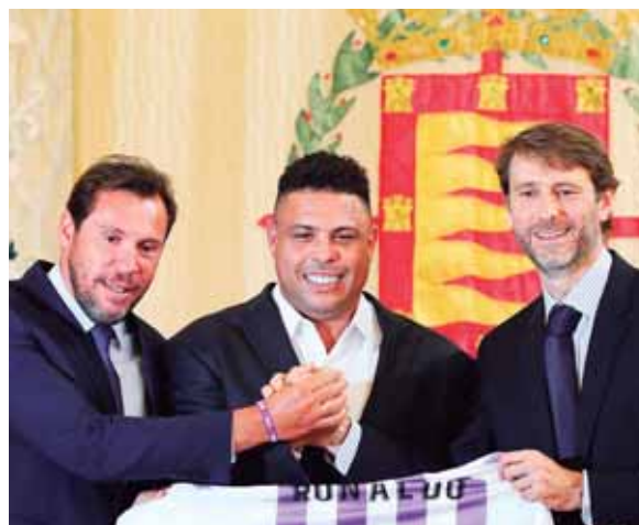
Retirado en 2011, conoce bien la Liga española con una temporada en el FC Barcelona (1996-1997) y otras cinco en el Real Madrid (2002-2007).