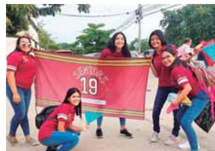
Las chicas posaron para Diario El País, durante su llegada a la escuela.