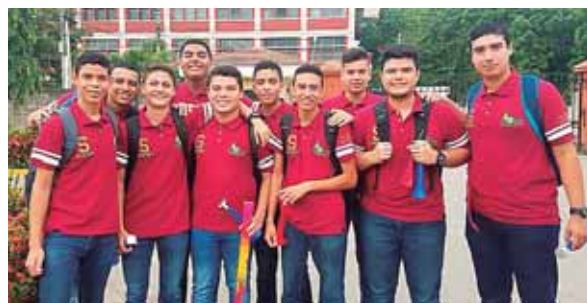
Los adolescentes guardaron un recuerdo memorable para este último año de estudio.