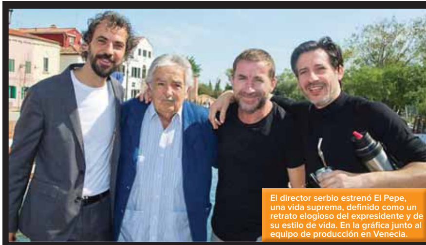
El director serbio estrenó El Pepe , una vida suprema, definido como un retrato elogioso del expresidente y de su estilo de vida. En la gráfica junto al equipo de producción en Venecia.