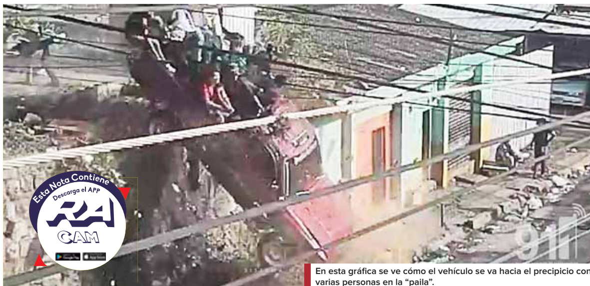
En esta gráfica se ve cómo el vehículo se va hacia el precipicio con varias personas en la “paila”.

tor se lleva una parte del muro y cae al vacío y varias personas salen “volando” a metros de distancia, pero al menos a cinco, el carro cae sobre sus cuerpos.