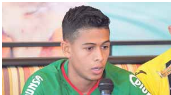
El jugador verdolaga prometió para mañana un buen espectáculo, para que los asistentes disfruten de un gran clásico.