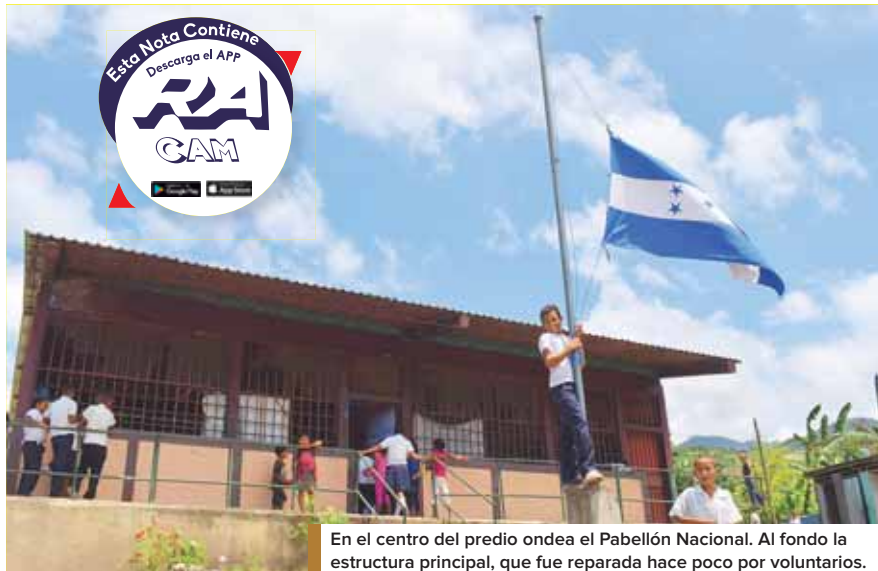
En el centro del predio ondea el Pabellón Nacional. Al fondo la estructura principal, que fue reparada hace poco por voluntarios.