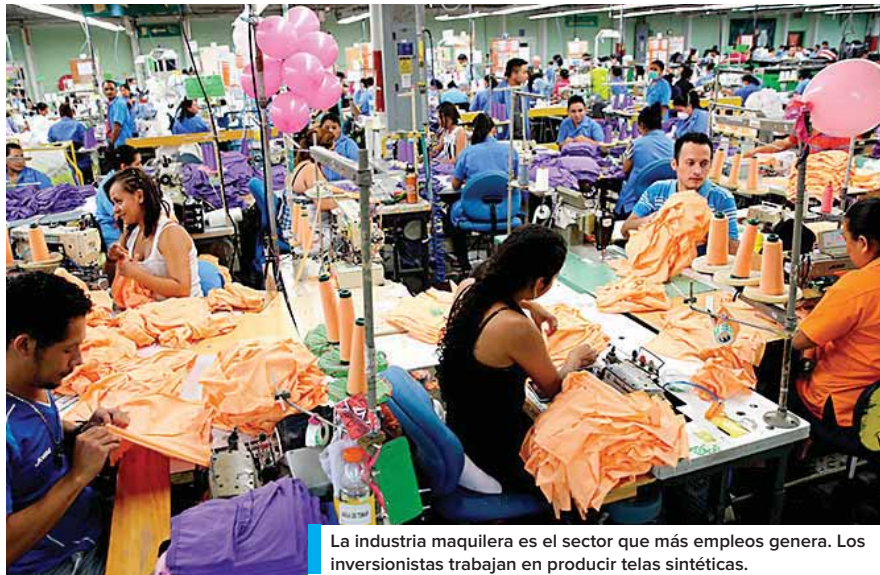
La industria maquilera es el sector que más empleos genera. Los inversionistas trabajan en producir telas sintéticas.

Comentó que falta poco para la apertura de algunos parques industriales que tiene que ver con fibra sintética y de ahí se hacen camisetas para deportes y otras prendas. Además la firma del convenio significa poder certificarse internacionalmente y es una muestra que se han mejorado los mecanismos que regulan las relaciones laborales y