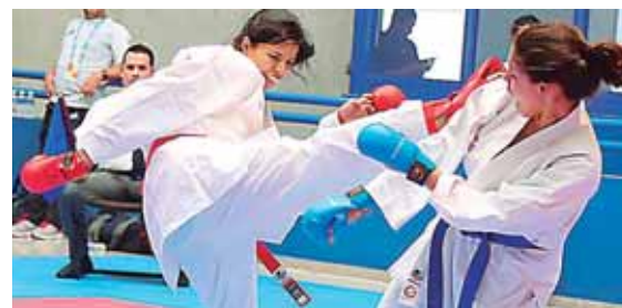
Los atletas esperan representar bien al país en estos juegos.

Atlético, Ajedrez, entre otras ya están listas. Cada deporte competirá en diferentes fechas. La delegación hondureña estará conformada por 324 personas de las cuales 307 son atletas.