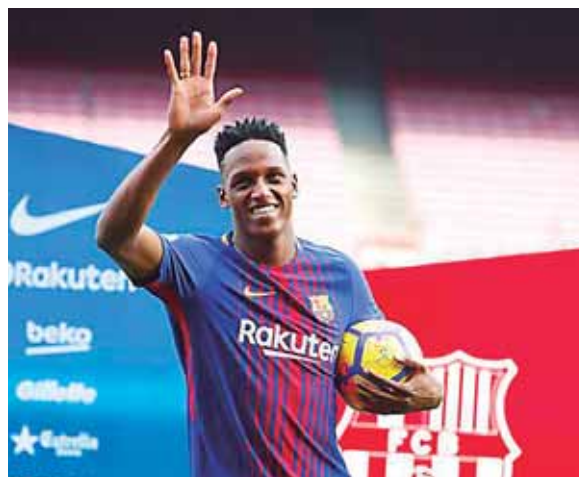
“Estoy tranquilo, que sea Dios quien obre en mi vida y que me lleve al lugar que quiera”, dijo Mina hace algunos días.

Ni siquiera la buena actuación del central en el pasado Mundial de Rusia con su selección, donde fue el máximo goleador con tres tantos, ha servido para que pueda seguir en el Barcelona, donde el técnico Ernesto Valverde, según la prensa española, no contaba con él para esta temporada.