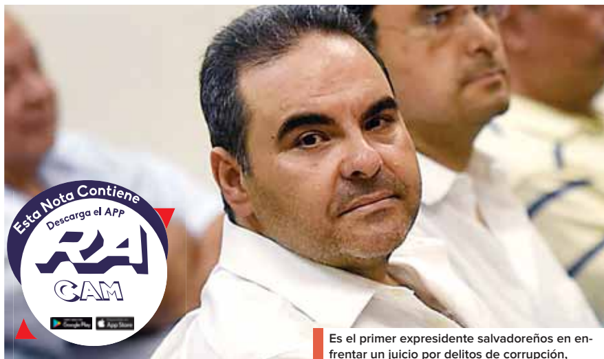
Es el primer expresidente salvadoreño en enfrentar un juicio por delitos de corrupción,

Añadió que para lavar el dinero pactó “sin licitación y de manera ilegal” con 3 agencias de publicidad el