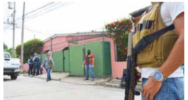
Esta vivienda de la colonia Trejo, que hace poco habían rentado los pandilleros era utilizada como centro de operaciones.