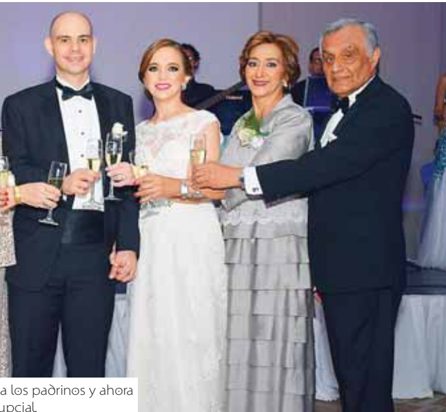
a los padrinos y ahora nupcial.