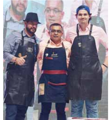
El jurado encargado de la evaluación de las competencias.

cinio de IHCAFE, AT Honduras, Hotel Real Intercontinental, Capitolio, De la Montaña Café, Café de Honduras y Copa Airlines.