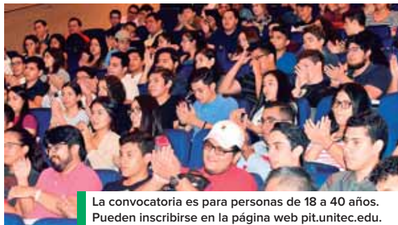
La convocatoria es para personas de 18 a 40 años. Pueden inscribirse en la página web pit.unitec.edu .