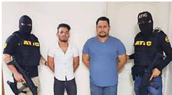
Durante la inspección a su negocio encontraron a menores de edad y varios cuartos en la parte posterior.

Según la Policía Nacional, varios individuos fuertemente armados, interceptaron el bus y al pararse, éstos se subieron y les robaron todo.