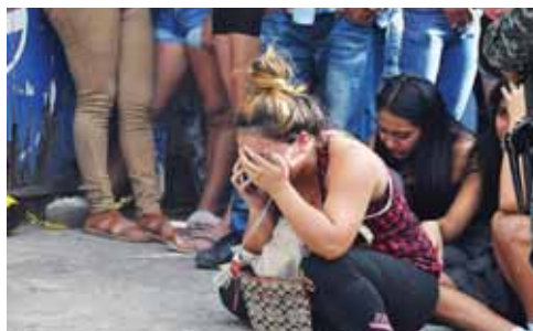
Hasta el lugar llegaron familiares del peatón quienes rompieron en llanto cuando confirmaron su muerte.