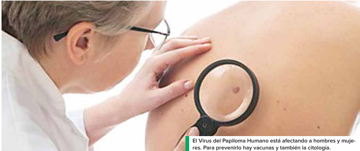
El Virus del Papiloma Humano está afectando a hombres y mujeres. Para prevenirlo hay vacunas y también la citología.

Este día la Agencia de los Estados Unidos para el Desarrollo Internacional y Fundación COHONDUCAFÉ tiene el honor de invitar al lanzamiento de alianza de cooperación. El evento se llevará a cabo a las 2:30 p.m., en el Salón Napoleón V del Centro de Convenciones del Hotel Copantli.