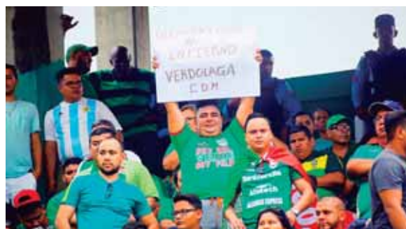
Tal y como lo señala este aficionado verdolaga, el Yankel se ha convertido en un auténtico "infierno" para los blancos.

na hacia el lado del Olimpia. Los verdes y los blancos se han visto las caras en 235 encuentros en Liga Nacional, 110 partidos fueron en el Nacional, 75 en el Morazán, 33 en el Olímpico, 11 en el Yankel Rosenthal, 4 en el Carlos Miranda y 2 en el Humberto Micheletti.