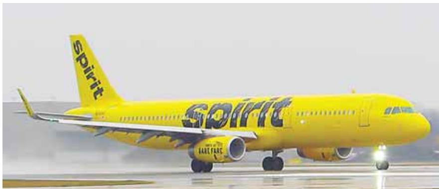
Cada avión que Spirit Airlines opera tiene un valor de 65 millones de lempiras.