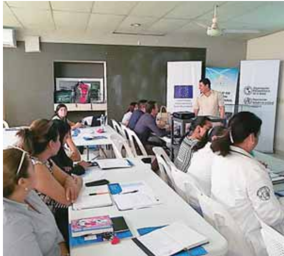
Los participantes pudieron generar un plan de acción para enfrentar la violencia de las zonas circundantes a los hospitales.

Al finalizar este evento los participantes pudieron elaborar un plan de acción que a su vez es una herramienta de gestión para que el hospital oriente acciones y den respuesta a posibles situaciones de violencia.