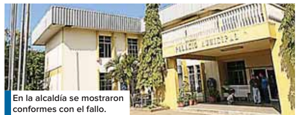
En la alcaldía se mostraron conformes con el fallo.