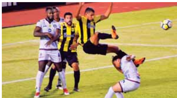
La realeza cayó 2-1 en el global y fue eliminado pese a empatar 1-1 emn el juego de vuelta de la Liga de Concacaf.