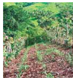
El cultivo en callejones se hace entre filas de árboles.

Hasta la fecha se han incorporado alrededor de 250 familias en las cuencas El Cangrejal y Cuevo Salado en el departamento de Atlántida.