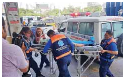
Uno de los heridos fue trasladado al HEU y el otro al IHSS. Ambos se encuentran estables.