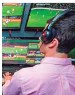
El Barcelona se medirá al Sevilla el domingo en Marruecos.