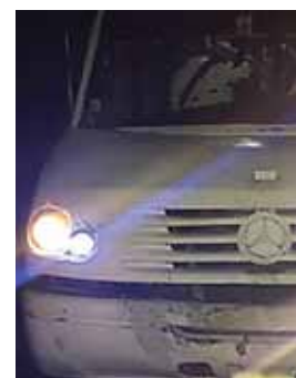
Las personas indocumentadas iban en bus y en otros carros para Estados Unidos.

En el operativo, en el que también participó personal del Instituto Nacional de Migración (INM), se detuvo a “54 de nacionalidad guatemalteca, un salvadoreño y tres hondureños, entre ellos, 22 menores de edad” y se arrestó a las dos personas que los trasladaban, precisó la CNS en un comunicado. AFP