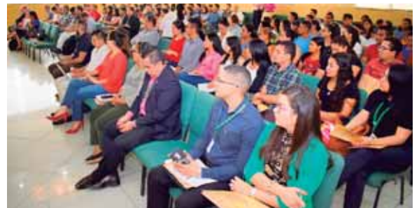
Los estudiantes de diferentes carreras aprovecharon las enseñanzas sobre la libertad en los mercados y las medidas de protección.

“Al mejorar la libre competencia, uno de los beneficios es la calidad de los productos y los precios tanto para los consumidores como para los empresarios”, puntualizó Ramos.