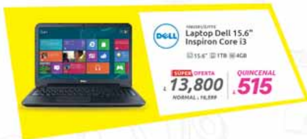
DELL Laptop Dell 15.6" Inspiron Core i3 15.6" 4GB

SUPER OFERTA $23,999 NORMAL $28,912 QUINCENAL $896