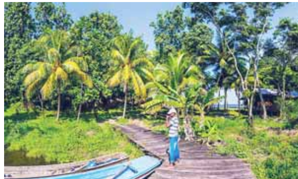
La modernización de La Mosquitia beneficiará a más de 200 mil personas con los múltiples proyectos que ejecutarán.

En cuanto al turismo, el presidente Hernández está promoviendo en otros países la Ciudad Blanca, de extensa zona de bosque tropical, que incluye la reserva de la biósfera de Río Plátano, que ha sido durante mucho tiempo el tema de diversas investigaciones multidisciplinarias y do-