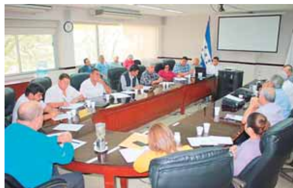
El titular de la SAG se reunió con productores de arroz para conocer sus planteamientos.

tamos haciendo un esfuerzo extraordinario como Gobierno para apoyar a estos productores”, apuntó. Agregó que, de existir la modalidad de asociatividad a través de cajas rurales en las zonas afectadas, se buscarán los esquemas para poner a disposición fondos blandos para el financiamiento de estos pequeños productores. El titular de la SAG pormeno-