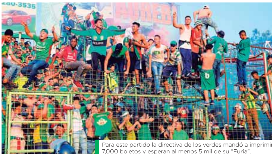
Para este partido la directiva de los verdes mandó a imprimir 7,000 boletos y esperan al menos 5 mil de su "Furia".

le ha anotado Yustin Arboleda en el Yankel Rosenthal. Es la gran pesadilla de los albos.