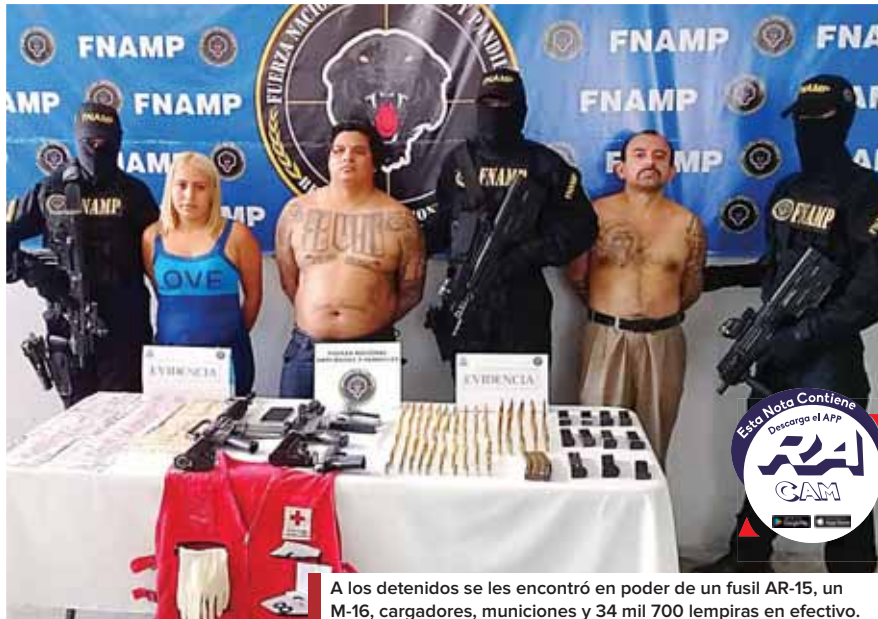
A los detenidos se les encontró en poder de un fusil AR-15, un M-16, cargadores, municiones y 34 mil 700 lempiras en efectivo.

De acuerdo a lo informado por la FNAMP "El Yónster" o "Ráfaga" se hacía pasar como médico cirujano, ya que portaba un carné del Hospital Mario Catarino