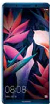
HUAWEI Celular Huawei Mate 10 Pro 4.0" 6GB 128GB 12/20MP

SUPER OFERTA $8,995 NORMAL $11,448 QUINCENAL $311