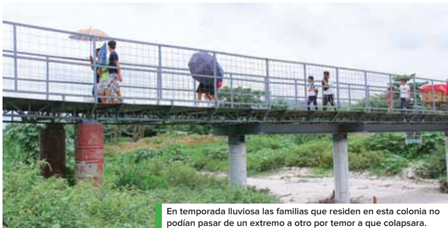
En temporada lluviosa las familias que residen en esta colonia no podían pasar de un extremo a otro por temor a que colapsara.