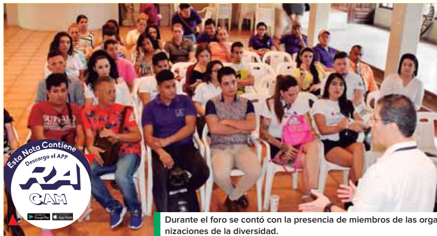
Durante el foro se contó con la presencia de miembros de las organizaciones de la diversidad.

“Queremos que cese la violencia hacia nuestras compañeras, ya que desde 2003 han muerto 309 miembros de la comunidad LGTB, por lo que se estima que a diario una o dos personas de nuestra comunidad son violen-