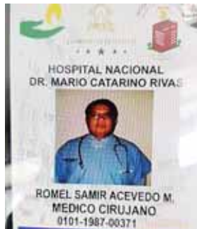
Este es el carné que portaba "El Yónster" o "Ráfaga".