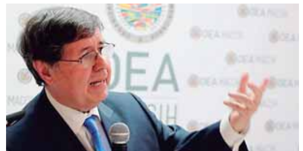
El vocero de la Macch tiene 38 años de carrera en el Ministerio Público de Sao Paulo, estado brasileño donde ocupó otros cargos.

hacer’. Tengo total libertad de acción. Estamos en plena condición de hacer el trabajo de la mejor forma posible”. Además, expresó su apoyo “irrestricto” al trabajo del Ministerio Público y de la Unidad Fiscal Especial Contra la Impunidad de la Corrupción, en especial en el “caso Pandora”.