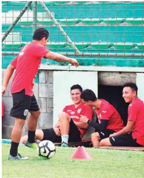
Los jugadores verdolagas trabajan pensando en dar una buena presentación el sábado en su estadio.

El plantel del Marathón en el entrenamiento de ayer se vio motivado y relajado de cara al clásico nacional.