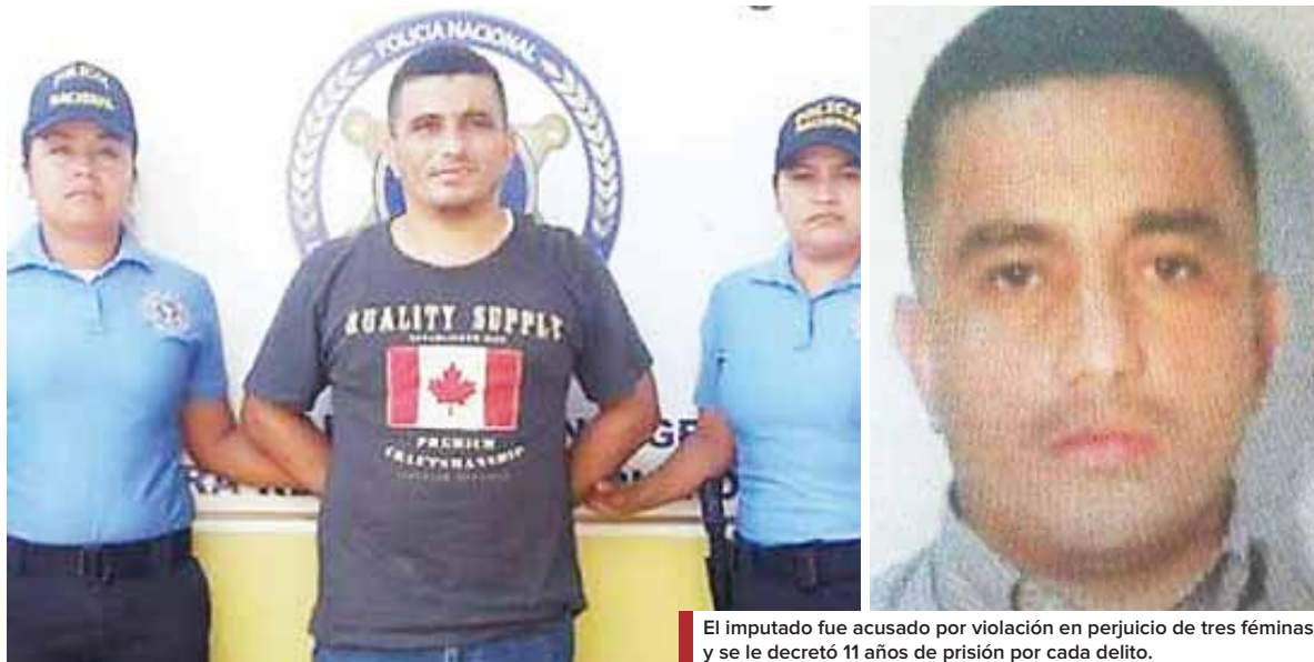
El imputado fue acusado por violación en perjuicio de tres féminas y se le decretó 11 años de prisión por cada delito.