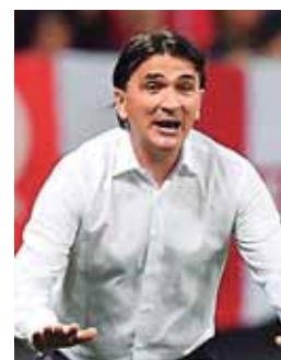
El entrenador llevó a Croacia hasta la final en Rusia.