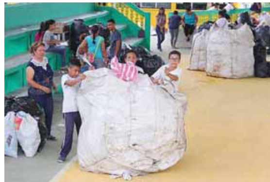
Los maestros y estudiantes participaron de la actividad con mucho ánimo, por lo que tuvieron un gran logro.