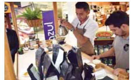
Welchez Café preparando su delicioso aromático.