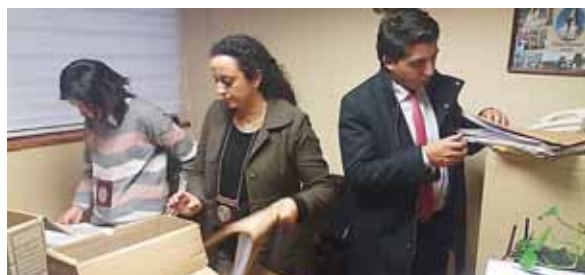
La policía realizó ayer un riguroso operativo en las oficinas del obispado castrense.