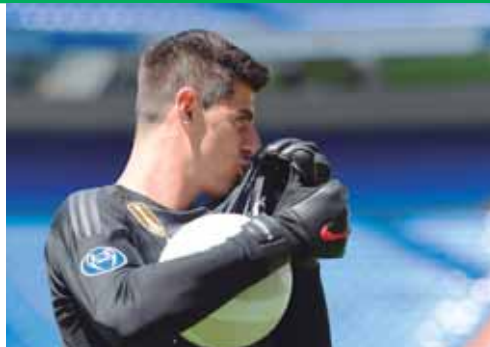
Cuando besó el escudo, emocionó a los aficionados.