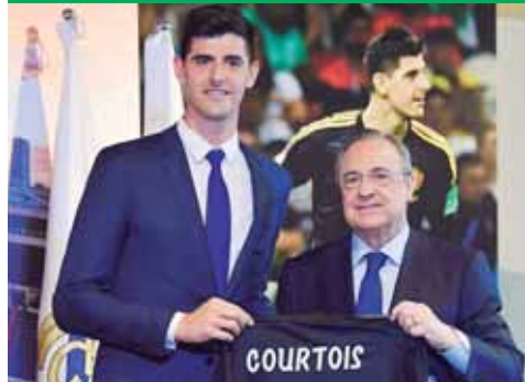
Florentino cumple sueño de llevar otro portero de élite.