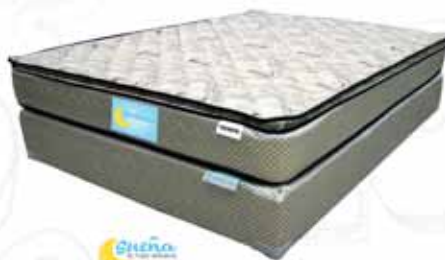
Chieffo Cama Queen Primavera

SUPER OFERTA $19,765 NORMAL $28,230 QUINCENAL $861