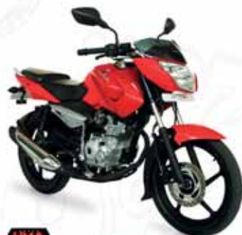
UMA Motocicleta Pulsar 135 RJ

SUPER OFERTA $13,800 NORMAL $18,899 QUINCENAL $515