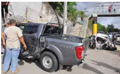
El pesado automotor se llevó de encuentro dos taxis, un pickup y una motocicleta.

No obstante manifestó que debido al control que hizo el conductor de la rastra sobre ella, evitó que la tragedia fuese mayor.