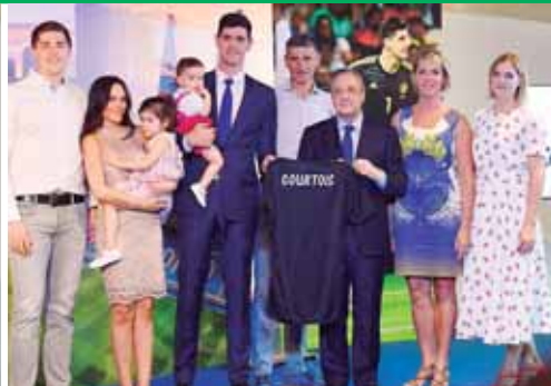
El arquero fue acompañado por sus familiares.