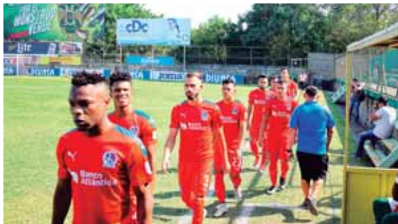
El último partido jugado entre ambos clubes en el Yankel se jugó el 11 de marzo de este año y terminó con un triunfo de 3-1 de los verdes.