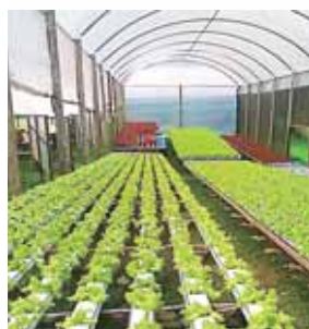
Los agroparques aumentarían las exportaciones en el país.