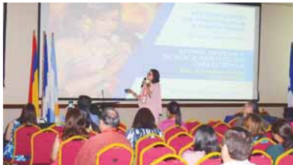
El XIV Congreso de Ginecología y Obstetricia se lleva a cabo todos los años y cada vez más expositores innovan con sus temas.

“El 70% de la población tiene el Virus del Papiloma Humano y no lo sabe. El problema es que este virus puede causar el cáncer en el cuello de la matriz. Por lo tanto, se deben tomar las medidas de prevención para reducir las cifras de este tipo de cán-