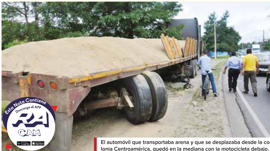
El automóvil que transportaba arena y que se desplazaba desde la colonia Centroamérica, quedó en la mediana con la motocicleta debajo.