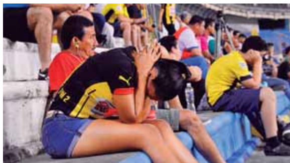
Los aficionados del Real España no podían creer lo que pasaba en el juego. Al final se fueron decepcionados por el resultado.