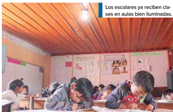
Los escolares ya reciben clases en aulas bien iluminadas.

Pineda, detalló que la inversión del novedoso proyecto es un mil 124