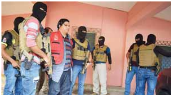
Después de varios minutos de pedirles que se rindieran y salieran, los agentes ingresaron a la vivienda de donde los sacaron.

Igualmente, a los pandilleros se les incautó dos cargadores para fusil AR-15, 11 cargadores para pistola calibre 9 milímetros, 240 proyectiles calibre 9 milímetros, 68 proyectiles calibre 5.56 milímetros, 12 puntas de cocaína, un teléfono celular y un chaleco de paramédico de uso exclusivo de la Cruz Roja Hondureña. Ese cuerpo de socorro aclaró que ninguno de los apresados forma parte de su personal.