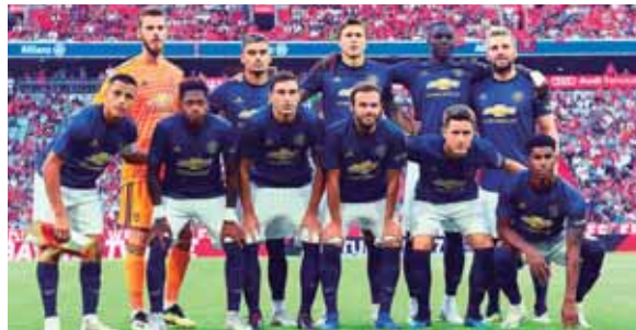
El Manchester United no abrió la chequera para hacer contrataciones de lujo en el mercado de fichajes.

El caso Paul Pogba tampoco contribuye a devolverle la sonrisa. Los dos hombres tienen una relación complicada, hasta el punto de que el campeón del mundo francés podría estar cerca de fichar por el FC Barcelona.