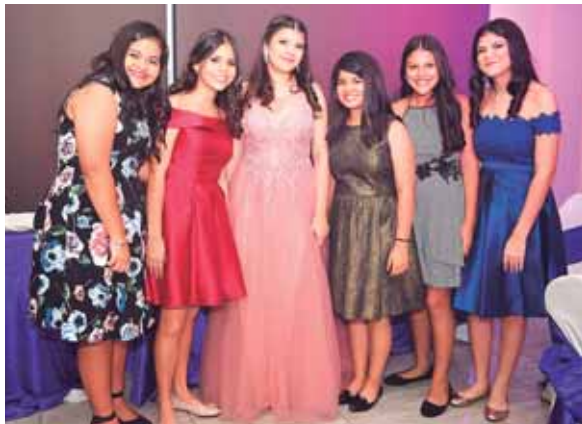
La cumpleañera acompañada de sus amistades.

La fiesta culminó hasta altas horas de la noche.