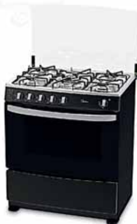
Midea Estufa a Gas 30" 5 Quemadores Negra

SUPER OFERTA $36,499 NORMAL $42,972 QUINCENAL $1028