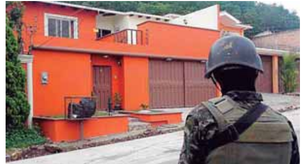
Dentro de los bienes devueltos están 10 viviendas en Tegucigalpa, así como propiedades rurales en Francisco Morazán y Olancho.