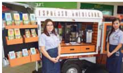
Espresso Americano presentó su variedad de café.

“En Multiplaza nos caracterizamos por ofrecer las mejores actividades de entretenimiento, es por ello que estamos muy contentos de presentar el Coffee Show Multiplaza en San Pedro Sula, para que nuestros clientes y visitantes puedan disfrutar de los diferentes sabores y presentaciones de una bebida tan deliciosa como lo es el café, es así como en este evento agradamos a la culturiza-