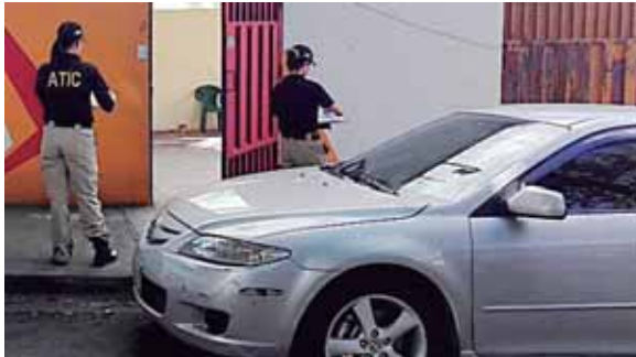
Una de las propiedades que no será devuelta es la conocida como “casa de Matta”, donde funciona la OABI en Tegucigalpa.

El abogado enfatizó que “nos devolvieron las 15 casas en la colonia Los Almendros, más el terreno ubicado en la colonia Lomas del Guijarro y los 750 mil dólares, que hasta los momentos llega por los intereses de 13 años”.