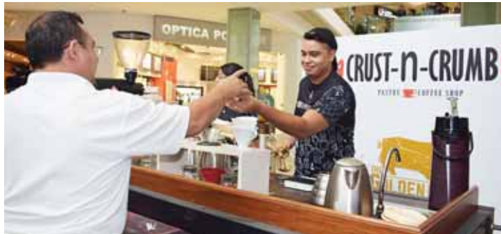
Los asistentes degustaron el café de Crust-N-Crumb.

Son cinco los coffee shops que están participando entre ellos; Tripartito, Espresso Americano,