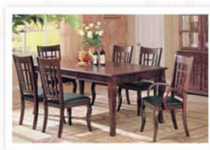
COASTER Juego de Comedor Newhouse 6 Personas

SUPER OFERTA $7,999 NORMAL $9,848 QUINCENAL $287