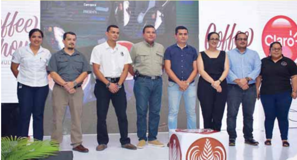
Representantes de las marcas patrocinadoras del “Coffee Show Multiplaza”.

Ejecutivos de Multiplaza y Claro lanzaron ayer la “I Edición del Coffee Show Multiplaza” en San Pedro Sula, el cual consiste en dos días de puro sabor y aroma a café, con el objetivo de fomentar el talento de los baristas nacionales y a su vez potenciar el delicioso cultivo que se produce en Honduras.