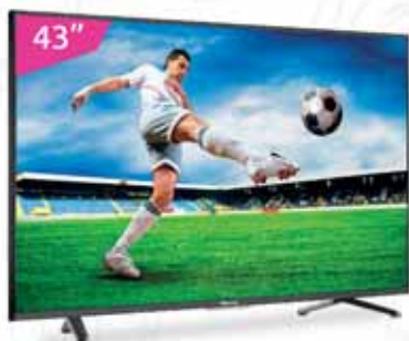
Hisense Smart FHD

Aplican Restricciones. Cuotas calculadas con 30% de prima. Cama y celulares a 24 meses, motos con 6% de prima a 48 meses.