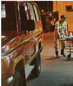
Al lugar llegó personal del Cuerpo de Bomberos.