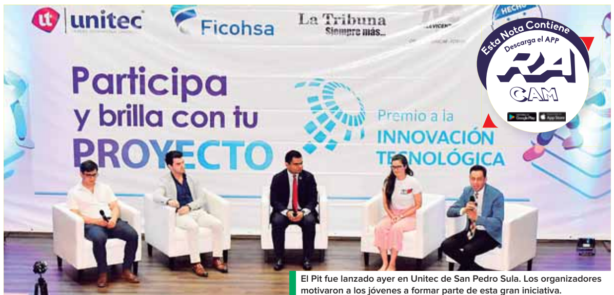
El Pit fue lanzado ayer en Unitec de San Pedro Sula. Los organizadores motivaron a los jóvenes a formar parte de esta gran iniciativa.

El coordinador también manifestó que las tres mejores propuestas de proyectos recibirán un capital semilla por parte de Banco Ficohsa. Para el caso, el primer lugar obtendrá un monto de L.220 mil; el segundo lugar será acreedor de L110 mil y al tercer lugar se le entregará L55 mil.