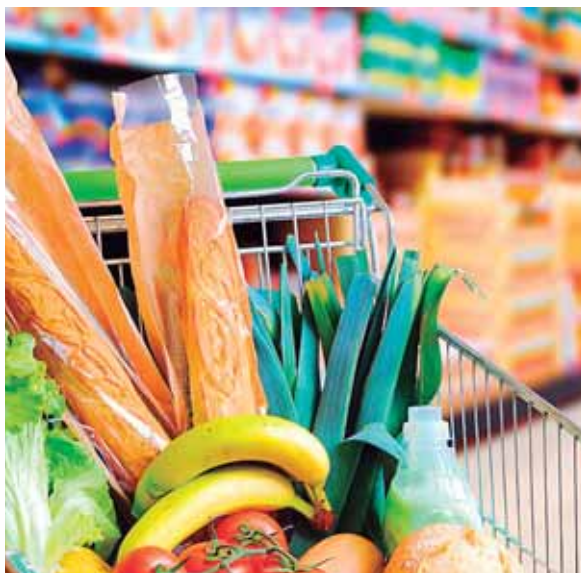
Honduras cerró 2017 con una tasa de inflación del 4.7 por ciento.

Además detalló que los alimentos y bebidas no alcohólicas, alojamiento, agua, electricidad, gas y otros combustibles, hoteles, cafeterías y restaurantes, cuidado personal, muebles y artículos para el hogar fueron los que más influyeron en la inflación de julio pasado.