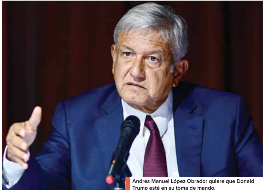
Andrés Manuel López Obrador quiere que Donald Trump esté en su toma de mando.

En la conferencia de ayer López Obrador anunció también que el exalcalde de Ciudad de México Marcelo Ebrard se-