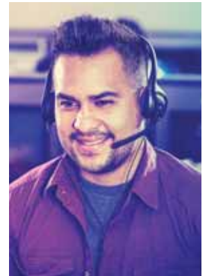
La carrera de Técnico Universitario Bilingüe en Call Center es una de las más solicitadas por los estudiantes.