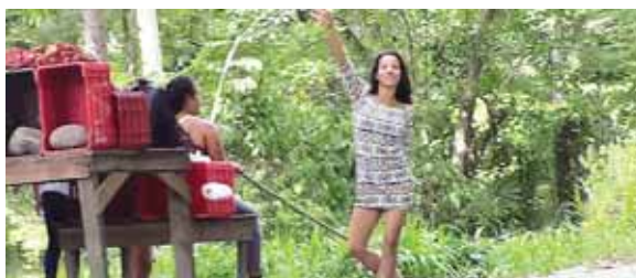
La necesidad obliga a llamar la atención de los conductores. Esta chica es muy extrovertida en su trato con la gente.

Nosotros vendemos toda clase de frutas de temporada: nances,