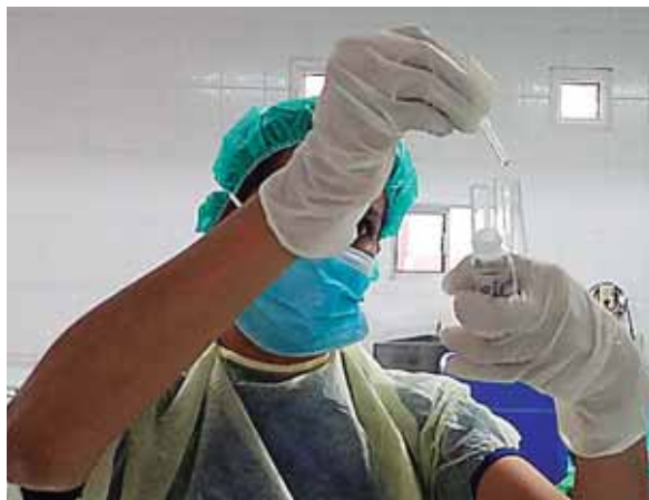
En el Rivas al mes se recolectan al menos 90 litros de leche.

“Si lo vemos como una referencia al año pasado, consideremos satisfactorio los logros que ha habido en este año. La gran tarea que asumimos cada día es reducir las consecuencias de accidentes de tránsito”, concluyó.