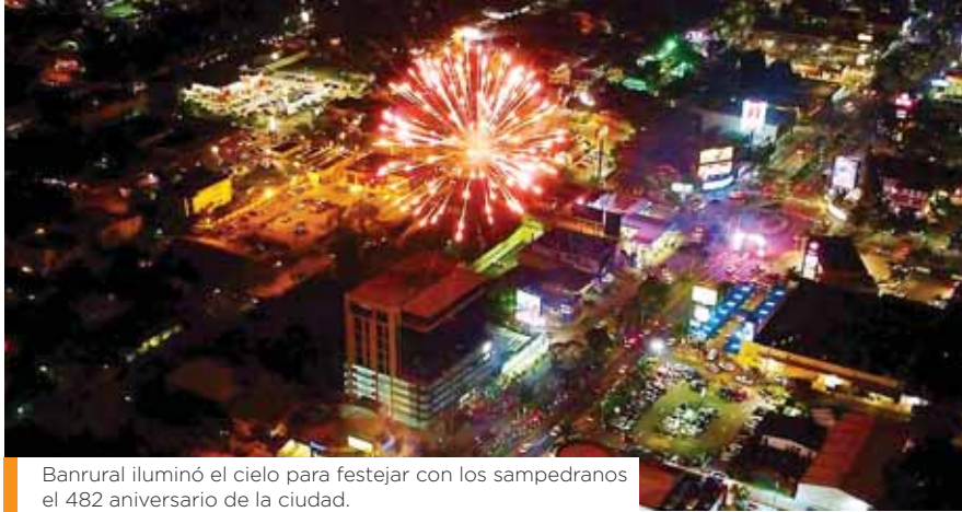
Banrural iluminó el cielo para festejar con los sampedranos el 482 aniversario de la ciudad.

Banrural cerró por todo lo alto la celebración de la Feria Juniana, regalándole a los sampedranos una espectacular noche de luces en conmemoración del 482 aniversario de esta bella ciudad, la actividad que se realizó el pasado 30 de junio, se llevó a cabo en Torre 101 Banrural en Ave. Circunvalación.