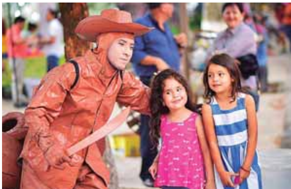
Para los pequeños también ha habido diversión y entretenimiento.