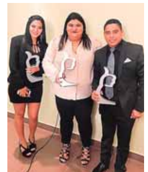
El elenco de Acceso Cristiano estará participando en vivo.