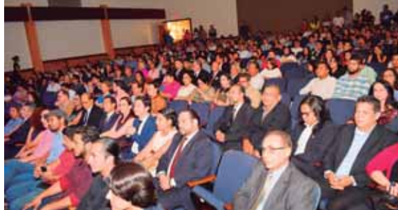
El auditorio del Centro Cultural Sampedrano lució sus mejores galas para la inauguración de la XXVIII edición del Salón Nacional de Arte.