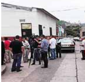
En plena vía pública los taxistas realizaron una conferencia para informar de su protesta.

Asimismo, explicaron que algunos usuarios del transporte y dueños de vehículos particulares estarán sumándose a las acciones de protesta.