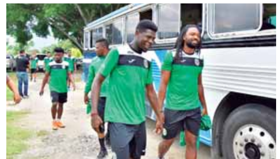
Los trabajos de pretemporada de los verdes siguen.