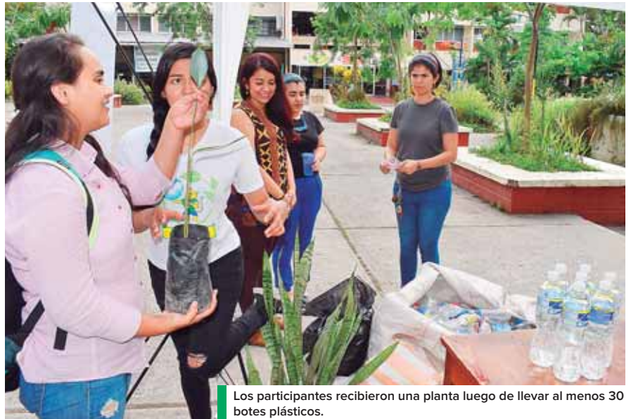
Los participantes recibieron una planta luego de llevar al menos 30 botes plásticos.

Además, por 10 botellas de plástico se ganaban una planta más pequeña y por una botella se llevaban agua en bolsa, con el compromiso de regresar el empaque.