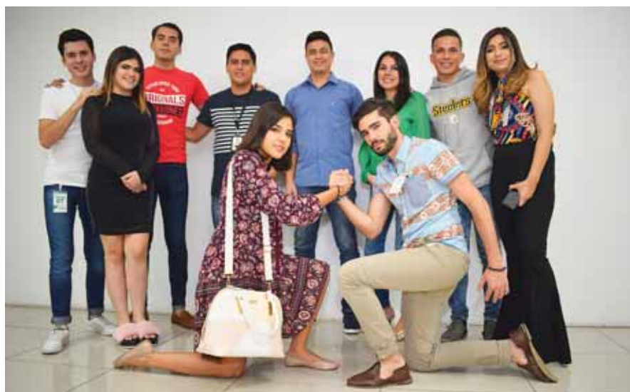
Los chicos de la Web aprovecharon a tomarse una foto del recuerdo de esta especial visita a Diario EL PAÍS.