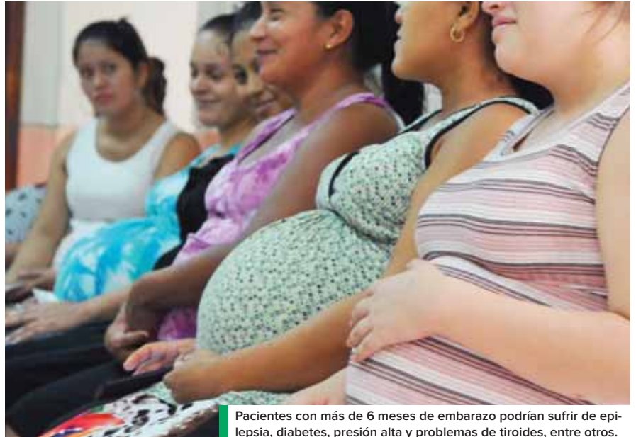
Pacientes con más de 6 meses de embarazo podrían sufrir de epilepsia, diabetes, presión alta y problemas de tiroides, entre otros.

La especialista hizo énfasis en malformaciones por defectos fetales de cara abierta; y problemas del corazón en el que el bebé probablemente muera al nacer, porque los problemas cardíacos son muy graves para los pequeños.