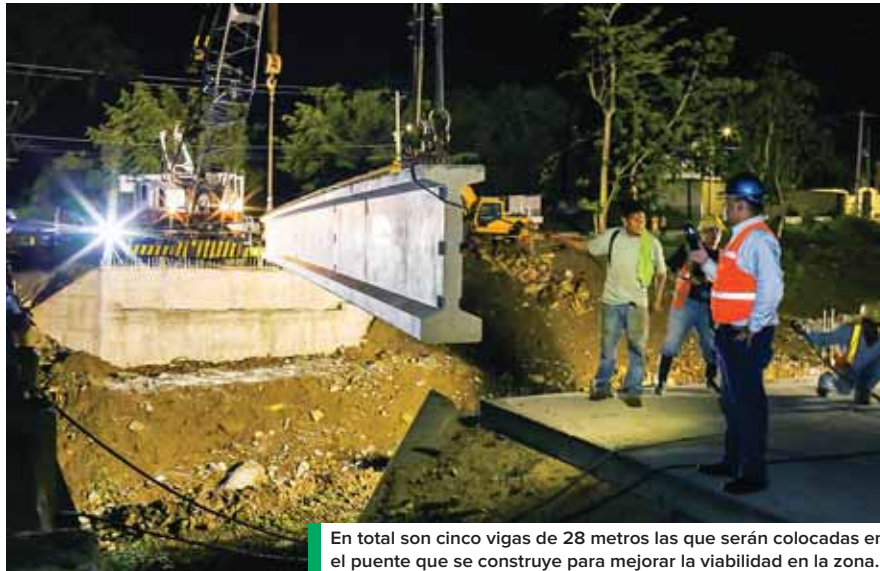
En total son cinco vigas de 28 metros las que serán colocadas en el puente que se construye para mejorar la viabilidad en la zona.

Precisó que una vez aseguradas todas las vigas se comenzará con la construcción del “diafragma” que son elementos estructurales que sirven para “rigidizarla lateralmente, para luego colocar las losas de concreto y posteriormente los pretiles”.