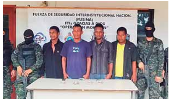
Los detenidos fueron puestos a la orden de las autoridades correspondientes para continuar con el proceso en su contra,

Inmediatamente las cuatro personas fueron detenidas y trasladadas a las instalaciones de la Policía Nacional de la comunidad de Brus Laguna de donde fueron enviados a Puerto Lempira y ser remitidos ante los tribunales.