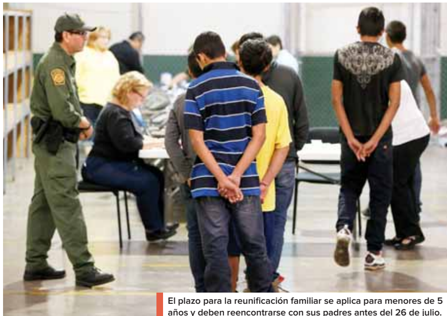
El plazo para la reunificación familiar se aplica para menores de 5 años y deben reencontrarse con sus padres antes del 26 de julio.

Indicó que "es deplorable que estén usando la obligación de reunir niños para recolectar información sensible sobre cada niño. Esto permitirá al gobierno