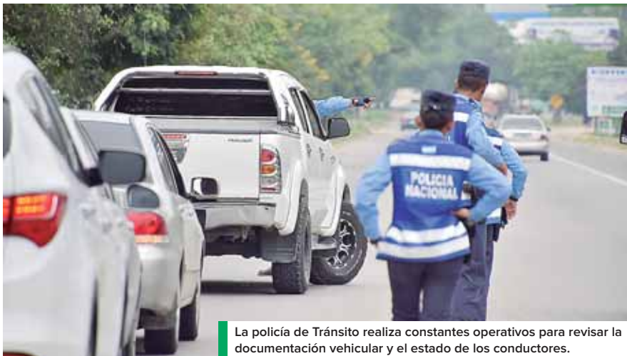
La policía de Tránsito realiza constantes operativos para revisar la documentación vehicular y el estado de los conductores.

España destacó que la mayoría de infracciones se dieron a personas que cometieron faltas graves a la Ley de Tránsito. “Como podemos apreciar al menos 190 fueron decomisado por infracciones a la Ley de Embriaguez, que en todo caso son las faltas que mayor sanción tienen en el sentido económico y administrativo, como es la suspensión de las licencias desde 6 meses hasta 1 año o por forma definitiva. Esto debido a la incidencia que pueda haber en las infracciones”, apuntó.