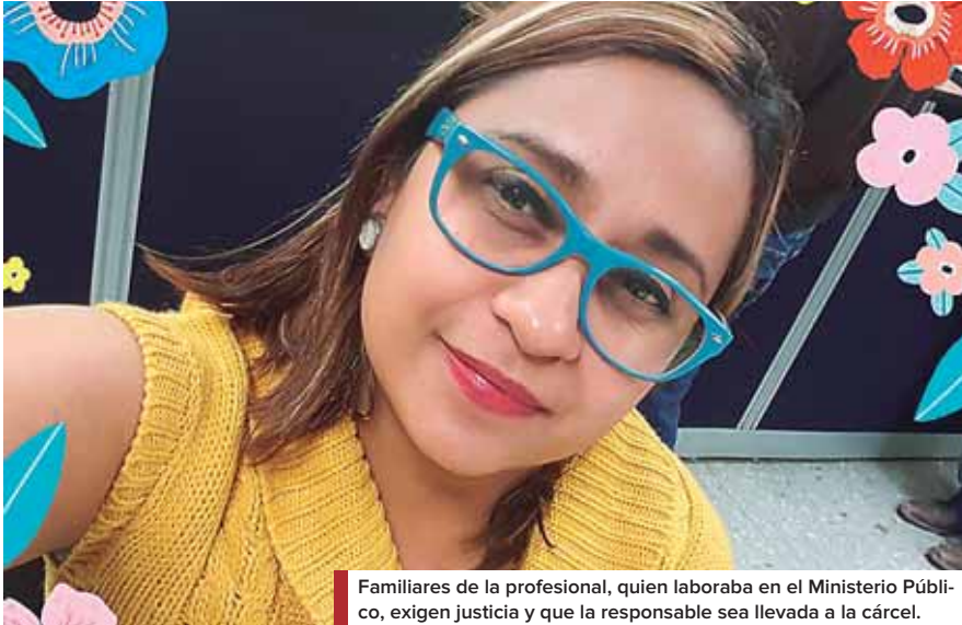
Familiares de la profesional, quien laboraba en el Ministerio Público, exigen justicia y que la responsable sea llevada a la cárcel.