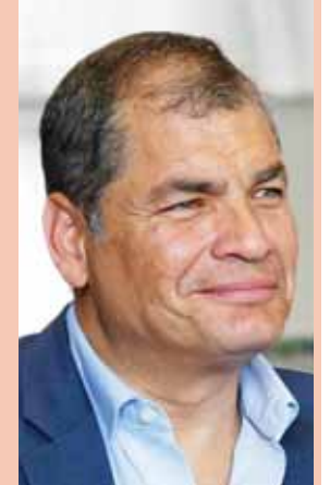
El exgobernante podría ser sobresido en el Ecuador.

“Yo creo que el presidente (sic) Correa debería venir, debería venir, y a veces desearía verdaderamente que resulte inocente de lo que se le acusa”, señaló Moreno en un encuentro con la prensa extranjera en la sede del Gobierno nacional en Quito. AFP