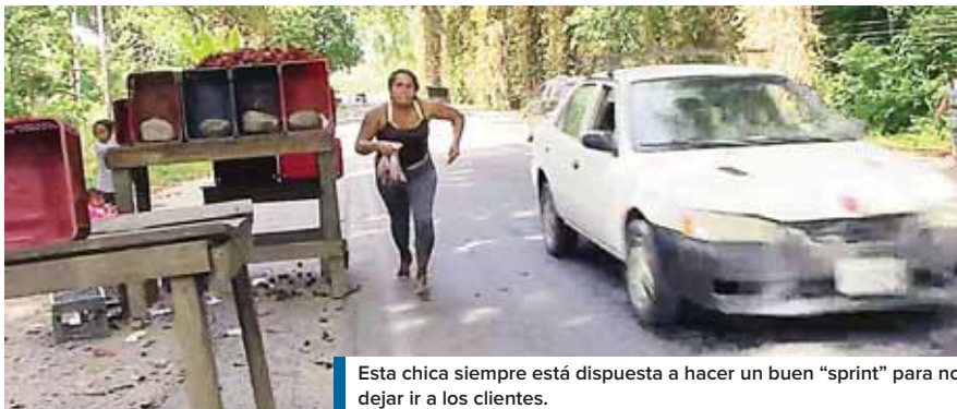
Esta chica siempre está dispuesta a hacer un buen "sprint" para no dejar ir a los clientes.

Una de las vendedoras expresó que desde que tenía doce años de edad empezó a vender frutas en este sector. "Ahora tengo mi hogar y mientras mi esposo trabaja yo me dedico a vender para ayudarlo en los gastos del hogar". Mientras era en-