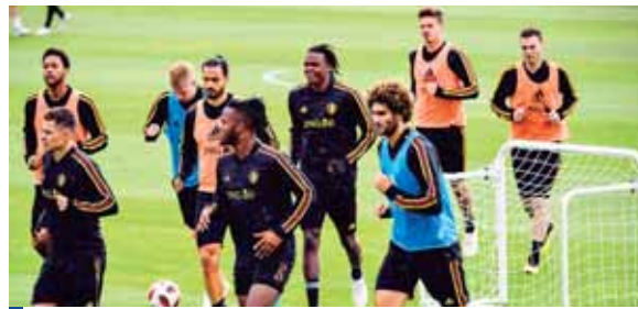
Eden Hazard es el motor de los belgas y hoy no será la excepción.