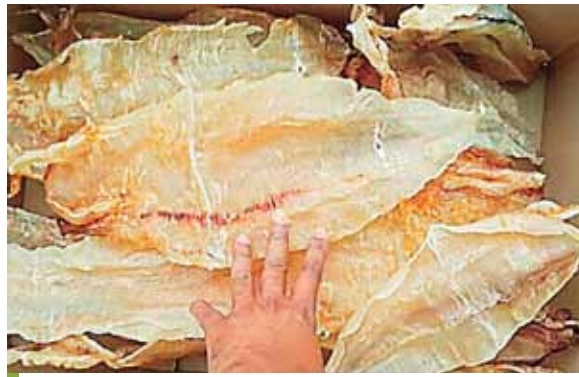
Los principales compradores de buche de corvina son los países de origen asiático.

Por su parte, los empresarios del país asiático manifestaron su interés en las principales especies del mar, que permitan lograr sostenibilidad y empleo en la zona y una mayor proyección social que per-