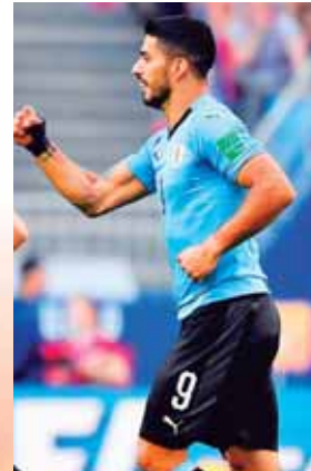
Mbappé y Luis Suárez, sin duda las miradas estarán puestas sobre estos dos grandes jugadores.