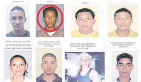
Al pandillero lo ubicaron en el barrio El Centro de Taulabé, Comayagua, donde se había ido a esconder.

Al sentir la presencia policial, supuestamente botó o escondió un arma de fuego que portaba, la cual ayer era buscada por los agentes antiextorsión para usarla como evidencia.