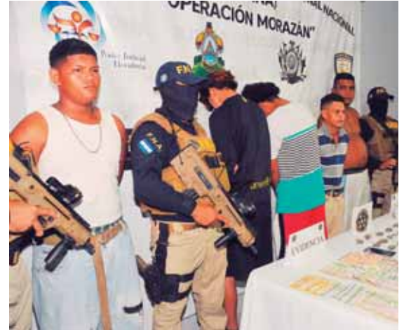
Los detenidos serán remitidos al MP por varios delitos. Cuatro son miembros de la MS-13 y uno de la pandilla la 18.

Agregó que la responsable es una enfermera profesional que trabaja en la Escuela de Enfermería y laboró en el IHSS; sin embargo, no dio a conocer su nombre por temor a represalias.