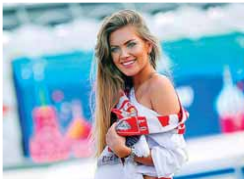
Por ella, mucho echan de menos a Polonia.