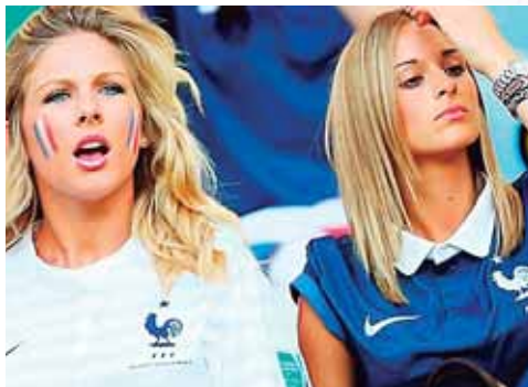
Las francesas también embellecen Rusia.