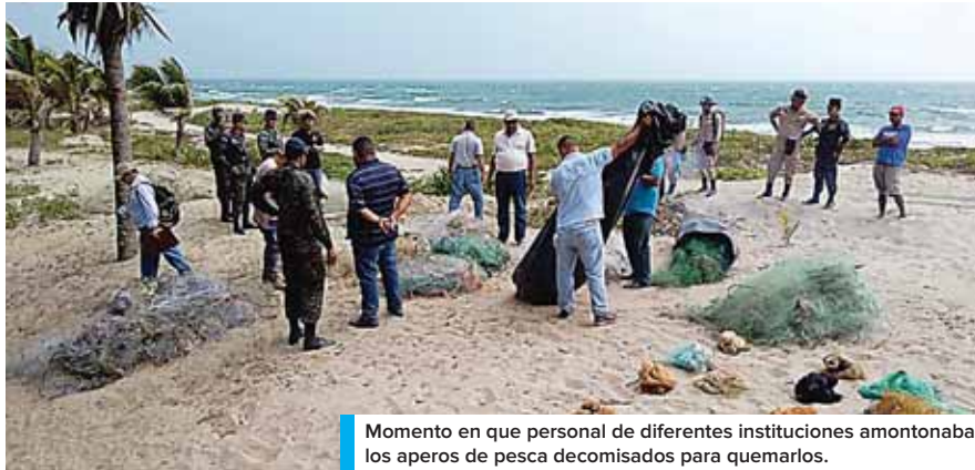
Momento en que personal de diferentes instituciones amontonaba los aperos de pesca decomisados para quemarlos.