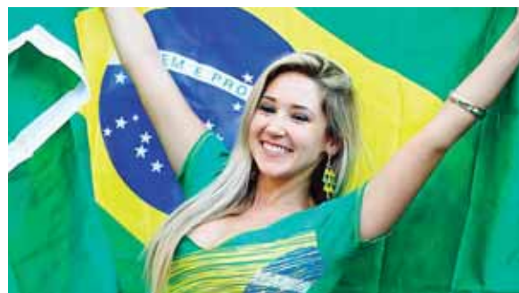
La cautivante hermosura de las brasileñas brilla.