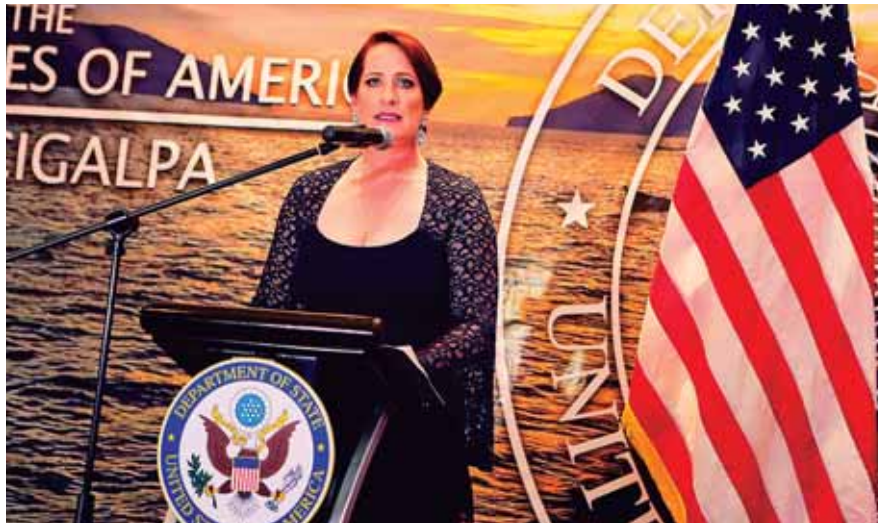
Heide Fulton destacó su compromiso de trabajar con Honduras porque lo considera un valioso aliado de su país. Además reconoció que la tasa de homicidios ha bajado a la mitad en comparación con 2011.

La diplomática destacó la iniciativa de la creación de la Unión Aduanera entre Honduras, Guatemala y El Salvador, que permitirá un crecimiento económico para las naciones centroamericanas. “El comercio regional es importante y Honduras ha demostrado que es un líder”, afirmó Fulton, al