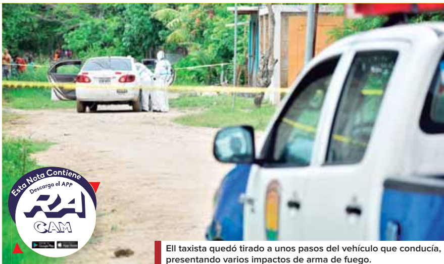
El taxista quedó tirado a unos pasos del vehículo que conducía, presentando varios impactos de arma de fuego.