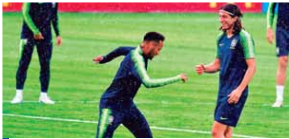
Neymar sigue siendo la figura a seguir en los brasileños.

Tenemos jugadores de mucha calidad, tanta calidad como los de Brasil, pero la diferencia es que nunca hemos ganado nada”. Roberto Martínez