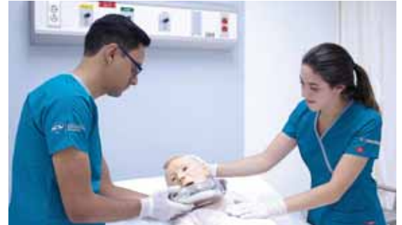
Todos los programas de Ceutec y Unitec cuentan con talleres y laboratorios especializados.

El secretario de Salud Octavio Sánchez se reunió con el diputado por Cortés Enrique Ylescas para conocer las necesidades más urgentes de los centros asistenciales del Estado y buscar apoyo desde el Congreso Nacional.