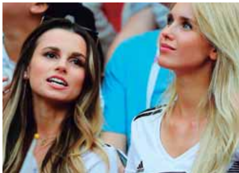
Dos hermosas alemanas en las tribunas.