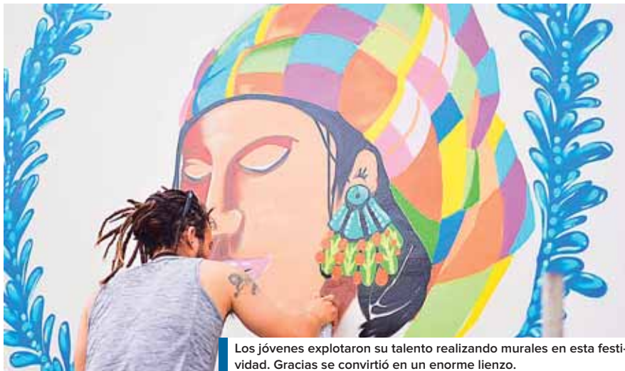
Los jóvenes explotaron su talento realizando murales en esta festividad. Gracias se convirtió en un enorme lienzo.

La Plaza Central de Gracias, cabecera departamental de Lempira, acogió desde las 9:00 de la mañana, la primera actividad del festival, dándole a los niños el lienzo más grande de la ciudad, para que dejen volar su imaginación.