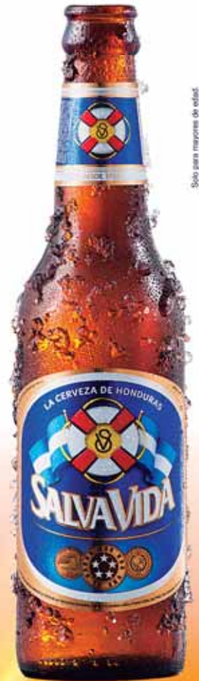
Solo para mayores de edad.