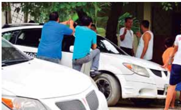
Compañeros y familiares de la víctima llegaron al lugar y se mostraron indignados por el crimen del conductor.