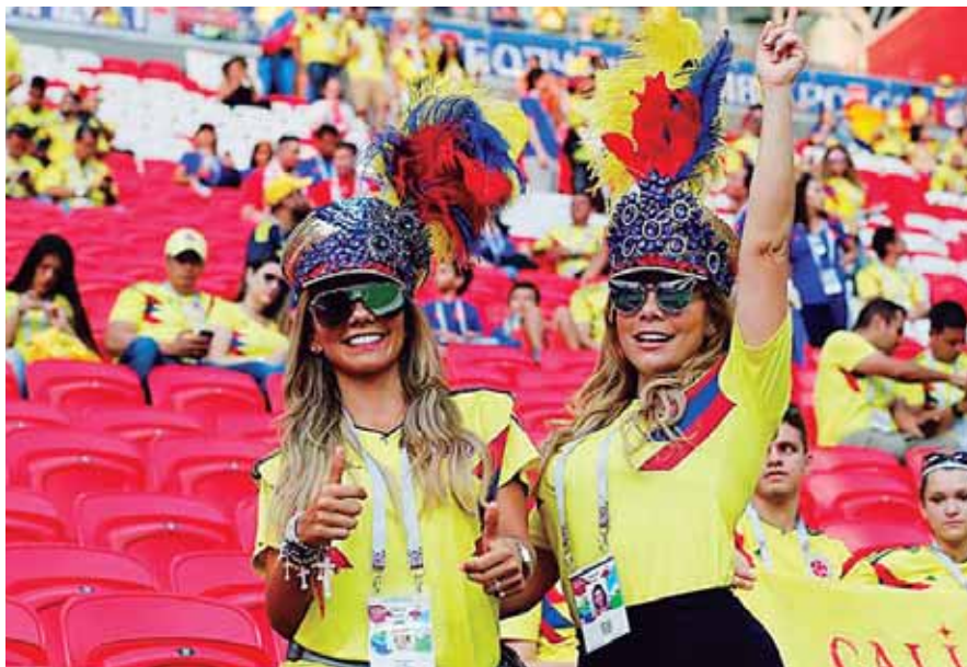
Las colombianas, además de bellas, tienen una picardía y una gracia que son un imán para muchos.

Los fotógrafos de las cadenas de noticias y de agencias de prensa rompen lo rutinario captando lo más bello que se puede apreciar en las tribunas, para que el mundo también aprecie su gracia.