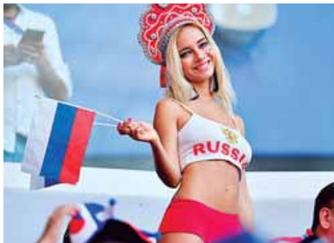
Esta actriz rusa es una de las favoritas.