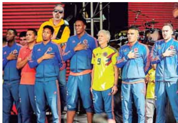
El seleccionador José Pékerman al lado de los jugadores que cantan el himno nacional durante su ceremonia de bienvenida.

José Néstor Pékerman bajó del bus que llevaba a la Selección Colombia desde el aeropuerto hasta el estadio El Campín con la camiseta amarilla puesta. En el dorsal, el número 9 y el nombre de Falcao. El entrenador argentino la lucía con orgullo.