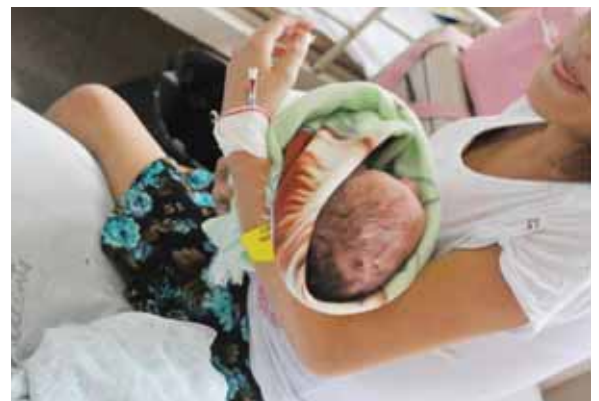
El número de menores en estado de embarazo se ha incrementado. La mayoría rondan los 13 y 14 años de edad.

En la institución hospitalaria pueden asistir las mujeres embarazadas que presentan algún pro-