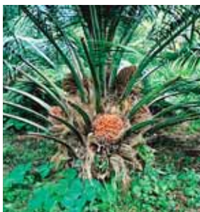
Los palmeros deben certificarse para comercializar a la UE.

nes de manejo sostenible y socializar con los Consejos Territoriales de la zona, la posibilidad de inversión que permita fomentar modelos de negocios que traigan consi- go beneficios sociales y empresariales, lo cual es del interés del Gobierno de la República.