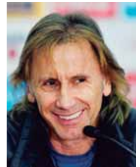
El entrenador de Perú es imposible traerlo a Honduras.