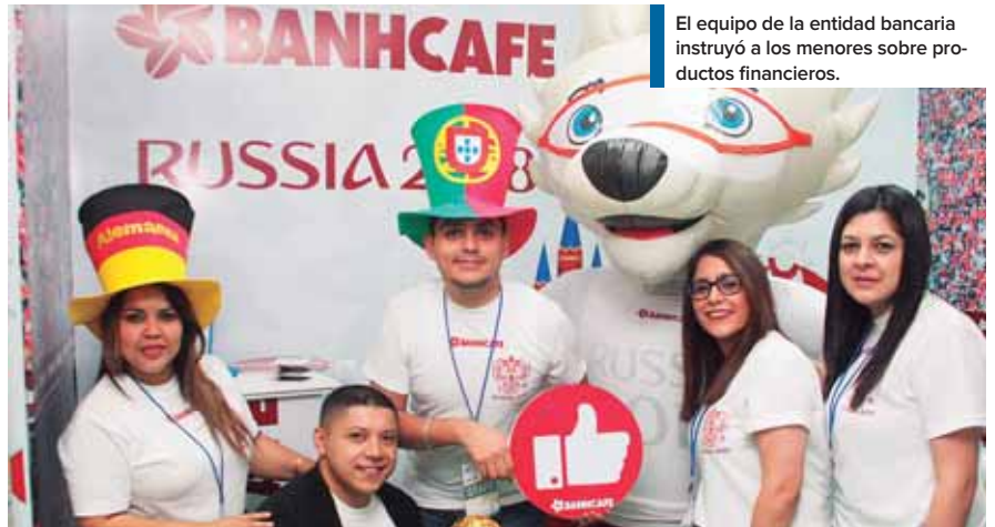
El equipo de la entidad bancaria instruyó a los menores sobre productos financieros.

nocimientos sobre las herramientas que ofrecemos”. El adiestramiento se realiza de forma lúdica con menores. Pueden aprender de los productos financieros por medio de mecanismos de entretenimiento, refirió. “Los padres pueden acompañar a sus hijos y de esa forma promovemos que ambos tengan conocimiento de las herramientas que poseemos para que puedan iniciar emprendimientos y a la vez se inculque en los niños la cultura del ahorro”, puntualizó.