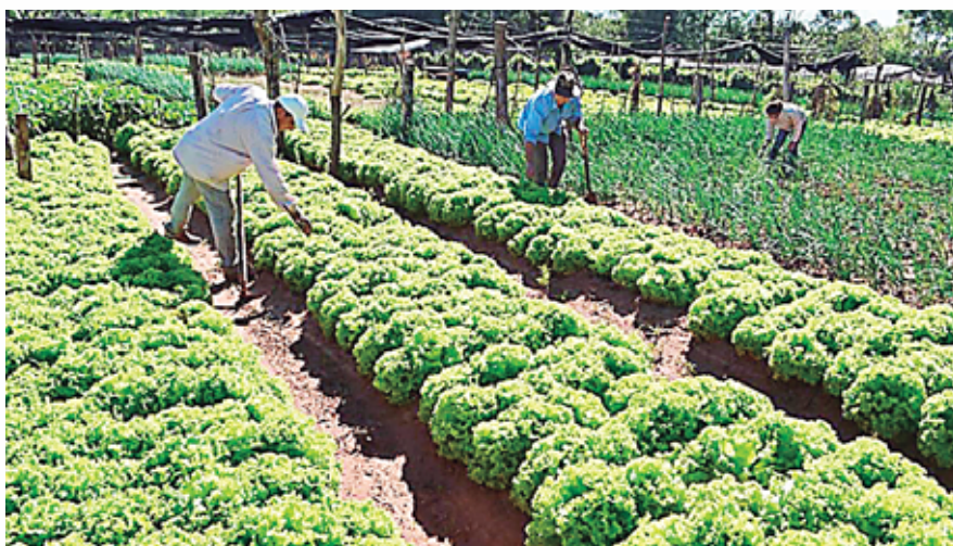
La agricultura es una actividad clave en la reactivación de las economías rurales.

La meta es saber qué define las capacidades para afirmar que una organización de agricultores funcione de forma profesional. Una vez construidos estos estándares, se elaborarán guías para la mejora interna de asociaciones de cosechadores.