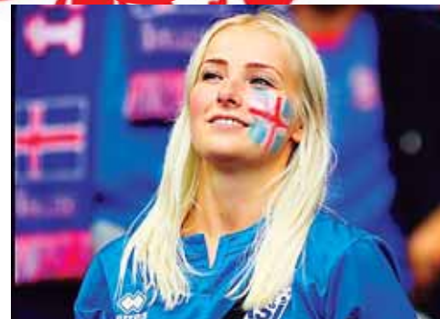
Qué decir de esta muñeca de Islandia.