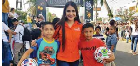
Felices con sus balones Banrural.

Los fuegos pirotécnicos duraron un poco más de 25 minutos, cerrando así con broche de oro la celebra-