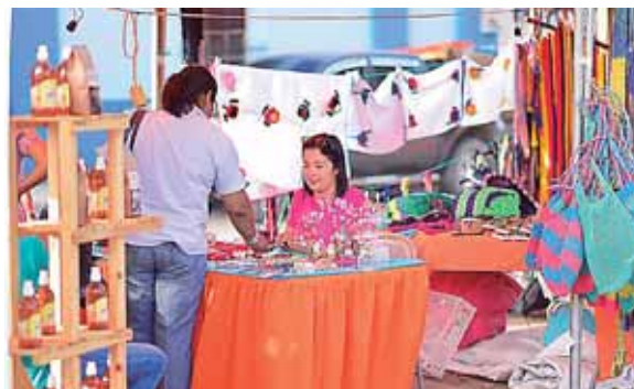
La cultura que representa a Gracias y otras comunidades de Lempira, ha sido exaltada con los distintos tejidos que están a la venta.