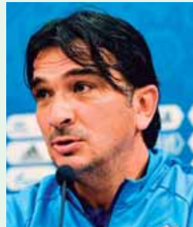
El entrenador croata espera contar con el jugador.

Es una pieza clave en el planteamiento del estratega croata Zlatko Dalic, que lo necesita contra Rusia, pero a plenitud, sin el temor de que recaiga de la lesión. Al menos será tranquilizante tenerlo en la banca, contando con él.