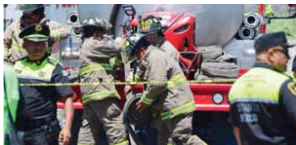
Tultepec, es una comunidad de artesanos pirotécnicos que ya ha sufrido explosiones en polvorines o en sus casas.

El presidente de Costa Rica, Carlos Alvarado, pidió ayer evitar una discusión sobre el derecho al aborto, al advertir que polariza al país y lo aleja de temas prioritarios, como la situación fiscal y la inseguridad. Éste presentó un proyecto de ley para equiparar las penas por aborto a las del homicidio calificado, de hasta 30 años de prisión. AFP.