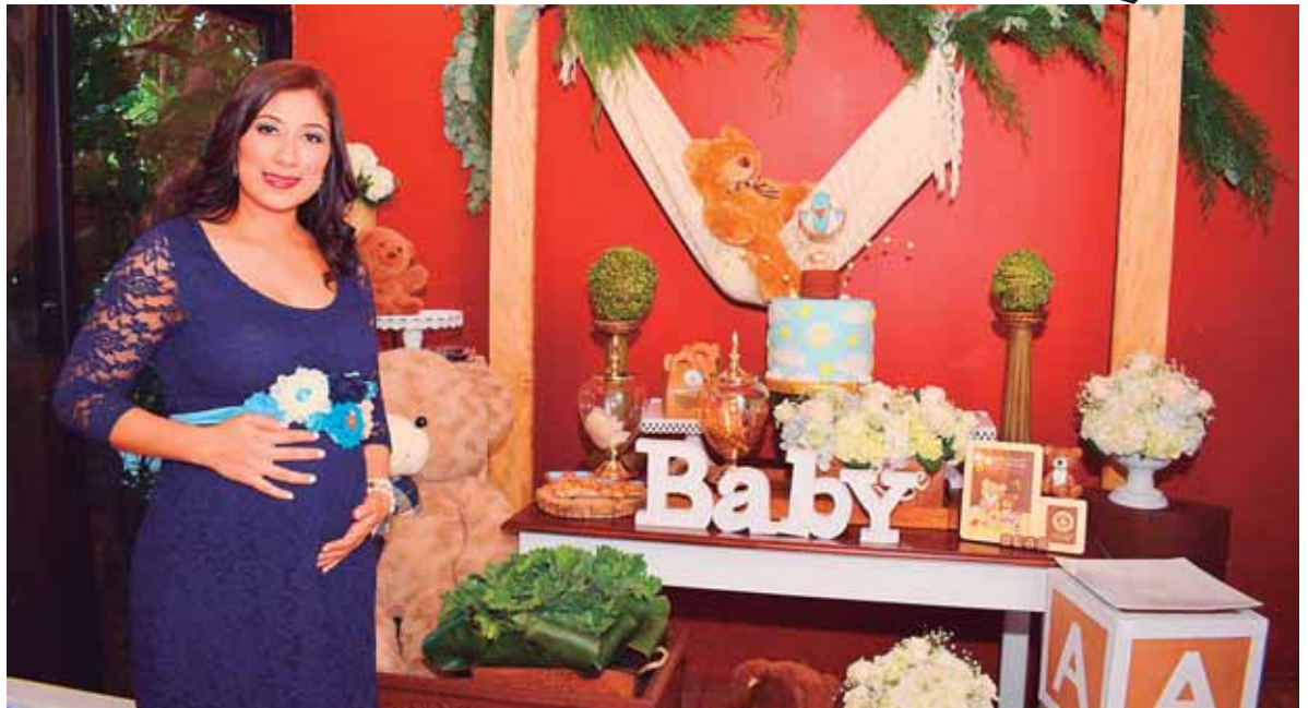
La feliz mamá recibió una tremenda sorpresa de sus amigas.