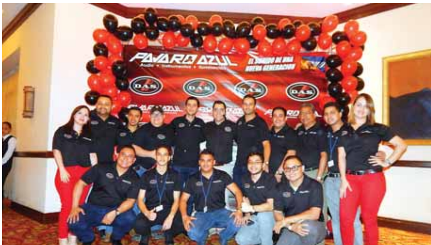
Staff de Pájaro Azul y DAS AUDIO

Todo un espectáculo de audio presentó Pájaro Azul a sus clientes en el lanzamiento de la marca DAS, mundialmente reconocida y utilizada en grandes festivales internacionales en Europa.