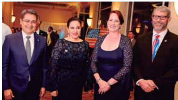
Las autoridades hondureñas y estadounidenses festejaron el 242 aniversario de independencia del país norteamericano.

Por su parte el mandatario Juan Orlando Hernández, manifestó que han pasado más de 160 años desde que “nuestros países establecieron relaciones diplomáticas y, sin embargo, cada año resulta más importante y especial esta celebración”.