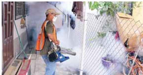
Además de fumigar, las cuadrillas aconsejaron a los vecinos de Río Blanco mantener limpias las pilas y solares baldíos.