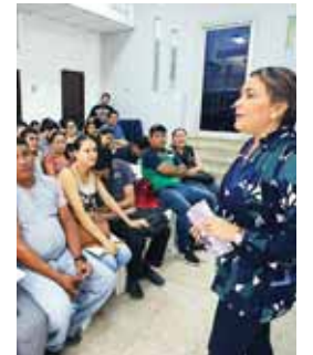
Las parejas reciben las charlas prematrimoniales de forma gratuita.

“Me llamó mucho la atención temas como el respeto, la comunicación y el amor, los cuales se deben consolidar para lograr la convivencia en el hogar”.