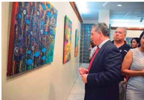
El público pudo admirar las obras de los expositores.