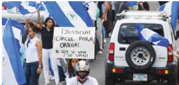
Inconformes creen que no hay apertura ni voluntad política del Gobierno.

La reunión tendrá lugar el lunes en el Seminario Interdiocesano Nuestra Señora de Fátima de Mana-