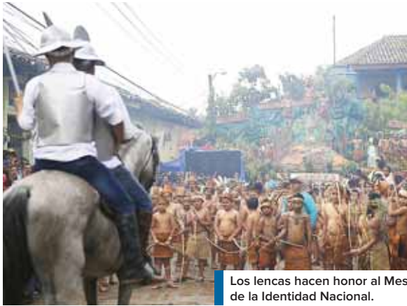
Los lencas hacen honor al Mes de la Identidad Nacional.