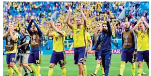
Los suecos jugarán por cuarta vez cuartos de final.