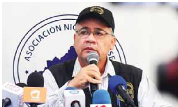
Entre los muertos por la crisis de Nicaragua hay 25 menores de edad, afirmó el presidente de la ANPDH, Álvaro Leiva.

López Obrador ganó la presidencia de México con 53% de los votos en los comicios del pasado domingo, situándose a 30 puntos del segundo aspirante, Ricardo Anaya del conservador Partido Acción Nacional (PAN). AFP.