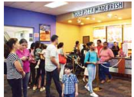
Deliciosa pizza, ensaladas y postres puedes disfrutar en este restaurante.