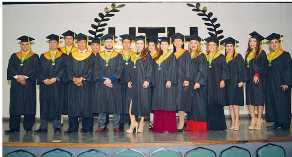
Los nuevos profesionales que se graduaron con altos honores.