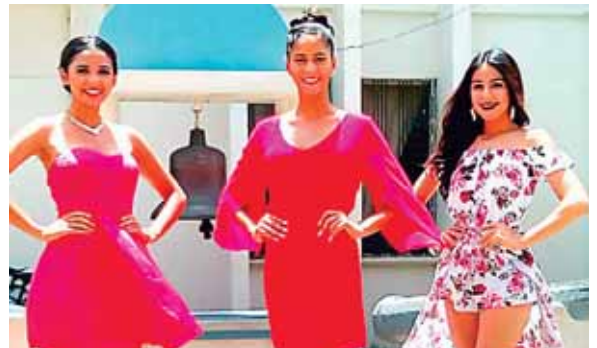
Los promotores se reunieron con representantes de autoridades policiales, Bomberos y Cruz Roja para coordinar el apoyo.

vencción Social (DINIS), que ayer convocó a una reunión de trabajo a la Policía Preventiva, Cruz Roja, Bomberos y Seguridad Ciudadana para organizar. La marcha contará con el respaldo del sector privado, y es promovida por personas que ya están “hartas” de los nullos resultados que ha tenido el combate contra el crimen organizado y la delincuencia común.