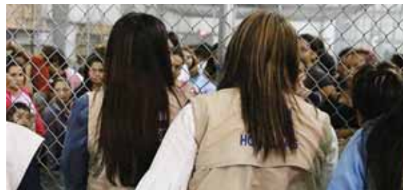
Las familias permanecen en centros de detención. Autoridades hondureñas esperan reducción migratoria en los próximos meses.

Aseguró que el compromiso de su esposo, el presidente Juan Orlando Hernández, es seguir avanzando para disminuir las cifras migratorias, y esto se logra trabajando en atacar la raíz del problema,