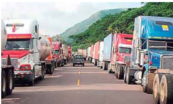
La crisis está teniendo un impacto en el comercio.

Según el dirigente, hay que hablar del transporte centroamericano. “El último dato que tenemos es que hay unos 8 mil furgones varados en la frontera entre Honduras