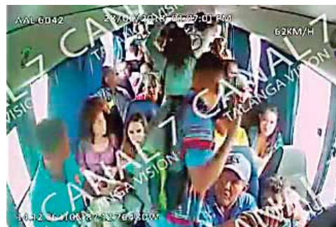
Otro de los atracadores aparece para ayudar a la víctima a despojar de teléfonos y dinero a los usuarios.