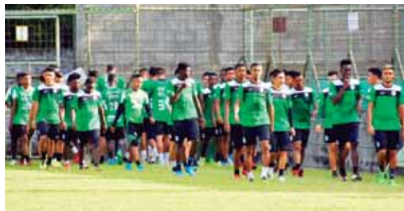
El Marathón jugará el 21 de julio el partido por la Copa Presidente.