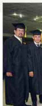
Los recién Graduados de Producción