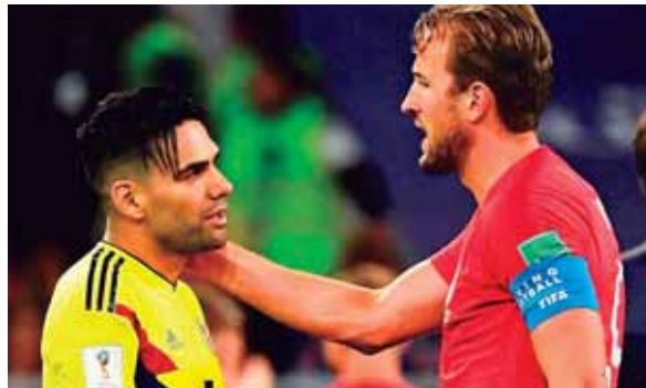
Como buen competidor, Harry Kane consuela a su rival el colombiano Falcao, una vez finalizada la tanda de penales.