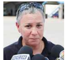
Marlen Piñeiro, directora del ICE, incita a los migrantes a que no se arriesguen.

En la Casa Padre, un refugio donde se encuentran menores varones no acompañados que han sido liberados por el ICE, hay 1,200 menores de 10 a 17 años, de los cuales 410 son migrantes hondureños y 51 fueron separados de sus padres al cruzar la frontera.