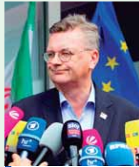
Reinhard Grindel, presidente de la DFB.

El presidente de la DFB, Reinhard Grindel, había dicho antes del partido ante Corea del Sur que pasara lo que pasara seguiría apostando por Löw. La prensa alemana había señalado en los últimos días que Löw se inclinaba por no abandonar el puesto dejando como su última hoja de servicios un fracaso tan rotundo, después de haberse convertido en un icono del fútbol alemán.