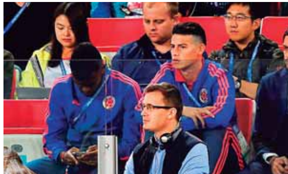
James Rodríguez fue el gran ausente en el juego y en las gradas sufrió viendo cada acción ante Inglaterra.