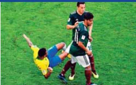
Le van con todo, pero algunos creen que exagera.