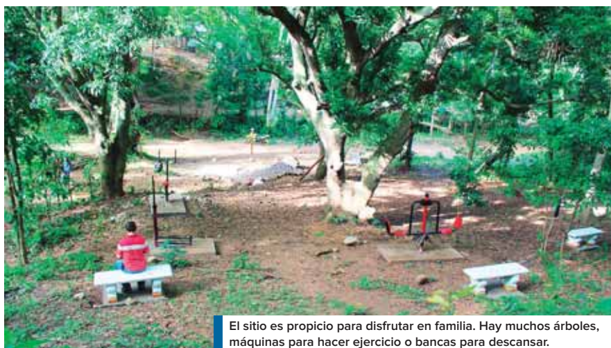
El sitio es propicio para disfrutar en familia. Hay muchos árboles, máquinas para hacer ejercicio o bancas para descansar.