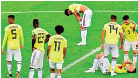
La tristeza de Colombia por el adiós en Rusia 2018.

En la prórroga, Falcao acarició el gol en el 104 y Danny Rose en el 112, pero la velada había prometido emociones fuertes y no decepcionó. Se fueron a los lanzamientos de penal y allí fue efectivo el cuadro inglés. James y Colombia dijeron así adiós al torneo entre lágrimas mientras los ingleses, en el cuadro teóricamente sencillo, sueñan con llegar a una final que no visitan desde que fueron campeones en su suelo en 1966. Su primer escollo: Suecia, el sábado.