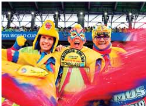
Así de coloridos llegaron al estadio.