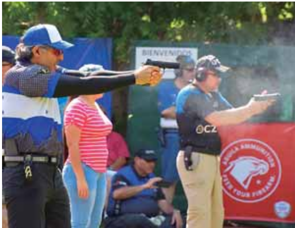
Cada uno de los competidores trató de dar en el blanco y obtener la mayor cantidad de puntaje.

SANPEROSULA. Competitivo y de buen nivel, resultó el torneo de tiro deportivo Copa La Armería Águila, bajo la modalidad internacional IPSC.