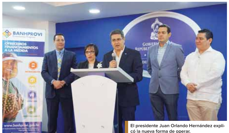
El presidente Juan Orlando Hernández explicó la nueva forma de operar.

“Significa que los créditos tienen que ser ágiles, oportunos, que tengan tasas de acuerdo a la actividad y a la experiencia del cliente”.