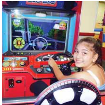
¡Chuck E. Cheese's ofrece el ambiente real en donde un niño puede ser niño!

Este Centro de Entretenimiento Familiar tiene un horario de 10:00 a.m. a 9:00 p.m. de lunes a jueves y los domingos y un horario especial los viernes y sábados de 10:00 a.m. a 10:00 p.m. ¡Chuck E. Cheese's ofrece el ambiente real en donde un niño puede ser niño!