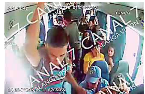
Las gráficas se han hecho virales, con el fin que las autoridades identifiquen a los malhechores.