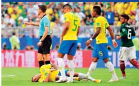
Muchos le critican sus gestos de dolor.