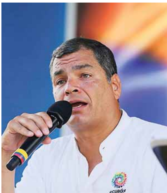
El exmandatario reside en Bélgica y es acusado por su presunta vinculación en el secuestro de un opositor que vivía en Colombia.

Cinco personas lo subieron a la fuerza a un automóvil, aunque la policía colombiana interceptó el vehículo y frustró el se-