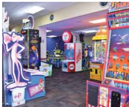
Más de 70 juegos para la diversión de los pequeños.