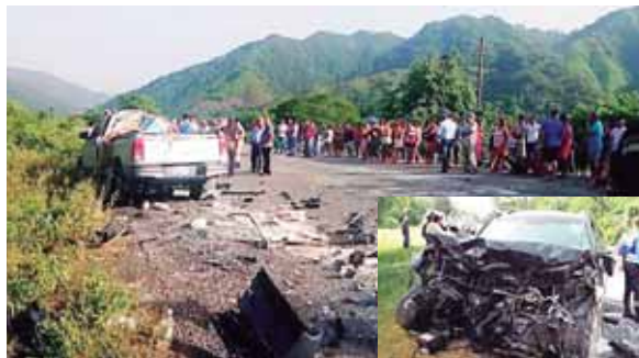
El Cuerpo de Bomberos se apersonó al lugar para brindar los primeros auxilios a los accidentados y llevarlos a un hospital.

turismo, que quedó con la parte frontal destruida, se conducía de Villanueva, Cortés hacia esta ciudad, mientras que el otro automotor se dirigía en sentido contrario.