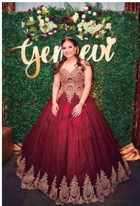
La feliz quinceañera, posó para el lente de Diario EL PAÍS.