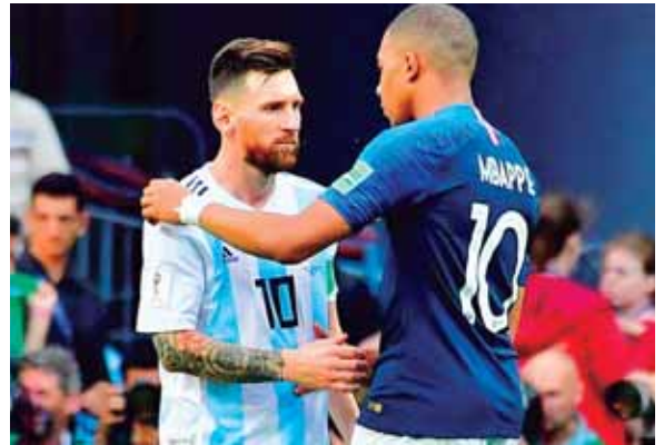
La joven estrella francesa consuela a Lio Messi luego del partido que los enfrentó en el Mundial y que clasificó a Francia.

“Tiene esa lucidez, esa sangre fría delante del arco, que integra la raza de grandes goleadores”, apunta por su lado Batelli.