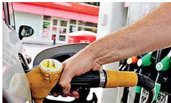
Hasta el mes de abril de 2017 se importaron 5.6 millones de barriles de derivados del petróleo.

La institución financiera del Estado señaló que la importación de gasolina tuvo un costo de 166.1 millones de dólares, es decir, 15.6 millones (10.3 por ciento) más a lo comprado en los primeros cuatro meses del año pasado, cuando rondó los 150.5 millones de dólares.