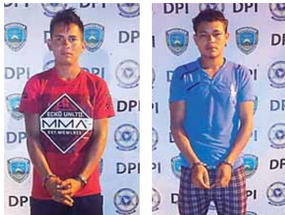
Durante la operación, las autoridades aprehendieron a estos dos individuos que serían parte del grupo criminal.

Según la DPI, también se les investiga por el asesinato de un taxista en la colonia Pizatty y la muerte de una enfermera.