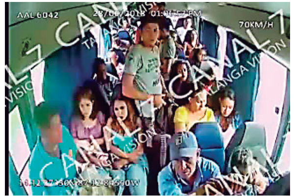
Mientras el bus iba en marcha, el individuo saca un arma de fuego del interior de la mochila, para amedrentar a los viajeros.