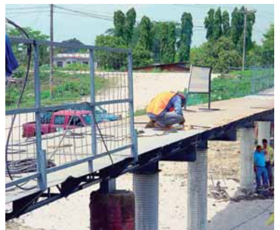
Los equipos trabajaron en el mantenimiento completo del puente, quitando el óxido y otros elementos estructurales dañados.

“Parte de la reparación consistió en la fundición de zapatas y columnas para montar vigas metálicas y sobre estas la plataforma por donde podrán caminar los peatones. Las nuevas columnas tienen 2.50 metros de profundidad”, puntualizó.