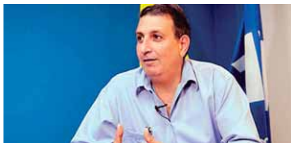
Salomón salió al paso de lo escrito en ESPN en sus redes sociales, donde aseguraban que Matosas es el nuevo DT de la Bicolor.

El zaguero ha jugado en Platense, Honduras Progreso