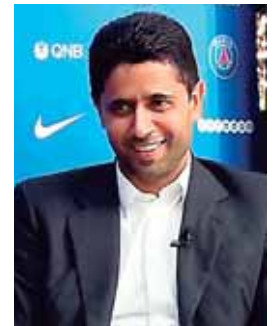
El dueño del club francés está en el ojo del huracán.