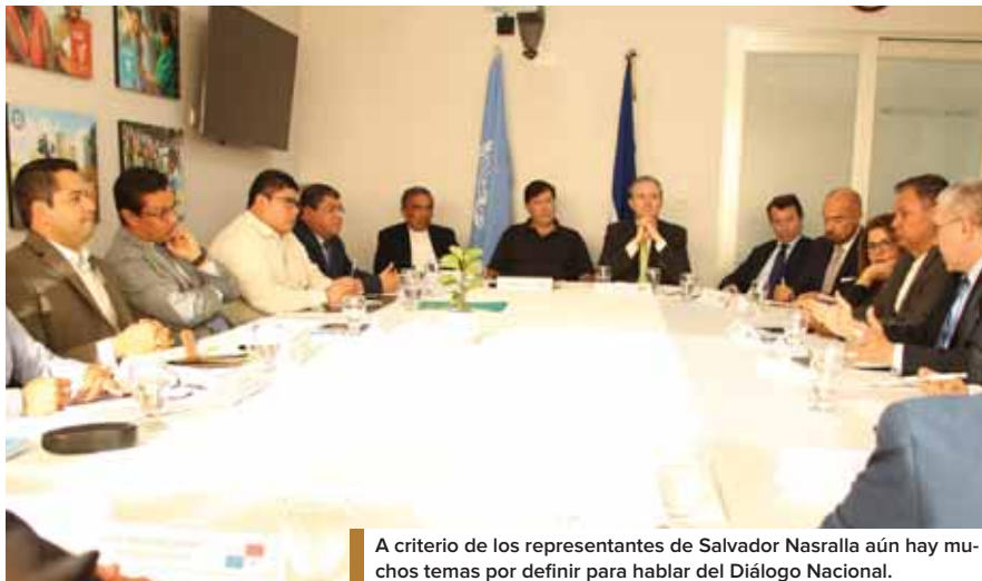
A criterio de los representantes de Salvador Nasralla aún hay muchos temas por definir para hablar del Diálogo Nacional.