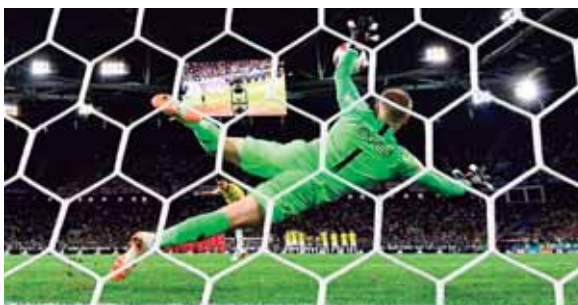
Bacca no pudo anotar y terminaba con el sueño de su selección.