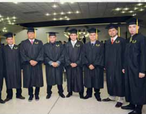
graduados de la carrera de Ingeniería en Industrial.