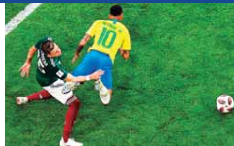
Sus caídas se dan a cada momento en el juego.