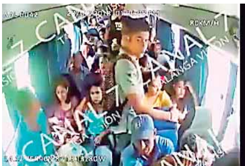
Aquí se observa a uno de los delincuentes de pie y normal como cualquier pasajero con una mochila en su espalda.