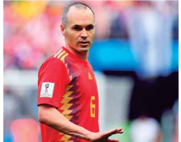
Andrés Iniesta es uno de los jugadores de una carrera llena de éxitos en la selección de España.

El héroe de Sudáfrica-2010, que con su gol ante Holanda dio a España su primer y único Mundial, ya había adelantado el pasado domingo tras la eliminación de España en octavos del Mundial ante Rusia que abandonaba la selección.