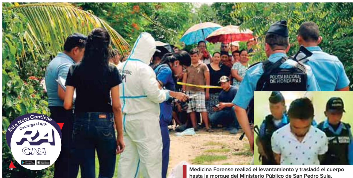
Medicina Forense realizó el levantamiento y trasladó el cuerpo hasta la morgue del Ministerio Público de San Pedro Sula.