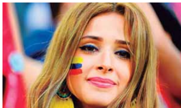
Una cara linda, pero triste. Así es el fútbol.

Inglterra, en los lanzamientos de penal. Los fanáticos colombianos, con sus coloridos trajes y sus caras pintadas con el hermoso amarillo de su emblema, prevalecieron en el estadio del Spartak de Moscú.