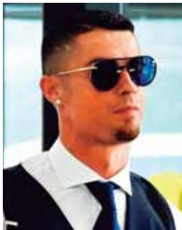
Todo apunta que CR-7 dejará las filas merengues.