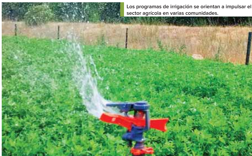
Los programas de irrigación se orientan a impulsar el sector agrícola en varias comunidades.