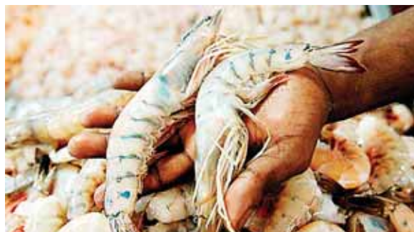
En 2016, Honduras fue el país más pesquero y con mayor producción acuícola en la región centroamericana.

Para el actual período de pesca de langosta, la Dipepesca extendió 132 licencias, para legalizar esa actividad, que generará divisas al país y miles de empleos para las familias hondureñas que participan en la actividad.