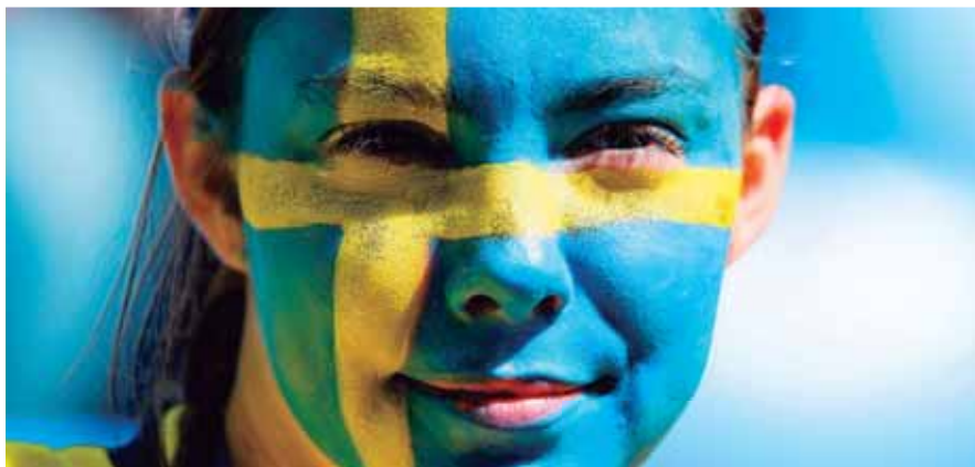
Un rostro hermoso cubierto con la bandera sueca.