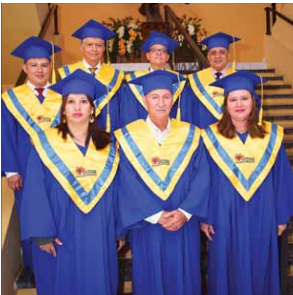
Las autoridades académicas que fueron invitadas a la especial graduación.