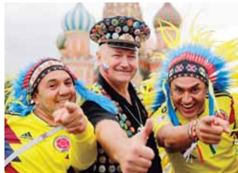
Aquí posando con un artista ruso.