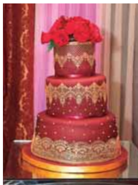
El exquisito pastel que disfrutaron los presentes.