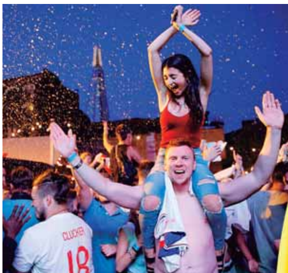
Ingléses festejando en las calles de Londres.