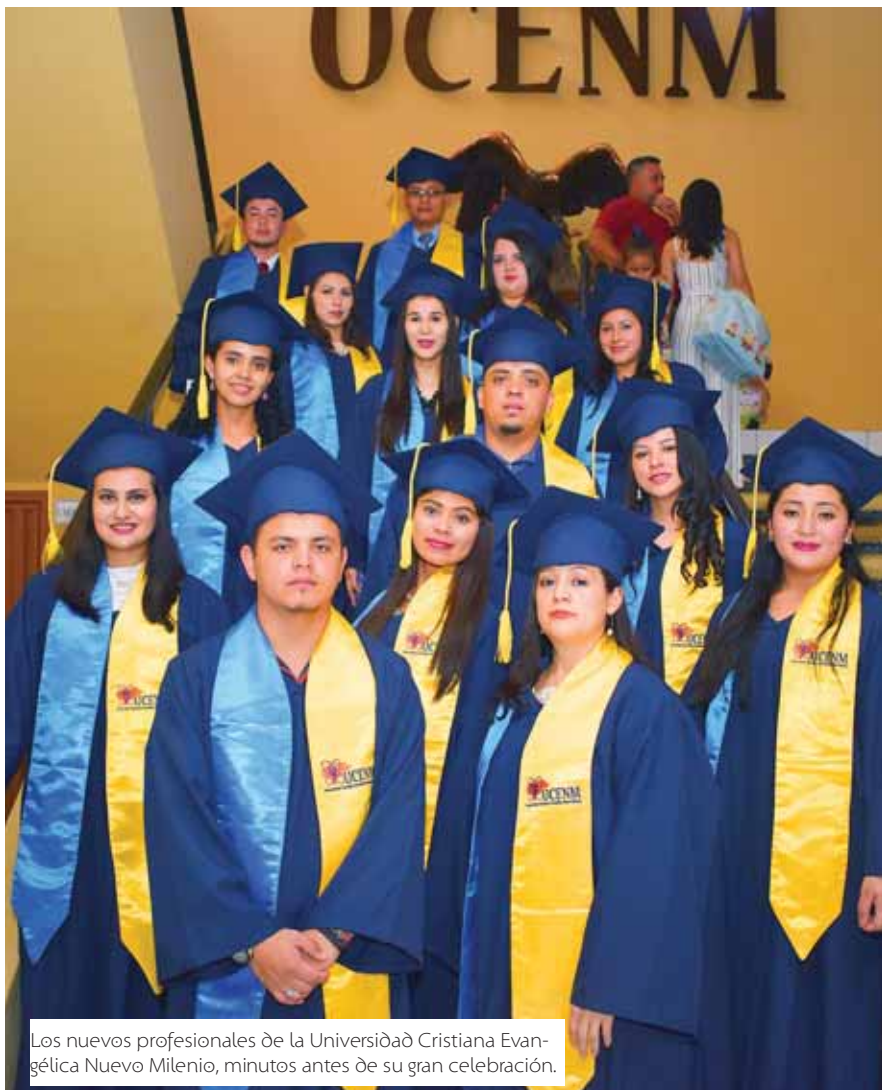
Los nuevos profesionales de la Universidad Cristiana Evangélica Nuevo Milenio, minutos antes de su gran celebración.

Posterior a los actos protocolarios, los nuevos profesionales compartieron con sus familiares e invitados especiales el gran logro estudiantil.