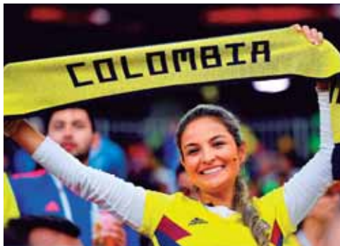
Orgullosa con su bufanda esta hincha colombiana.