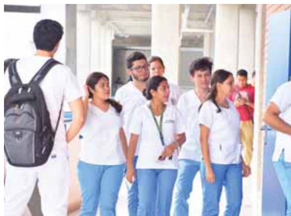
Los primeros en recibir su identificación fueron los estudiantes de Enfermería y Medicina. Ahora es el turno del resto de alumnos.

La próxima semana comienza el proceso para proveer el carné de identificación a cerca 17 mil estudiantes de la Universidad Nacional en el Valle de Sula (Unah-VS), informaron autoridades de esta casa de estudio.