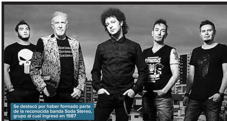
Se destacó por haber formado parte de la reconocida banda Soda Stereo, grupo al cual ingresó en 1987

elenco y así lo vivimos. Los músicos cambian, no intenta perdurar como sucedería con una banda. Somos un espectáculo musical, casi teatral, que recorre lo más querido de la música de Gustavo Cerati".