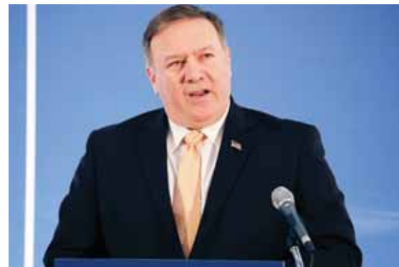
La cita con el funcionario de Donald Trump, se celebrará el 13 de este mes para discutir asuntos migratorios.

El juez chileno Miguel Vázquez condenó a nueve militares en retiro por el asesinato del afamado folclorista Víctor Jara, acribillado días después del golpe de Estado que instaló la dictadura de Augusto Pinochet, en 1973, informó ayer el Poder Judicial.