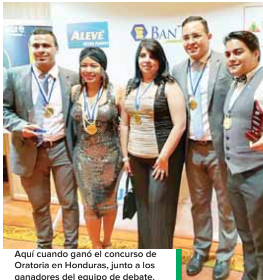
Aquí cuando ganó el concurso de Oratoria en Honduras, junto a los ganadores del equipo de debate.

“Siempre fui bien desarrapado, bastante abierto y nada penoso. Cuando entré a séptimo grado, después de la escuela, comencé a participar en actividades de canto, de música, de actuación, de ortografía. Luego me metí al mundo