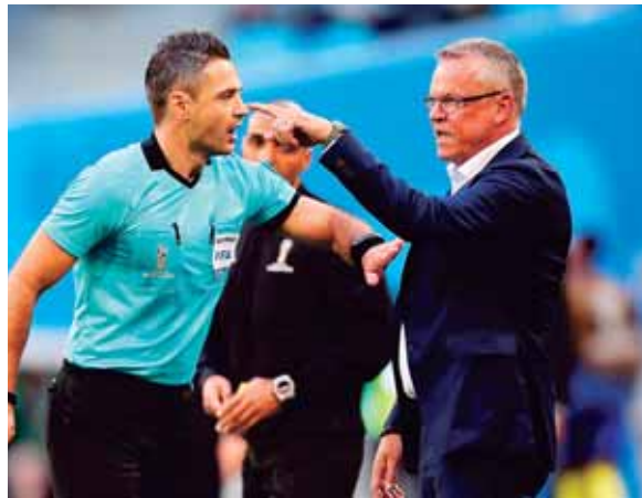
Jan Andersson, entrenador de Suecia, aseguró que tiene potencial para llegar más lejos en el Mundial de Rusia 2018.