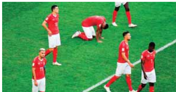
Los suizos se quedan por tercera vez consecutiva en octavos.

Suecia se ilusiona con pisar las semifinales para mantenerse con chances de al menos igualar su mejor marca mundialista: el segundo lugar en 1958 (fue tercero en Brasil 1950 y Estados Unidos 1994).