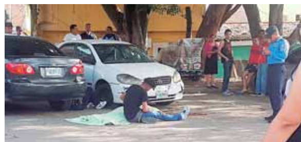
Un hermano llora sobre el cuerpo del hombre, quien quedó tendido en el estacionamiento a inmediaciones de una calle.