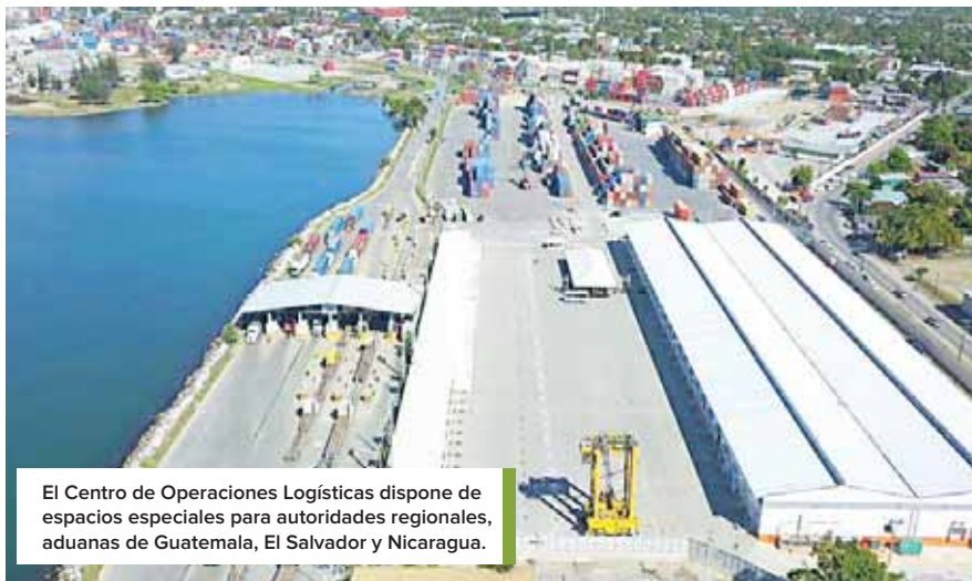
El Centro de Operaciones Logísticas dispone de espacios especiales para autoridades regionales, aduanas de Guatemala, El Salvador y Nicaragua.

También se cuenta con áreas adicionales de inspección techadas y cuatro jaulas para inspección de contenedores frigoríficos, eliminando cualquier riesgo de daño o contaminación en ese tipo de mercaderías; “este centro es el de mayor tamaño y tecnología dentro de Centroamérica”.