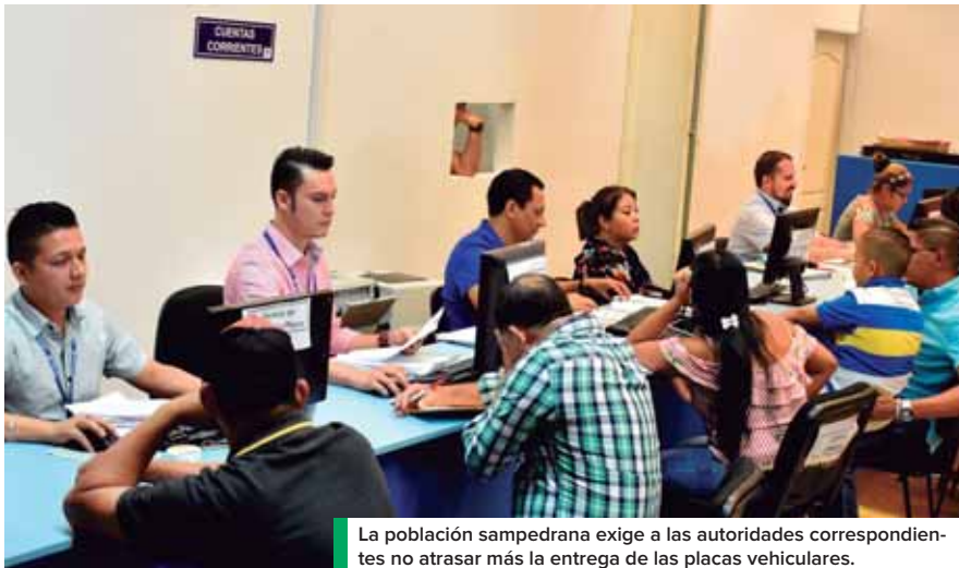
La población sampedrana exige a las autoridades correspondientes no atrasar más la entrega de las placas vehiculares.