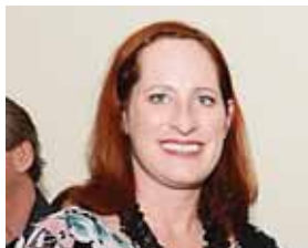
La funcionaria se reunió ayer con el fiscal Óscar Chinchilla.

Inmediatamente después tuiteó: “no será fácil, pero se necesita más progreso en la lucha contra la corrupción y la impunidad. Estados Unidos será un socio firme en esa lucha”.