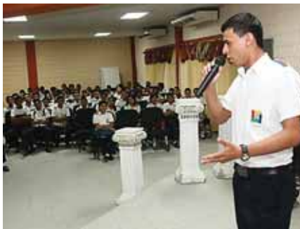
Fue alumno del Intae, donde tuvo la oportunidad de ganar una beca universitaria.