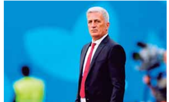
Suecia viene de realizar una buena fase dejando fuera a Alemania, una de las favoritas a ganar el Mundial.

SAN PETERSBURGO. AFP. “Estamos decepcionados, desde luego. Claramente pudimos hacer más. Felicitamos a Suecia, que fue el justo ganador. Hemos hecho mal las cosas, hemos enfocado mal nuestras emociones”, reflexionó Vladimir Petkovic, la rueda de prensa posterior a la derrota 1-0 en San Petersburgo.