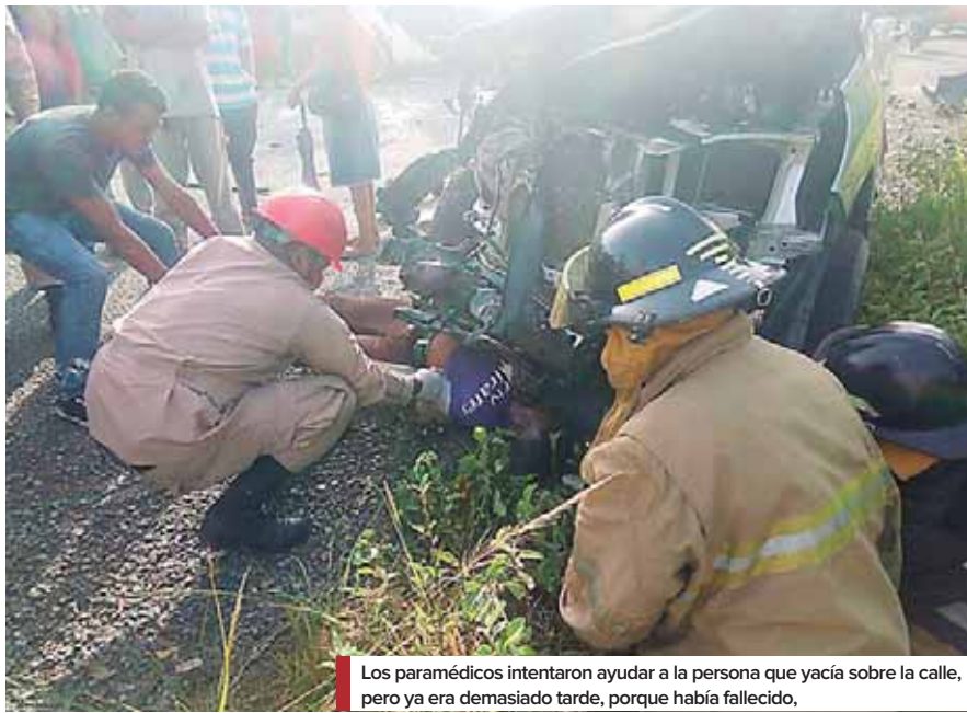
Los paramédicos intentaron ayudar a la persona que yacía sobre la calle, pero ya era demasiado tarde, porque había fallecido,