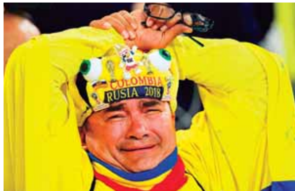
Hubo llanto en las gradas del estadio en Moscú, pues la afición cafetera confiaba en su selección.